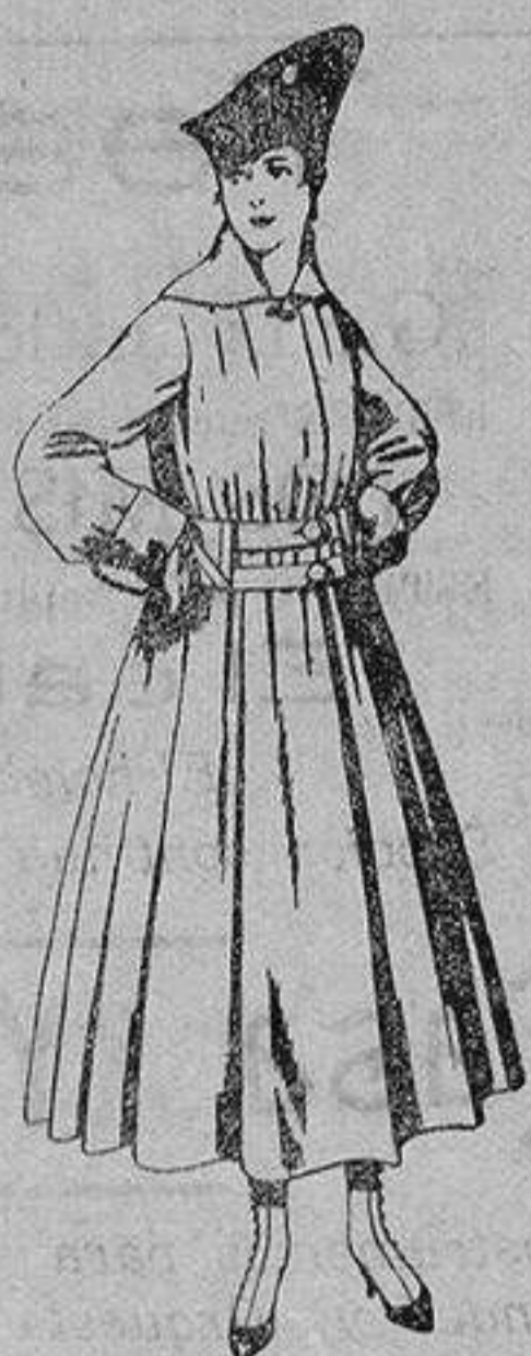
Abrigo de patén en color, para señora. De ptas. 50 a 60