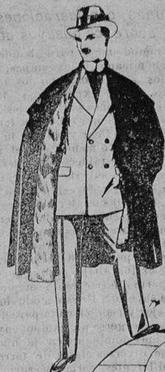
Capas (enteras) de paño de Béjar y Tarraza, embozos de peluche, terciopelo, astrakán o escocés. De ptas. 35 a 115