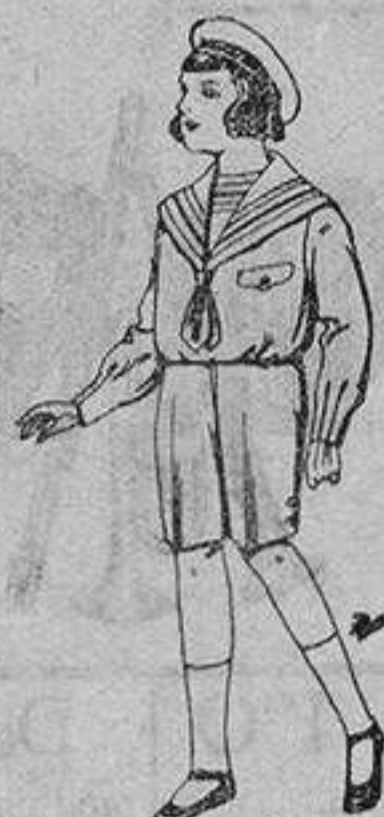
Trajes de patén para niños de 4 a 9 años. De ptas. 9 a 22

SECCIONES: Peletería, Camisería, Géneros de Punto, Corbatería, Guantería, Sombrerería, Zapatería, Paraguas, Bastones y Artículos de Viaje.