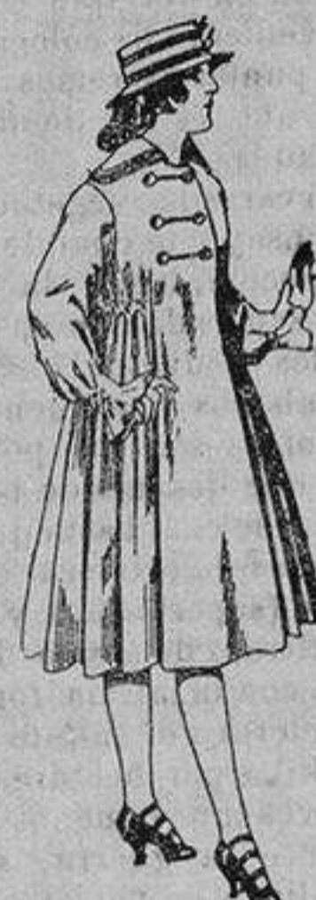
Abrigos de patén para jovencitas de 11 a 15 años. De ptas. 35 a 50