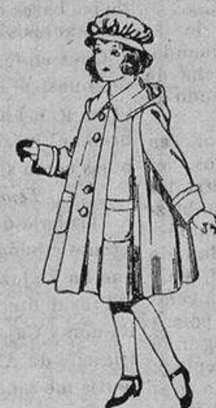
Abrigos de gabarrina impermeabilizada para niñas de 4 a 12 años. De ptas. 40 a 7

Precio Fijo - Ventas al contado Pídase el Catálogo General