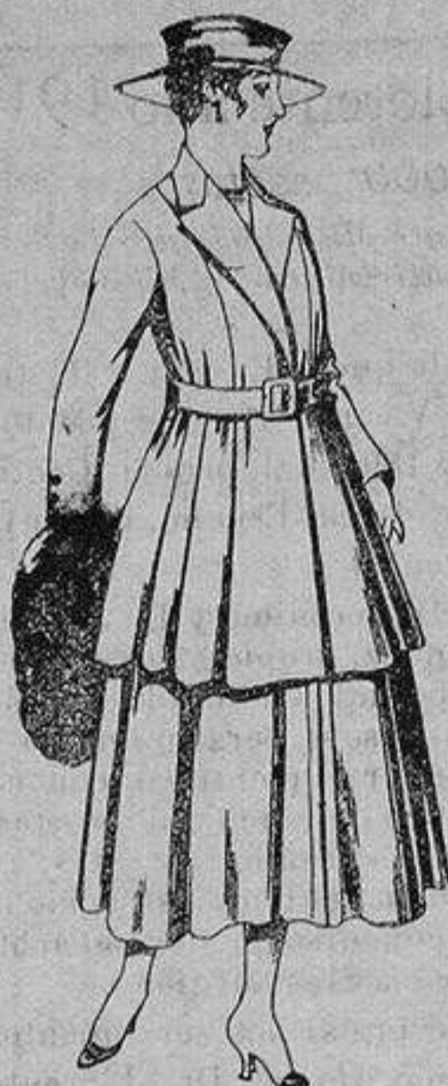
Traje de lana, para señora, en color negro y azul. De ptas. 85 a 100