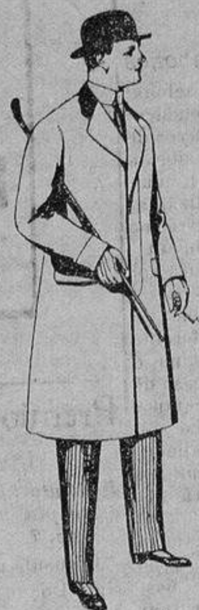
Gabanes de patén, meltón y cheviot, con forros seda, saén o esocés. De ptas. 33 a 110