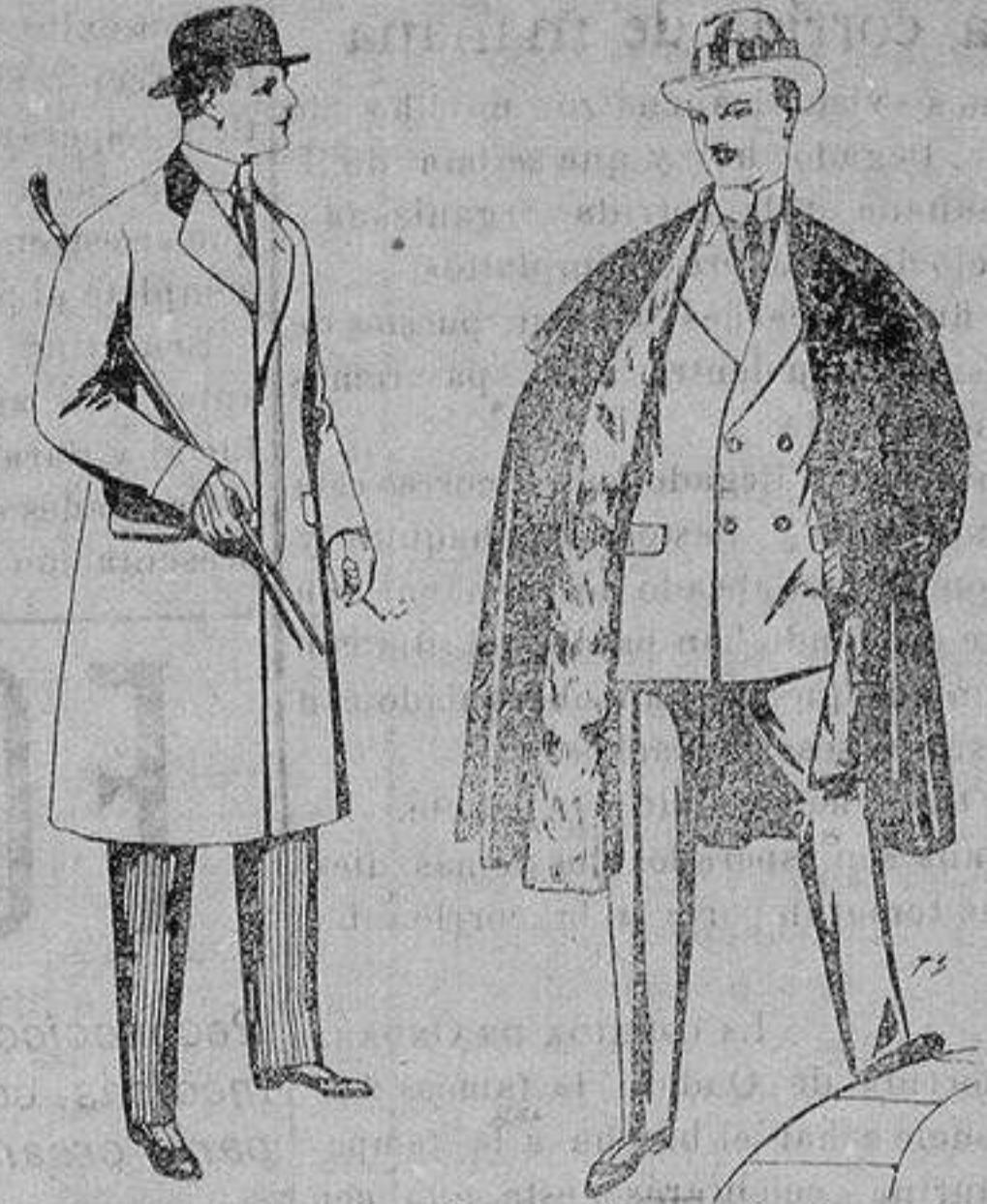
Gabanes de patén, melltón y cheviot, con forros seda, saén o escocés. De ptas. 33 a 110

Precio Fijo - Ventas al contado Pídase el Catálogo General