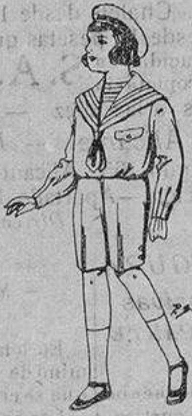
Trajes de patén para niños de 4 a 9 años. De ptas. 9 a 22