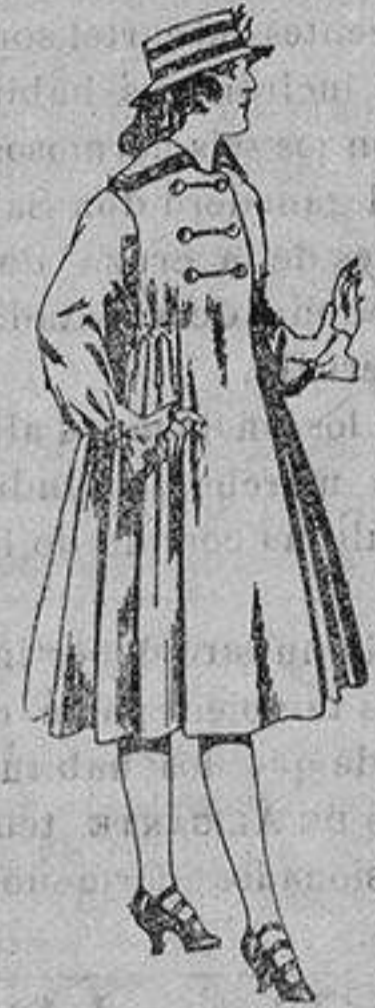
Abrigos de patén para jovencitas de 11 a 15 años. De ptas. 35 a 50,