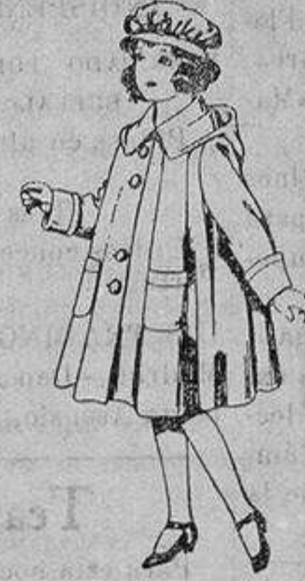
Abrigos de gabarrina impermeabilizada para niñas de 4 a 12 años. De ptas. 40 a 70