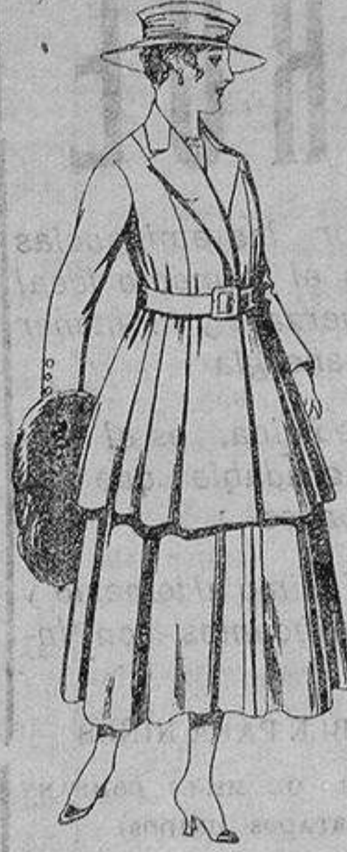
Traje de lana, para señora, en color negro y azul. De ptas. 85 a 100