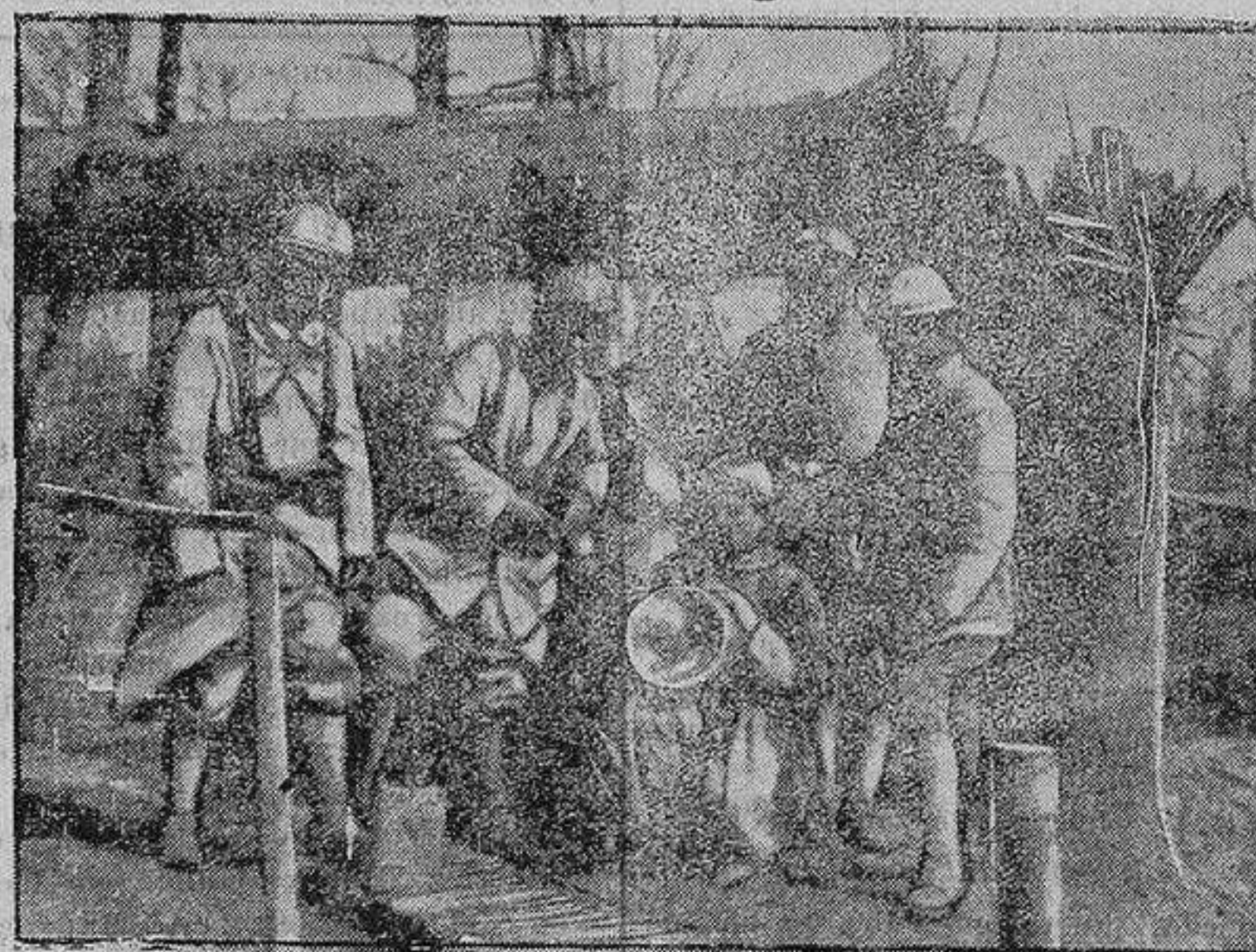
Señales a distancia con reflectores.