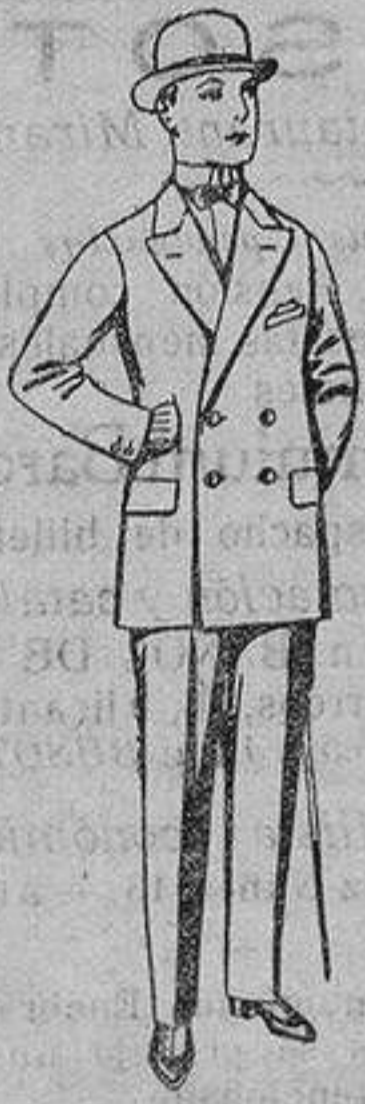
Trajes de patén vicuña o jerga, para niños de 10 a 12 años. De ptas. 23 a 45