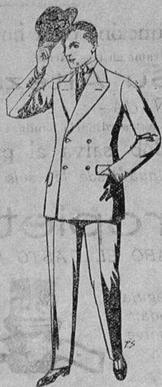
Trajes de cheviot, patén, etc. De ptas. 27 a 80