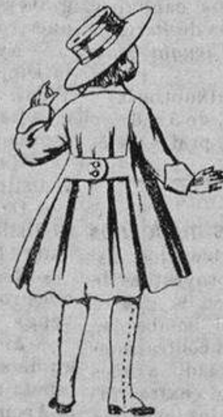
Abrigos de patén, para niñas de 4 a 9 años. De ptas. 15 a 17

Precio Fijo - Ventas al contado Pídase el Catálogo General