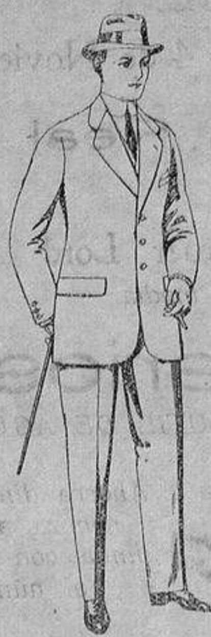
Trajes de cheviot, patén, etc. De ptas. 21 a 80

Madrid, Barcelona, Alicante, Almería, Bilbao, Cádiz, Cartagena, Gijón, Granada, Málaga, Palma de Mallorca, Santander, Sevilla, Valencia, Valladolid y Zaragoza.