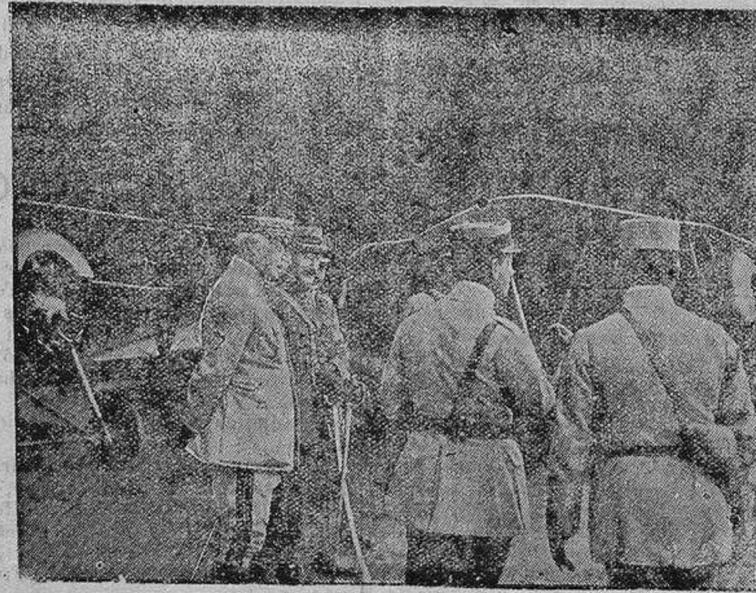
General francés en un parque de aviación