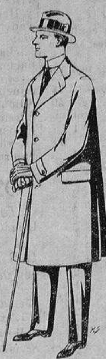
Gabanes de tejido pluma o ratina. De ptas. 33 a 110