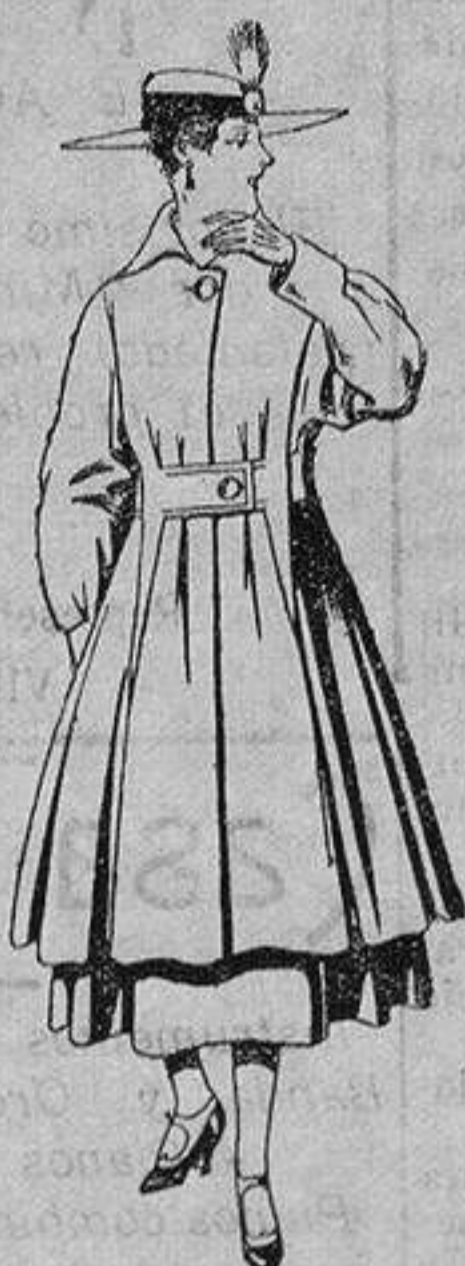
Abrigo de patén en color, para señora. De ptas. 65 a 75