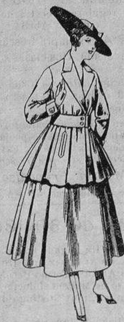
Traje de lana, para señora, en color negro y azul. De ptas. 85 a 100