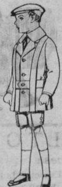
Trajes de patén para niños de 4 a 9 años. De ptas. 12 a 33