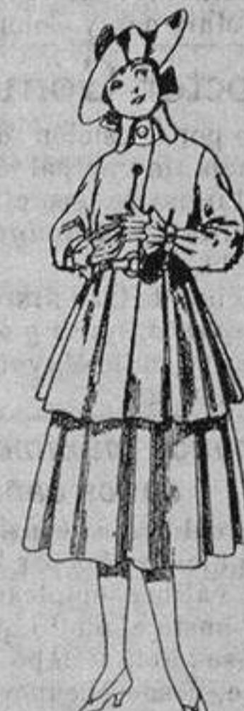
Trajes de lana, para jovencitas de 12 a 15 años. De ptas. 45 a 55