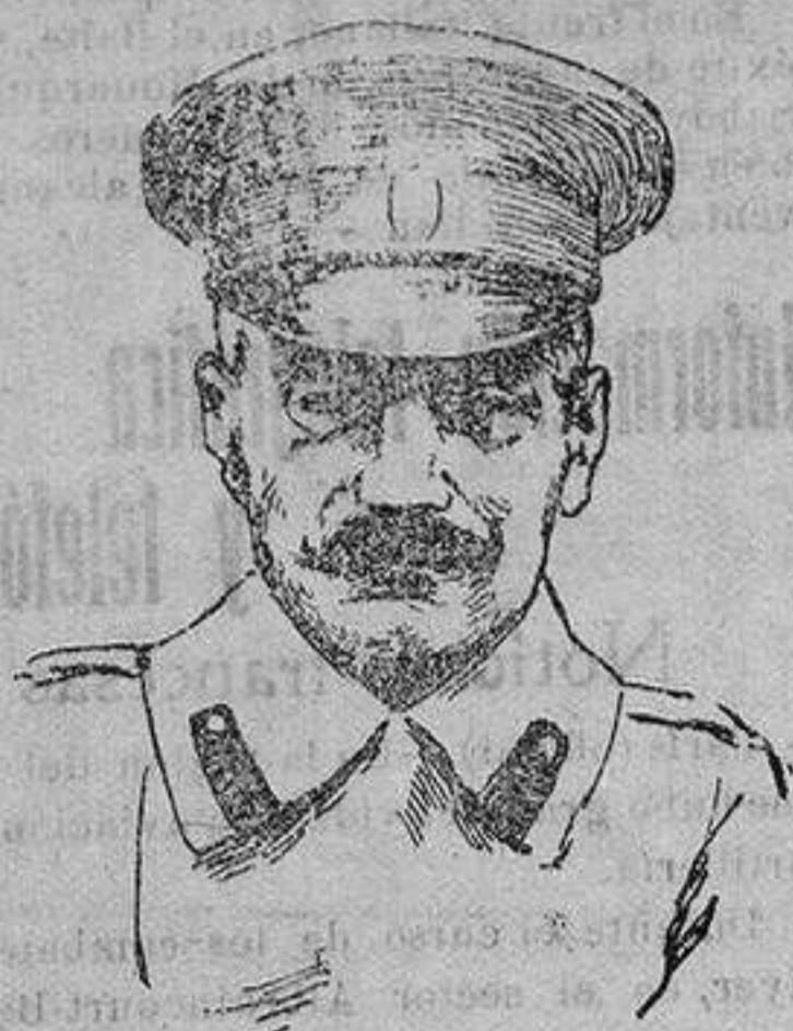
General BELAIEFF del Estado Mayor ruso y representante del Alto Mando moscovita en París