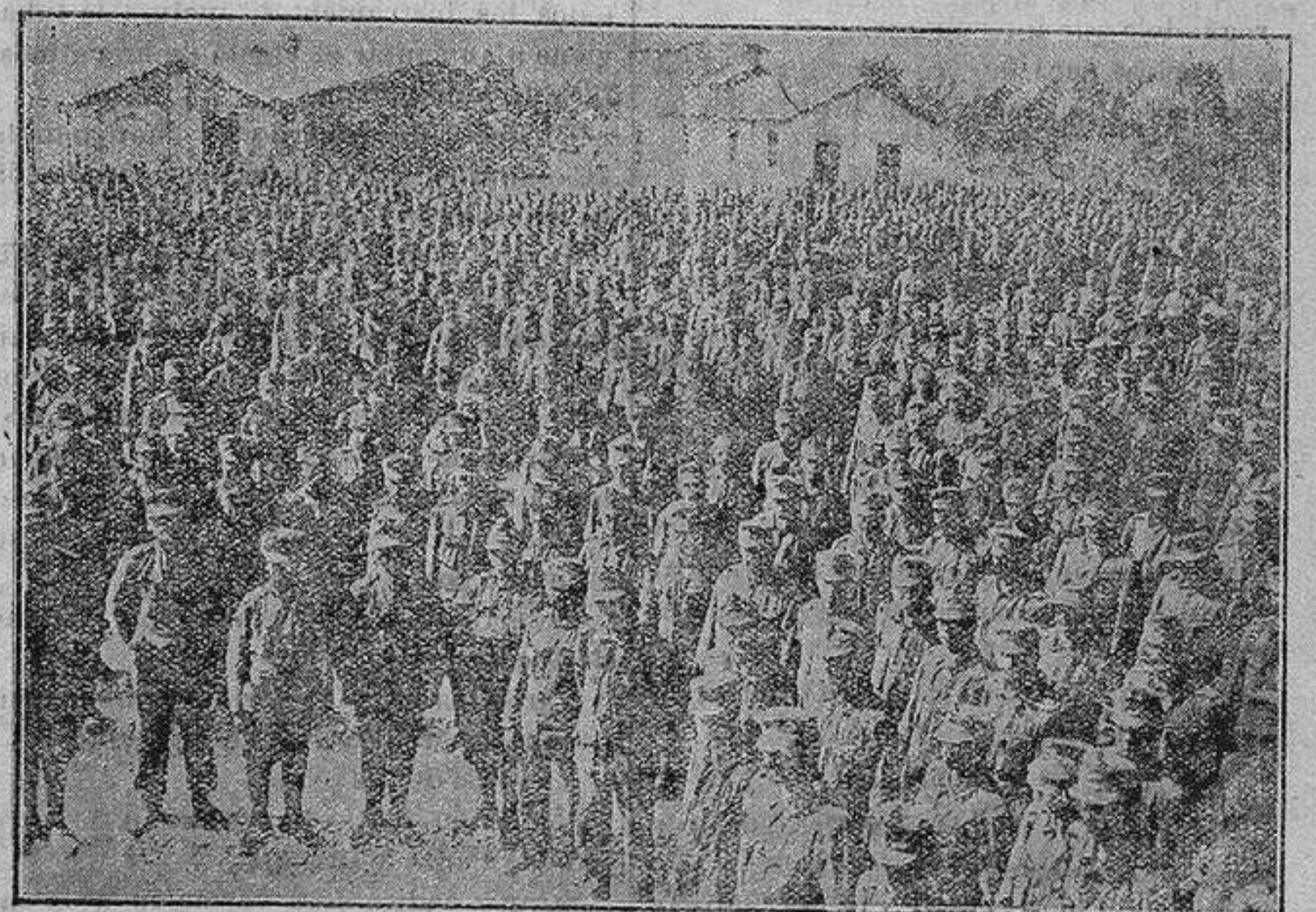
Prisioneros austriacos capturados por los italianos.