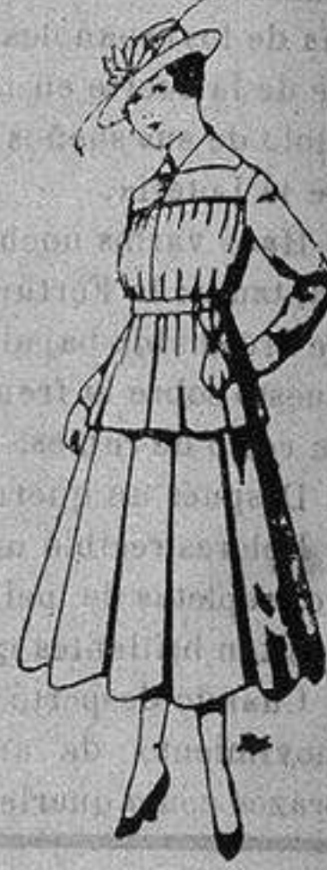
Trajes lanilla para jovencitas de 13 a 16 años. De ptas. 50 a 55