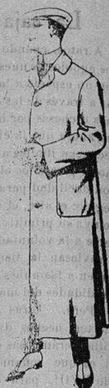
Guardapolvos de dril igual al modelo De ptas 6 a 11