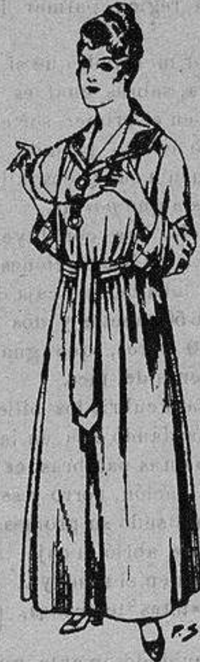
Batas de crespón, color cuello bordado De ptas. 10 a 15