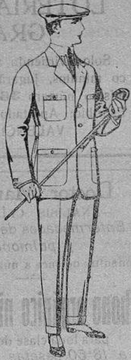
Trajes modelo sport, de lanilla A pesetas 40.

Madrid, Barcelona, Alicante, Almeria, Bilbao, Cadiz, Cartagena, Gijón, Granada Málaga, Palma de Mallorca, Santander, Sevilla, Valencia, Valladolid y Zaragoza.