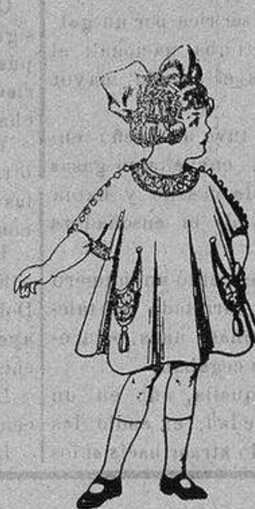
Vestidos de lanilla para niñas de 4 a 9 años De ptas. 80 a 38

Precio Fijo - Ventas al contado Pídase el Catálogo General