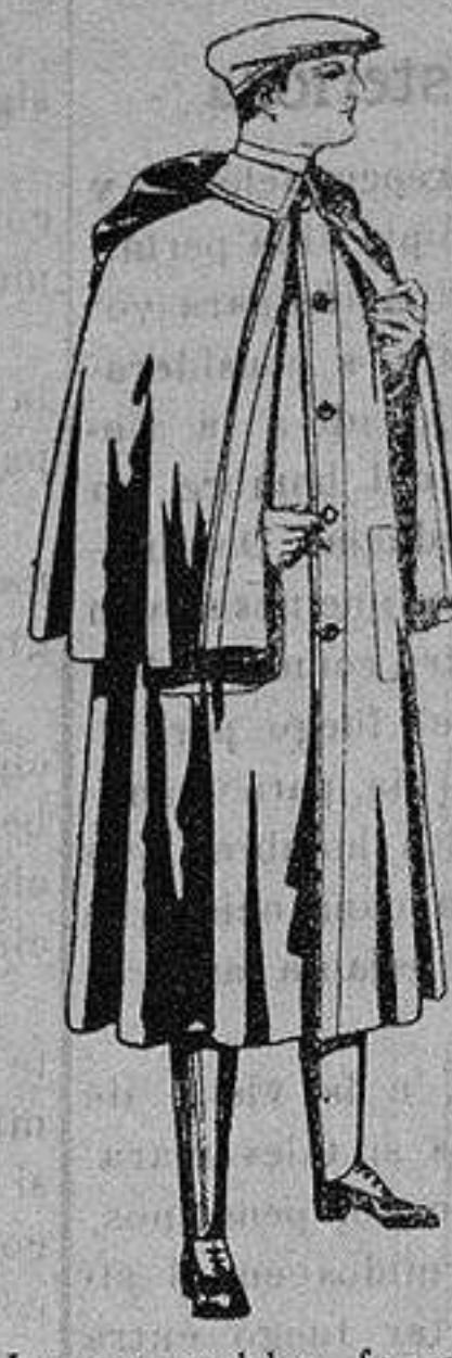
Impermeables forma mackferland, en negro y azul. De ptas. 55 a 100