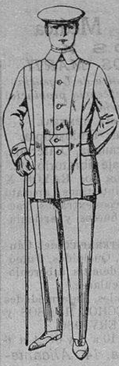
Cazadoras de dril crudo o kaki De ptas. 12 a 18