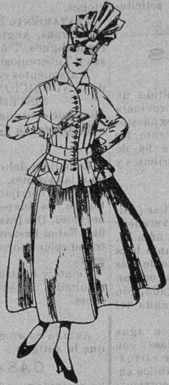
Trajes de lanilla, negra, azul y color. A ptas. 70