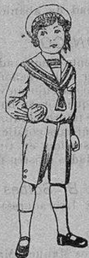
Trajes marinera de vicuña azul para niños de 4 a 9 años. De ptas. 6 a 20

Precio Fijo - Ventas al contado Pídase el Catálogo General