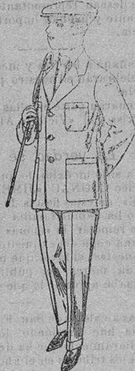
Trajes modelo sport, de dril listado, para jovencitos de 15 a 16 años. De ptas. 17 a 48.