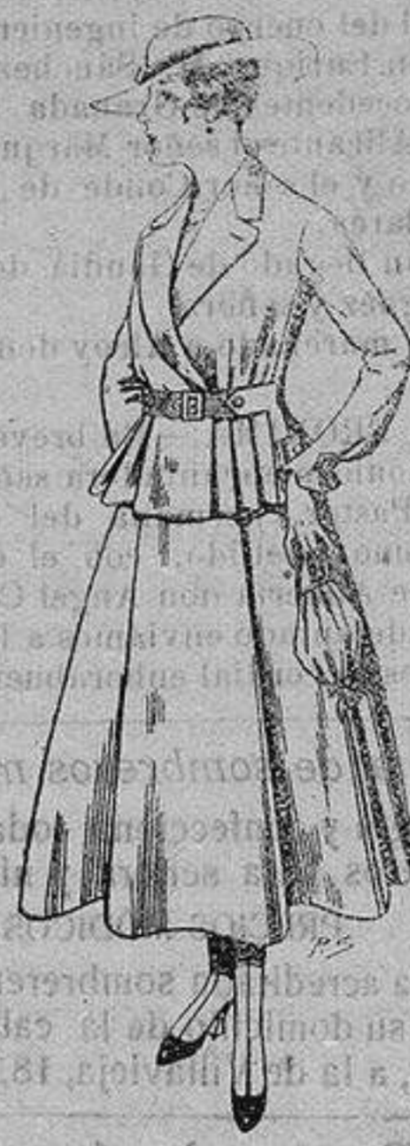
Trajes de lanilla para Señora A ptas. 70