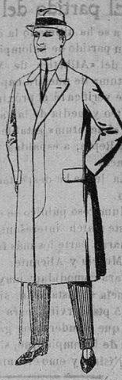
Pardesus de melton o vigonia De ptas. 25 a 100