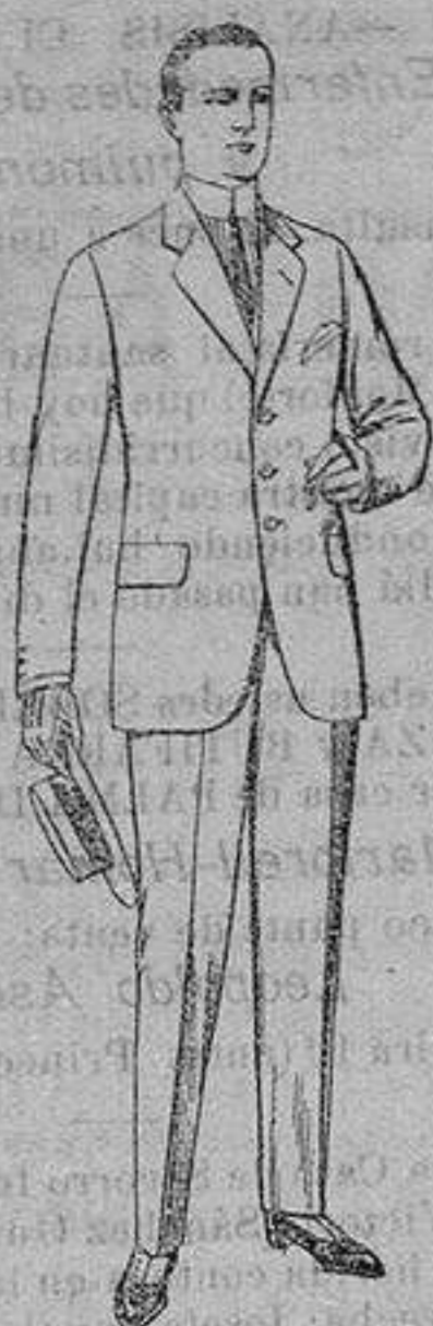
Trajes de lanilla, cheviot, etc. De ptas. 1750 a 73

Madrid, Barcelona, Alicante, Almería, Bilbao, Cádiz, Cartagena, Gijón, Granada Málaga, Palma de Mallorca, Santander, Sevilla, Valencia, Valladolid y Zaragoza.