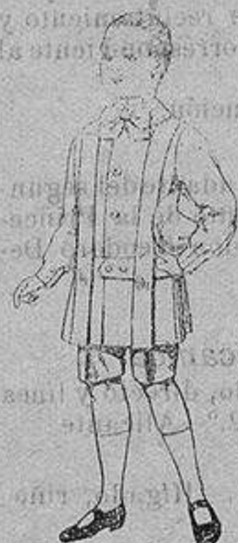
Trajes de lanilla para niños de 4 a 9 años De ptas. 12 a 31