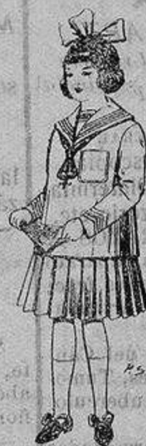
Trajes de lanilla para niñas de 4 a 12 años De ptas. 32 a 40