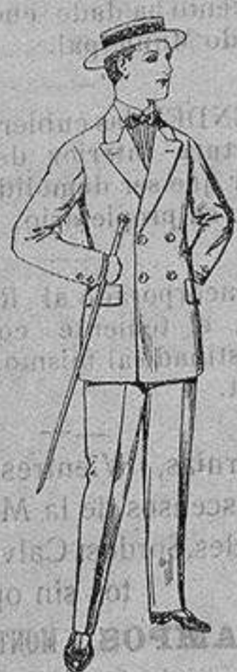
Trajes de lanilla, para jovencitos de 10 a 16 años. De ptas. 17 a 48