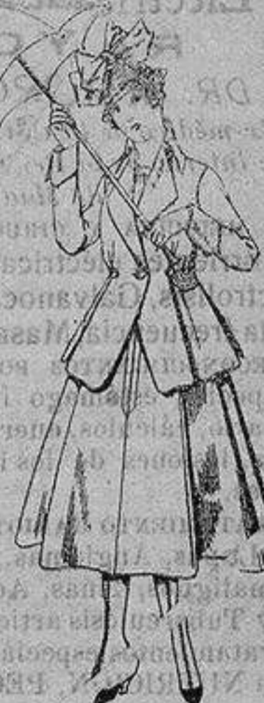
Trajes de lanilla para jovencitas de 13 a 16 años De ptas. 53 a 55

Camisería, Géneros de Punto, Corbatería, Guantería, Sombrerería, Zapatería, Paraguas, Bastones y Artículos de Viaje.