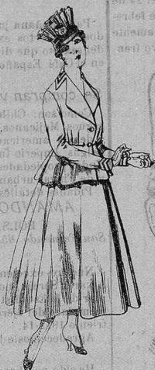
Trajes de lanilla para Señora A ptas. 80