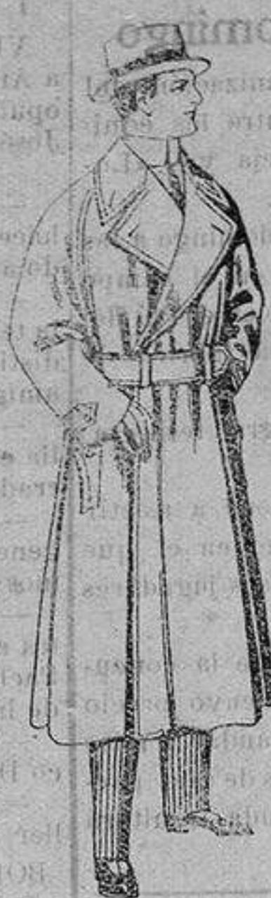
Gabanes impermeabilizados en color beige. De ptas. 65 a 110