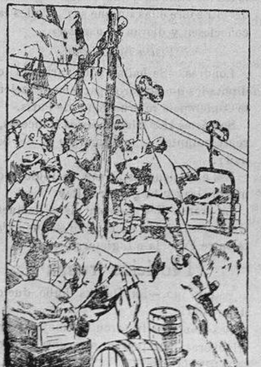
Forma en que el ejército italiano tiene que transportar los víveres a sus posiciones de los Alpes