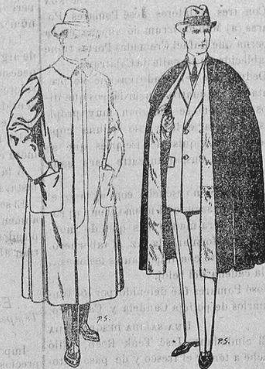
Impermeables forma gabán en color beige o gris De ptas. 35 a 100