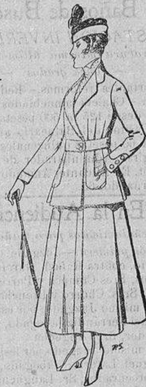
Trajes de lana negra azul y color, para señora De ptas. 50 a 55