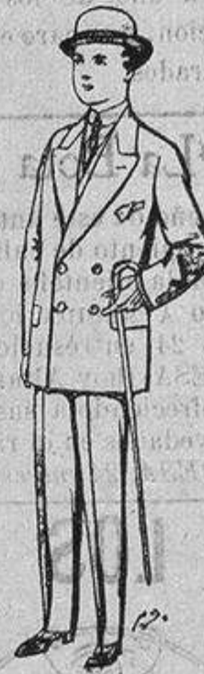
Trajes de patén, vicuña, etc., para niños de 10 a 16 años De ptas. 25 a 48