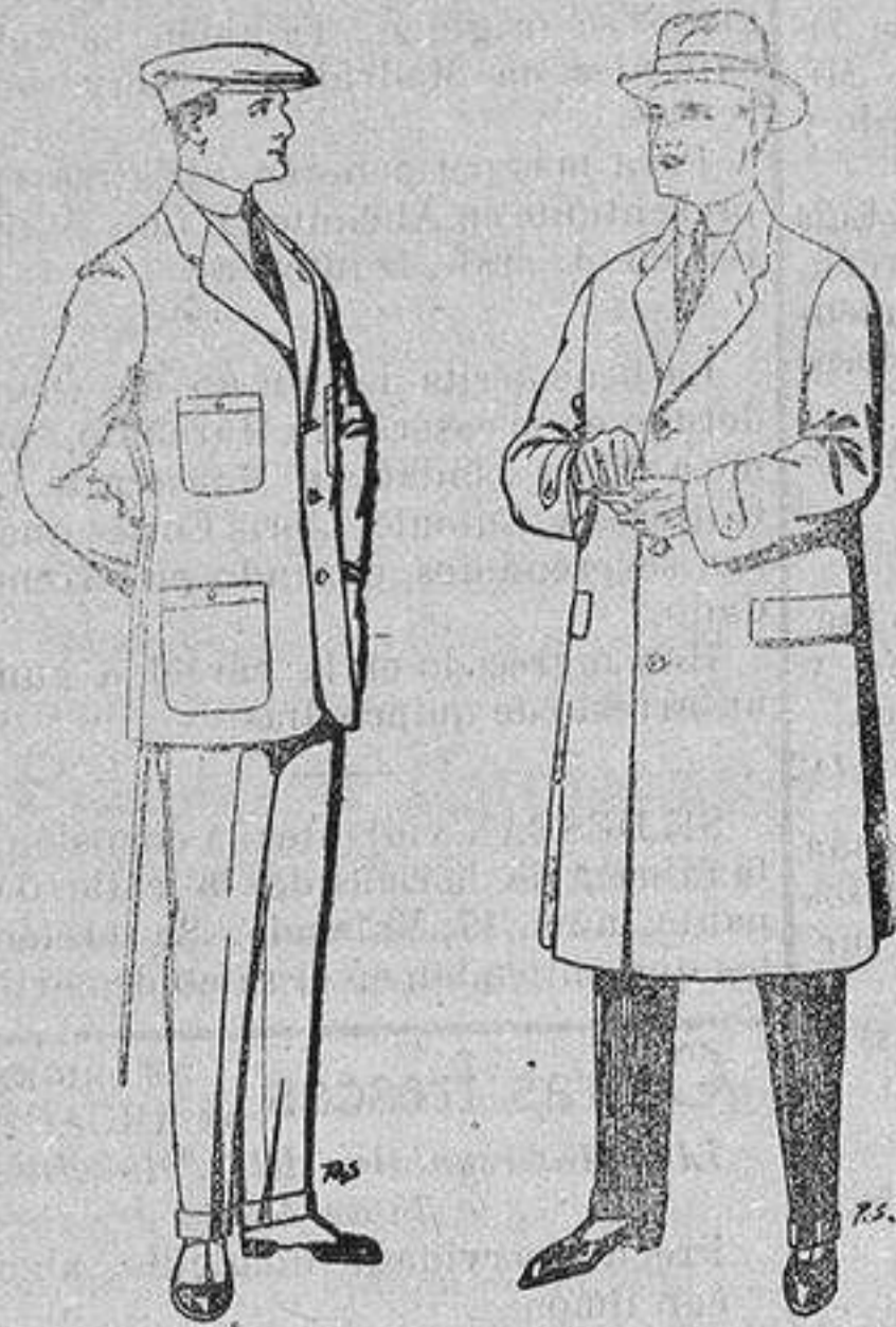
Trajes de cheviot corte elegante para «Sportman» De 35 a 50 ptas.

Peletería, Camisería, Generos de Punto, Corbatería, Guantería, Sombrerería, Zapatería, Paraguas, Bastones y Artículos de Viaje.