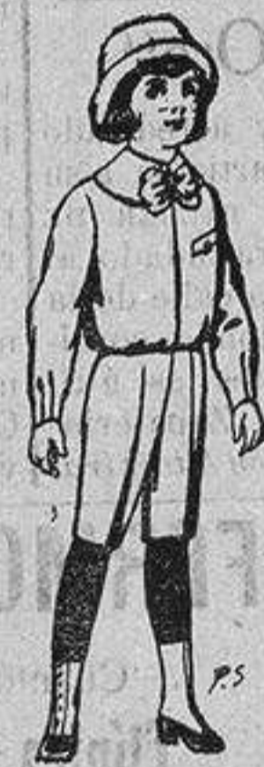
Trajes de patén para niños de 4 a 9 años De ptas. 5 a 7'50