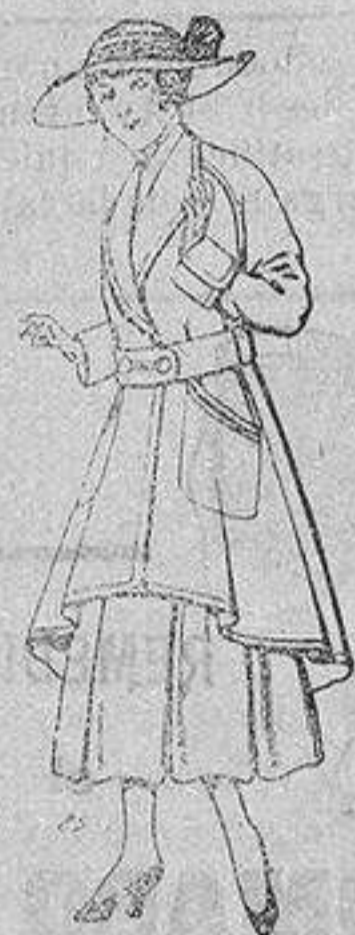
Abrigos de patén para jovencitas de 13 a 16 años De ptas. 25 a 35