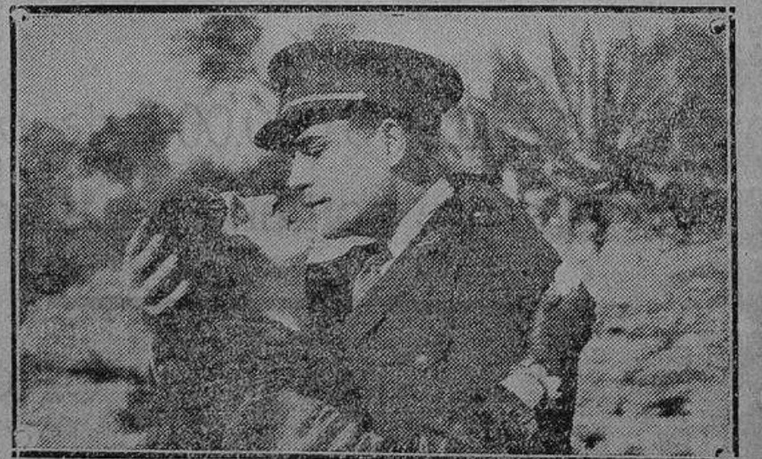
La notable actriz berlinesa Helga Moja luciendo la clásica mantilla interpretando la protagonista de «Sonrisas y lágrimas».