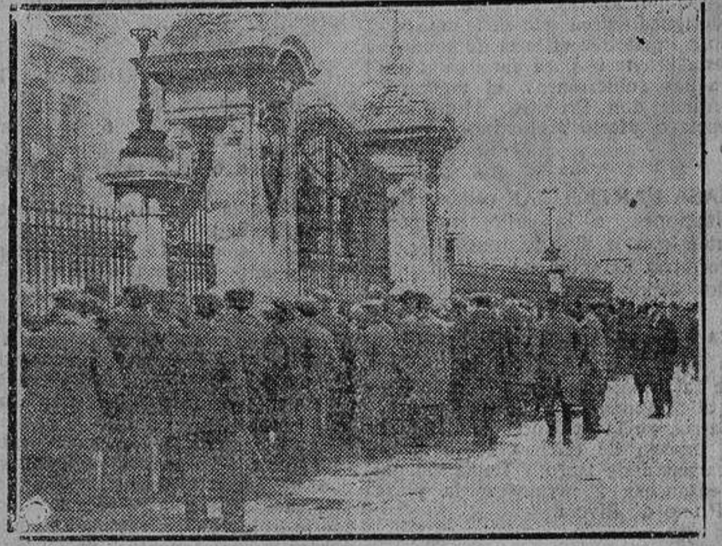
Durante la enfermedad del Rey Jorge de Inglaterra, el público permanece constantemente estacionado ante el Palacio de Buckingham para informarse de los partes facultativos.