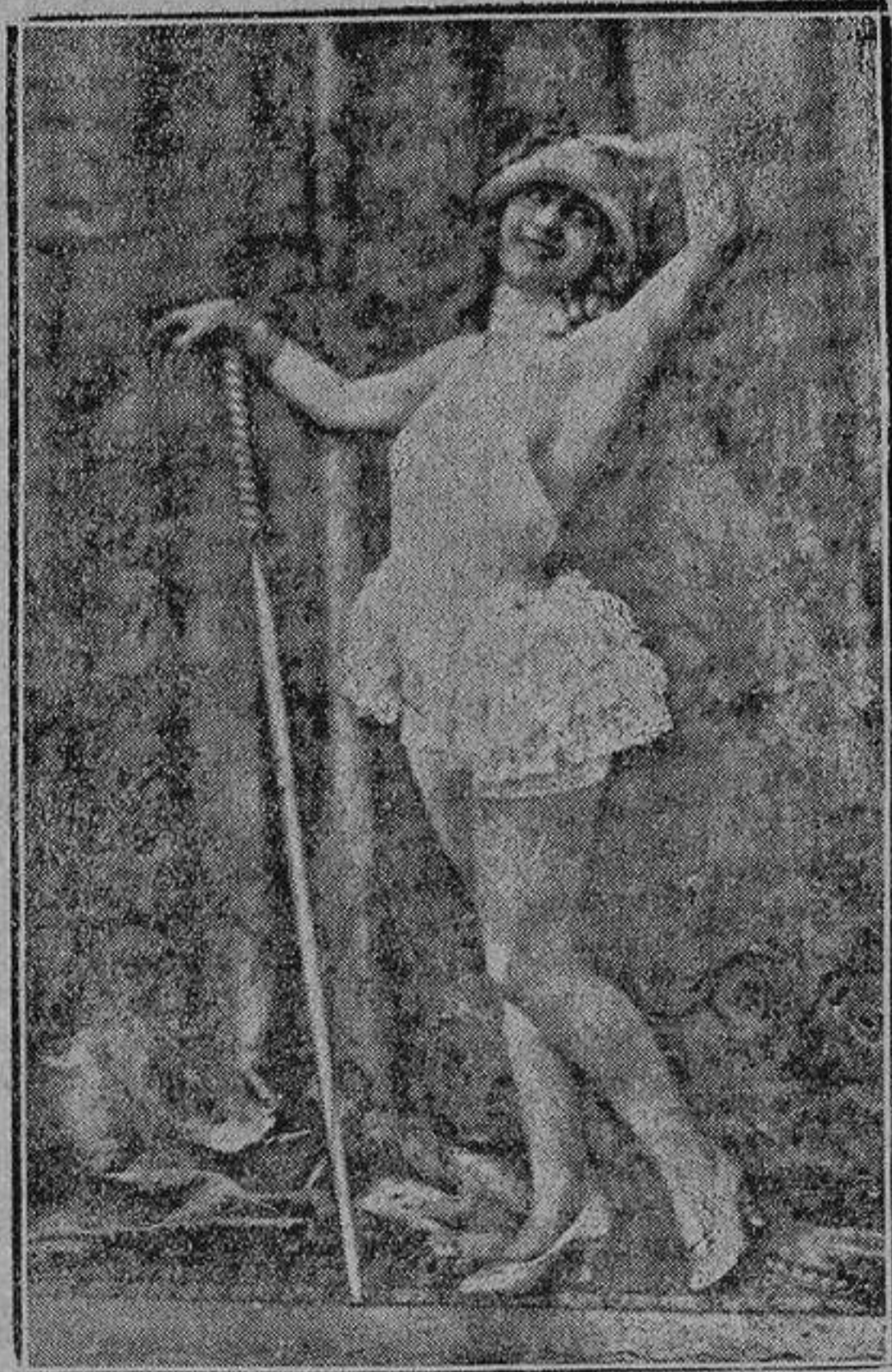
Genial artista creadora en la penúltima de «El negro que tenía el alma blanca» que mañana se presentará en el Teatro Principal con sus sugestivas danzas admirables

Aunque el club fué construido exclusivamente para los actores hombres y para sus hijos, las mujeres tienen también entrada en los departamentos atléticos los miércoles por la mañana.