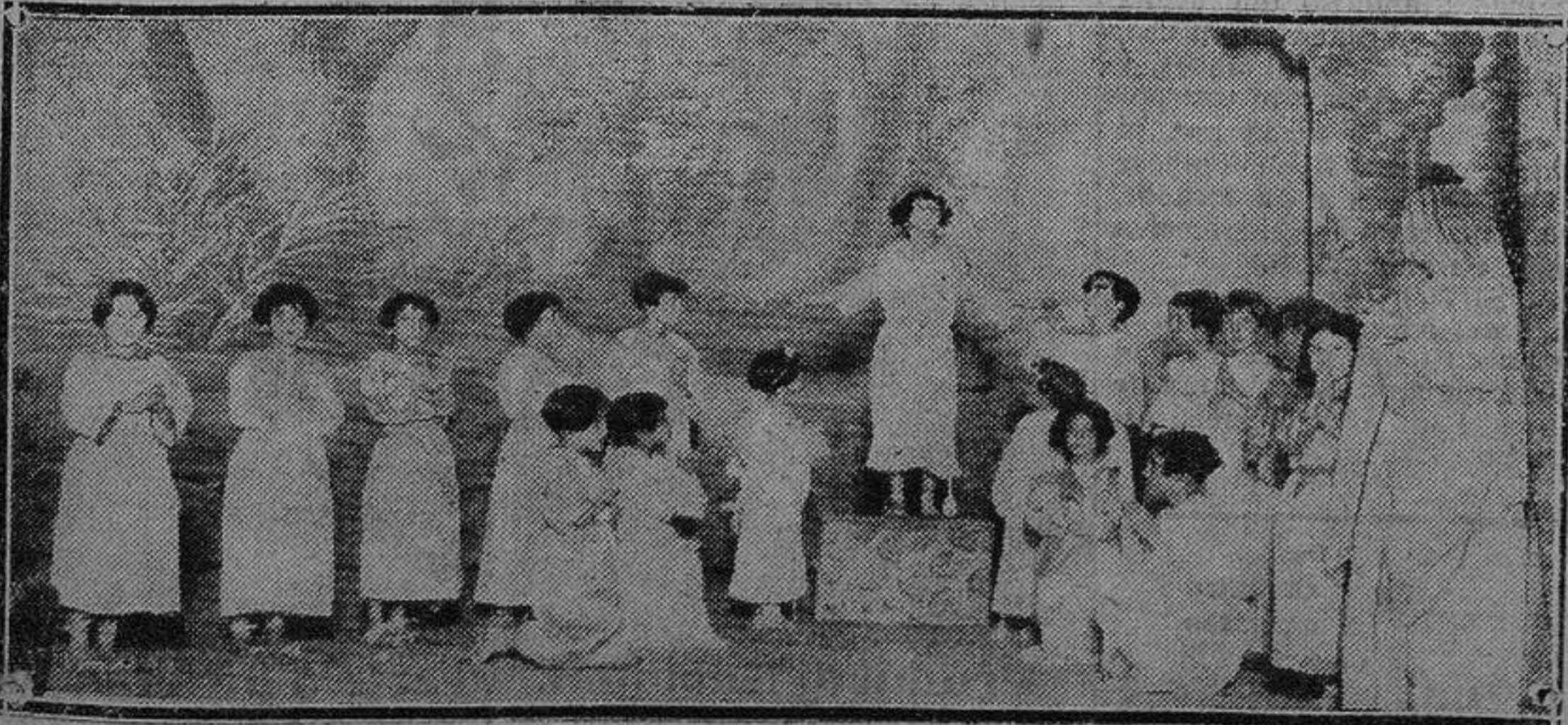
Un cuento en acción, representado por los pequeños actores de la Sección juvenil de la Cruz Roja Española en el festival celebrado el domingo en el teatro del Centro en honor a los niños de los Asilos y Escuelas