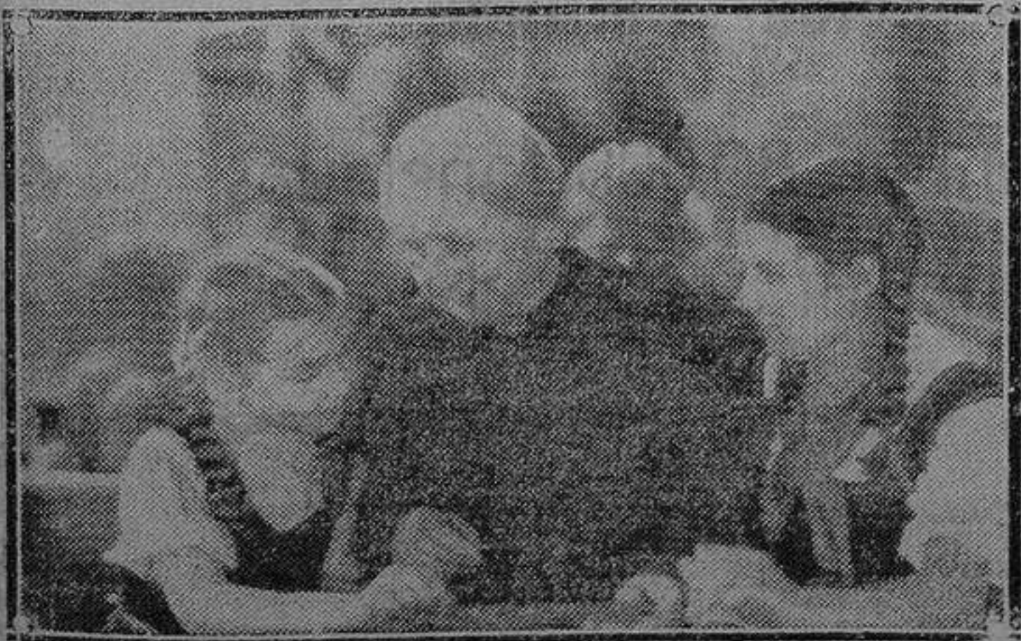
Una de las escenas de mayor ternura de la película «Cuatro hijos», que tan gran éxito logró en el Central