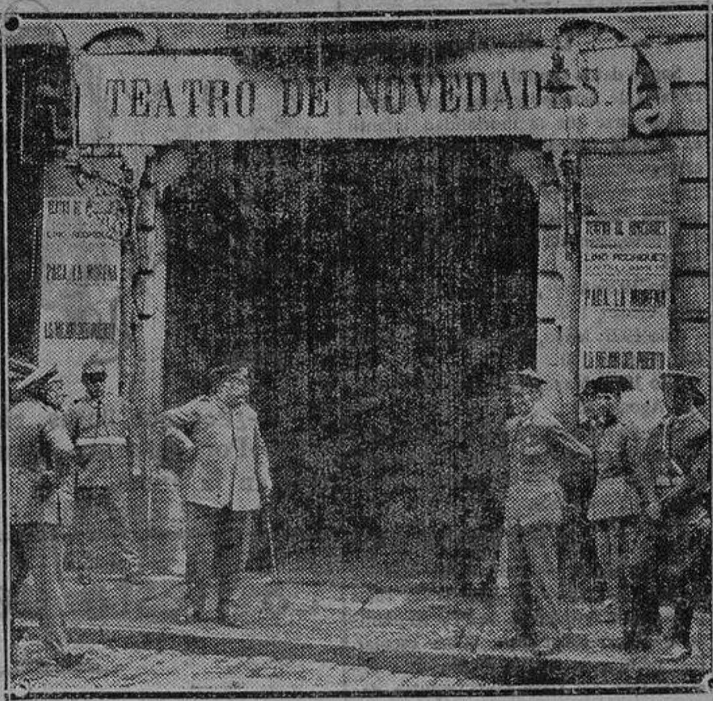
Fachada del Teatro durante el incendio

La vetustez del edificio hizo pensar en su demolición para dar lugar a otras construcciones. Hace dos años una entidad bancaria entró en negociaciones para adquirirlo, pero desistió por lo elevado del coste.