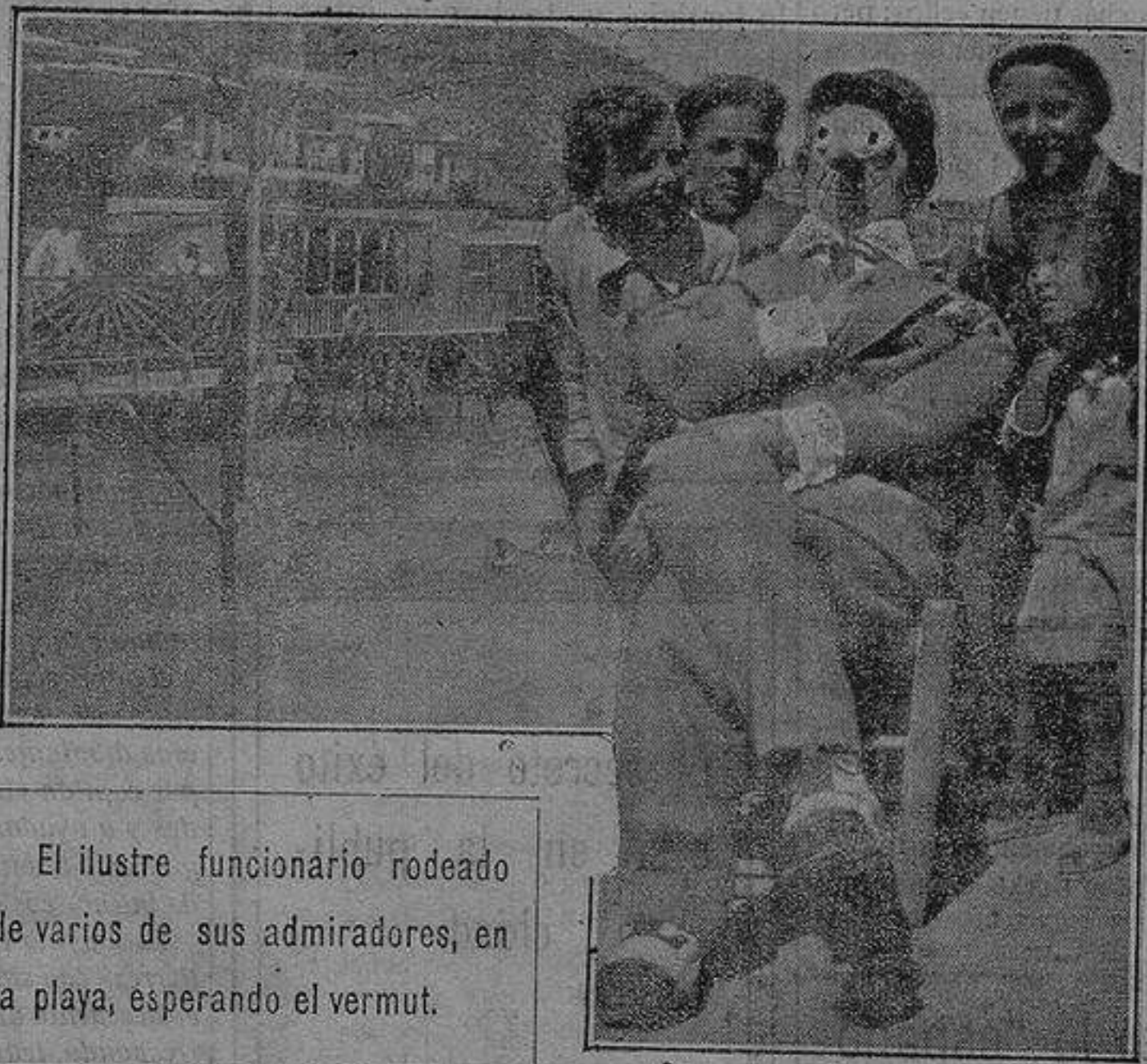
El ilustre funcionario rodeado de varios de sus admiradores, en la playa, esperando el vermut.