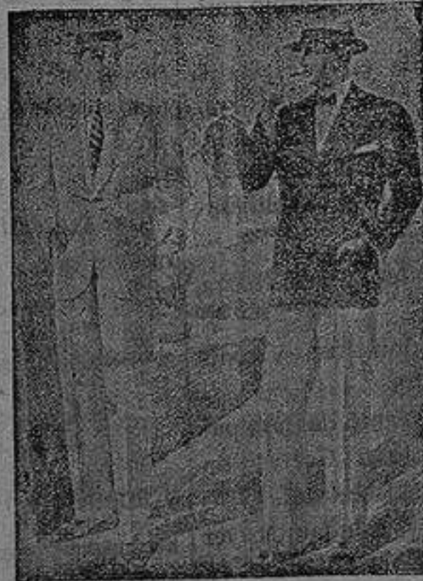
Sa gasta, 63