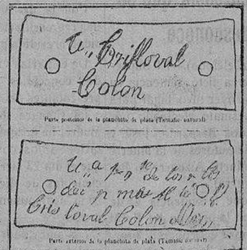
Arriba: Parte posterior de la planchita de plata.—Abajo: Parte exterior.