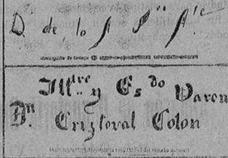
Arriba: Inscripción de la tapa del ataúd de plomo.—Abajo: Inscripción del interior