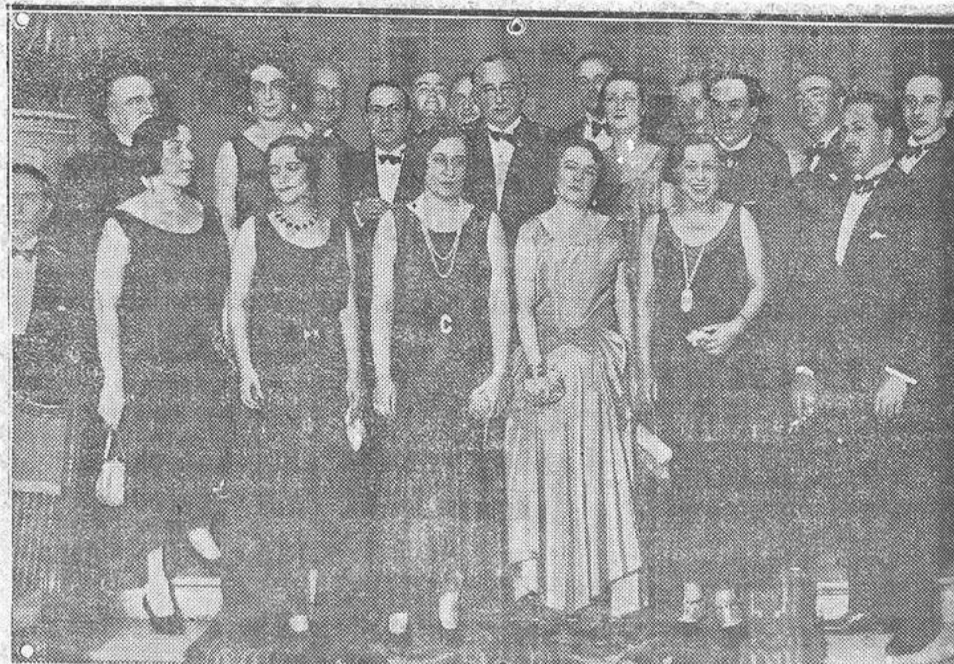
El presidente del Consejo con los hermanos Mchado y algunos de los concurrentes a la fiesta celebrada en el Ritz en honor de los aplaudidos autores de «La Lola se va a los puertos»