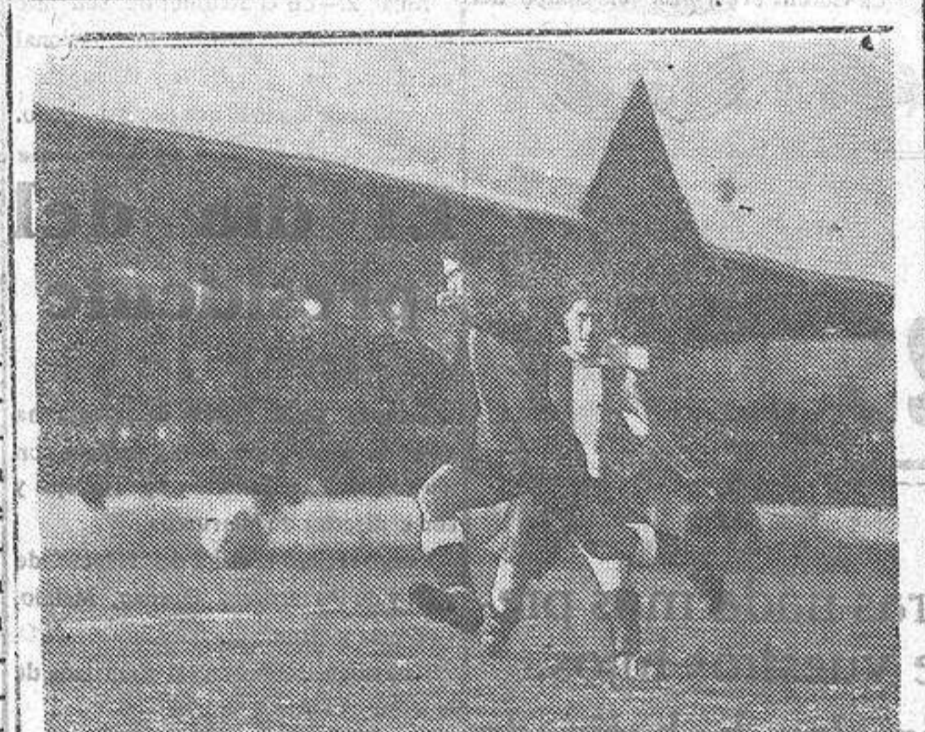
Una intervención de Moreno en el partido Racing-Nacional jugado el domingo en Madrid.

El Levante venció por tres a dos al Castellón.