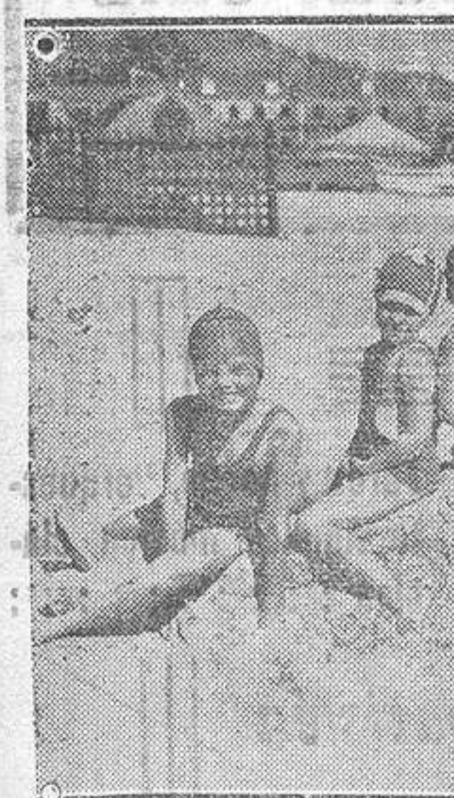
Charles King, el joven actor de comedias musicales, que se ha hecho conocer en «Broadway Melody», solazándose en la playa con sus tres deliciosos chiquillos.

de la Ufa, todavía no estrenada «El diablo blanco». Nuevo éxito de cintas culturales En el Congreso Internacional de la Cinematografía Independiente, celebrado hace poco en el palacio de Madame de Mandrot en Sarraz, cerca de Ginebra, fueron proyectadas películas dramáticas de diversos países de algunos documentos de la Ufa, entre ellos «Repites de la selva virgen», «Magia del microscopio» y «Gimnasia femenina moderna». Estas producciones causaron entre todos los presentes una excelente impresión. Los perros de Harold Harold Lloyd pagó la suma de 2.000 dólares al mes por la manutención y cuidado de su «perrada», y puede así porque tiene un verdadero museo viviente de toda clase de perros, desde los diminutos pekinenses hasta los mastines alemanes y galgos rusos. Solamente decirse perros daneses tiene la cantidad de «caravana». Buster Keaton se pasa al cine hablado Hallándose al borde del precipicio que conduce a la peseta hablada, Buster Keaton está planeando un salto original en sus turbulentas aguas. Terminado que haya su última película muda, Buster y su camarilla están proyectando una entrada triunfal en el territorio de la película hablada, dando un salto que puede casi calificarse de salto mortal.