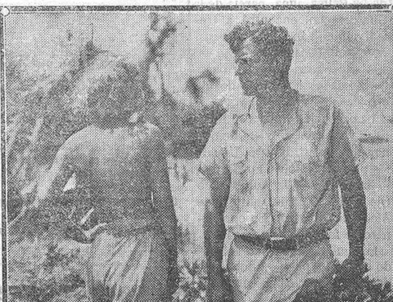
Dorothy Mackaill aparece en la última moda de esotados, según lo dictan los mojes de Honolulu. Milton Sills la contempla con aprobación. Escena de Stranded in Paradise.

John Gilbert y su esposa, Ina Claire, que contrajeron nupcias hace poco, con