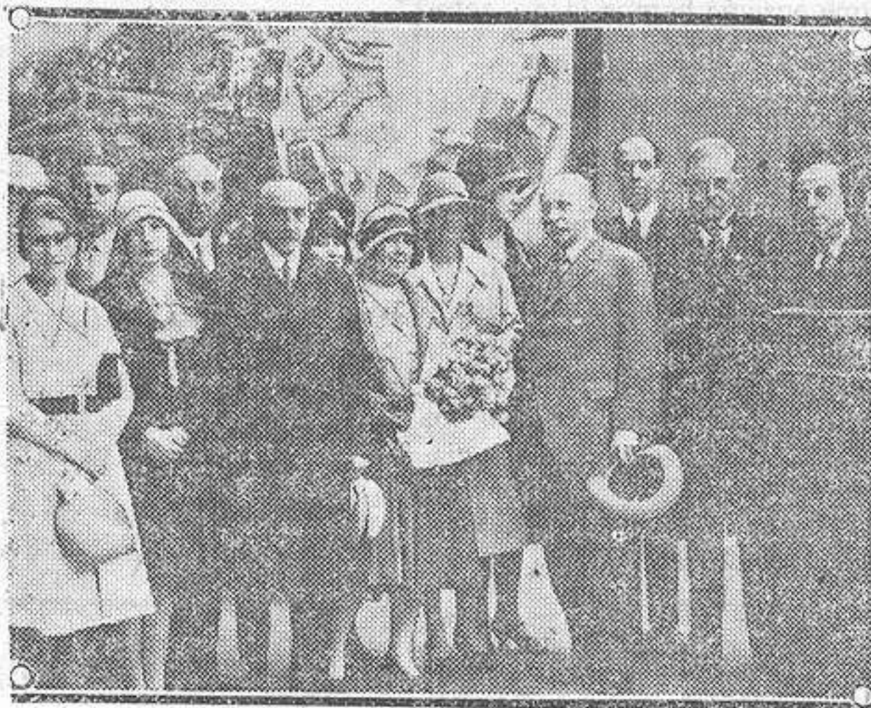
El director general de Bellas Artes, el embajador de Francia y algunos de los invitados que concurrieron a la apertura del IX Salón de Otoño, en Madrid.