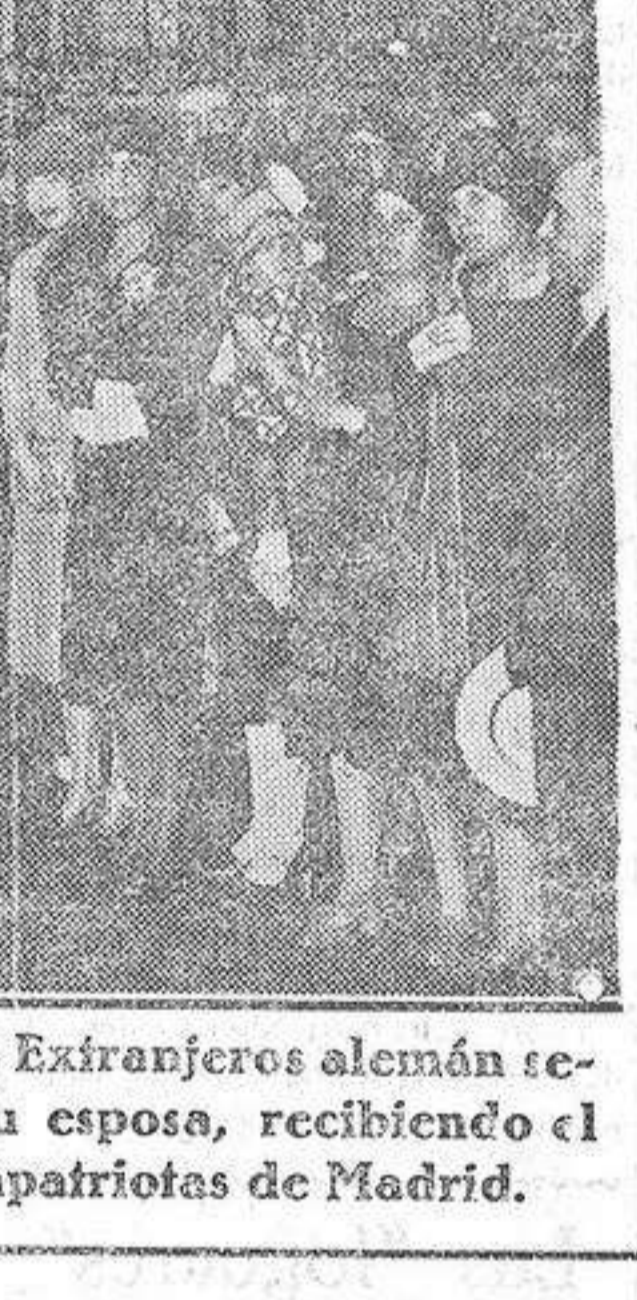
El ministro de Negocios Extranjeros alemán señor Stressemann con su esposa, recibiendo el homenaje de sus compatriotas de Madrid.