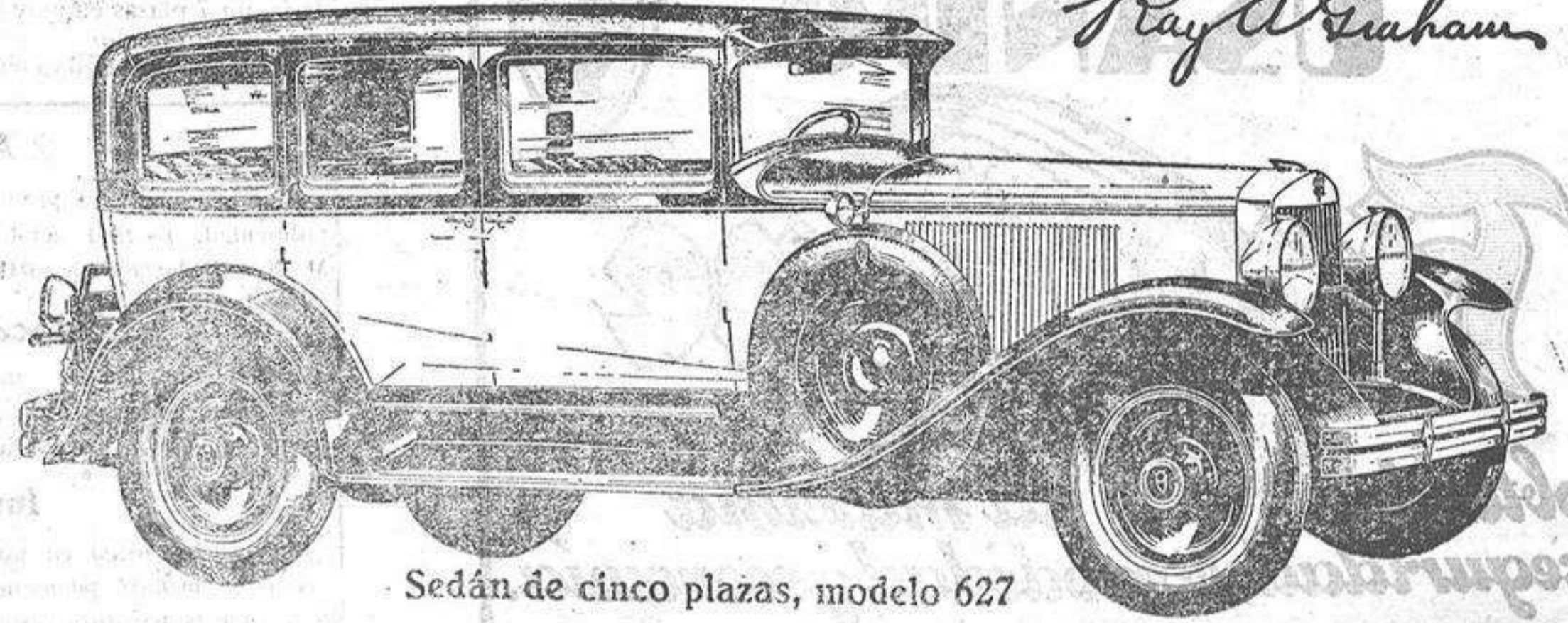
Sedán de cinco plazas, modelo 627