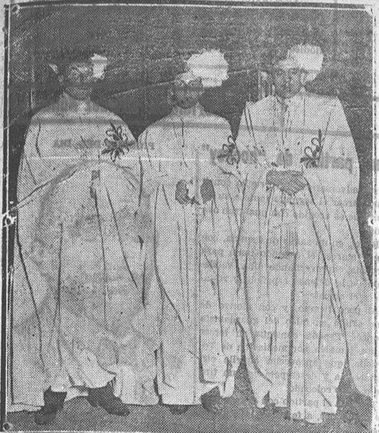
El Príncipe don Alvaro de Orleans que ayer tomó el hábito de la orden militar de Calatraba, acompañado de los Infantes don Jaime y de don Alfonso.

Señoras: El flujo y enfermedades de la matriz se curan con las irrigaciones del DOCTOR VALLEY . USADLAS POR HIGIENE Y PARA EVITAR CONTAGIOS. Agentes exclusivos para España y Portugal.