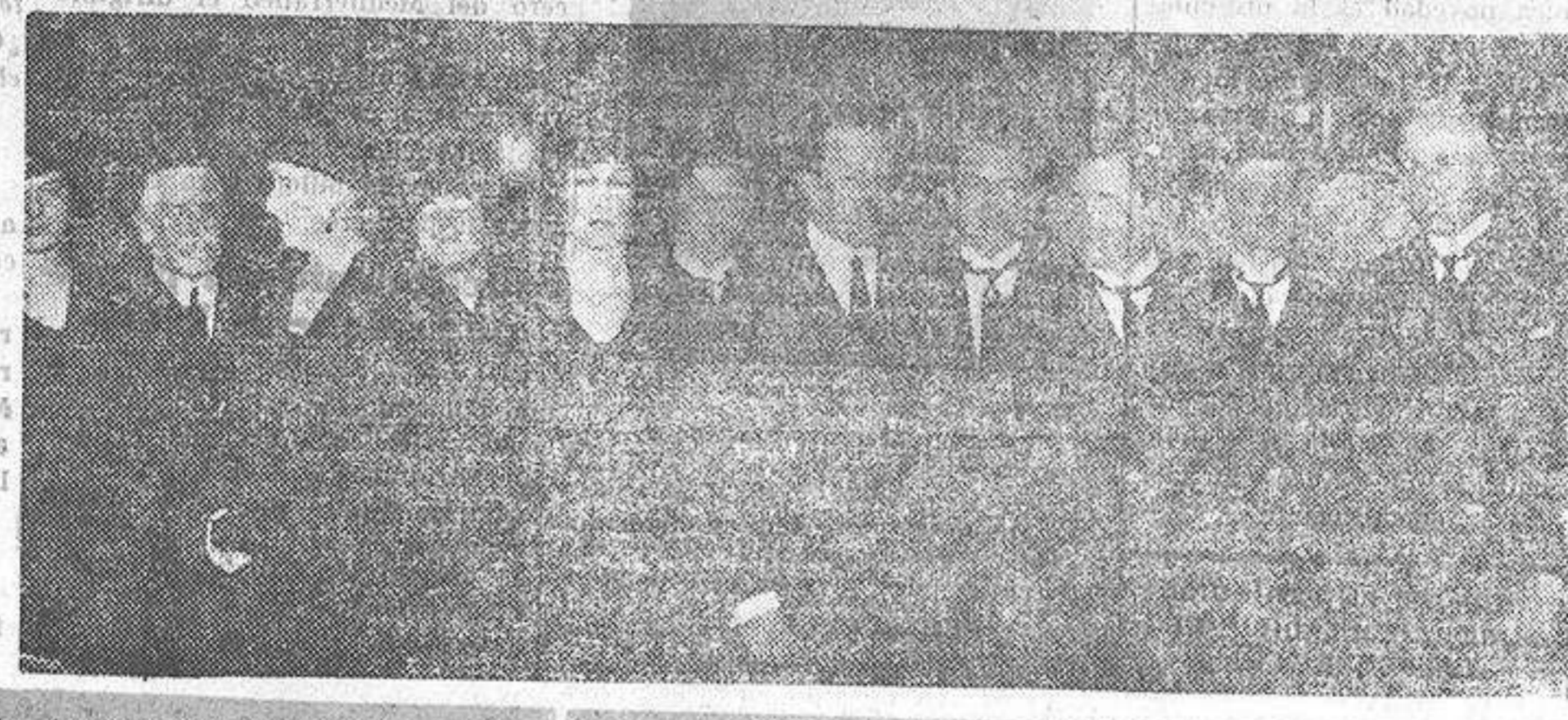
La familia Real con el ministro de Hacienda durante el acto de apertura de la exposición de flores instalada en el Retiro