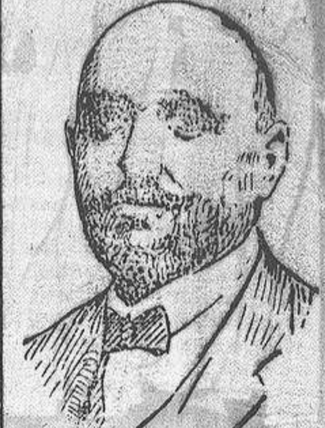
El ilustre jurisconsulto Don Angel Ossorio y Gallardo, que ha sido elegido, por unanimidad, académico de número de la de Ciencias Morales y Políticas, en la vacante del Conde de Lopez Muñoz.

Se acerca Corpus, lo mismo que se acercará usted a la Sastrería DANIEL - Sagasta, 63.