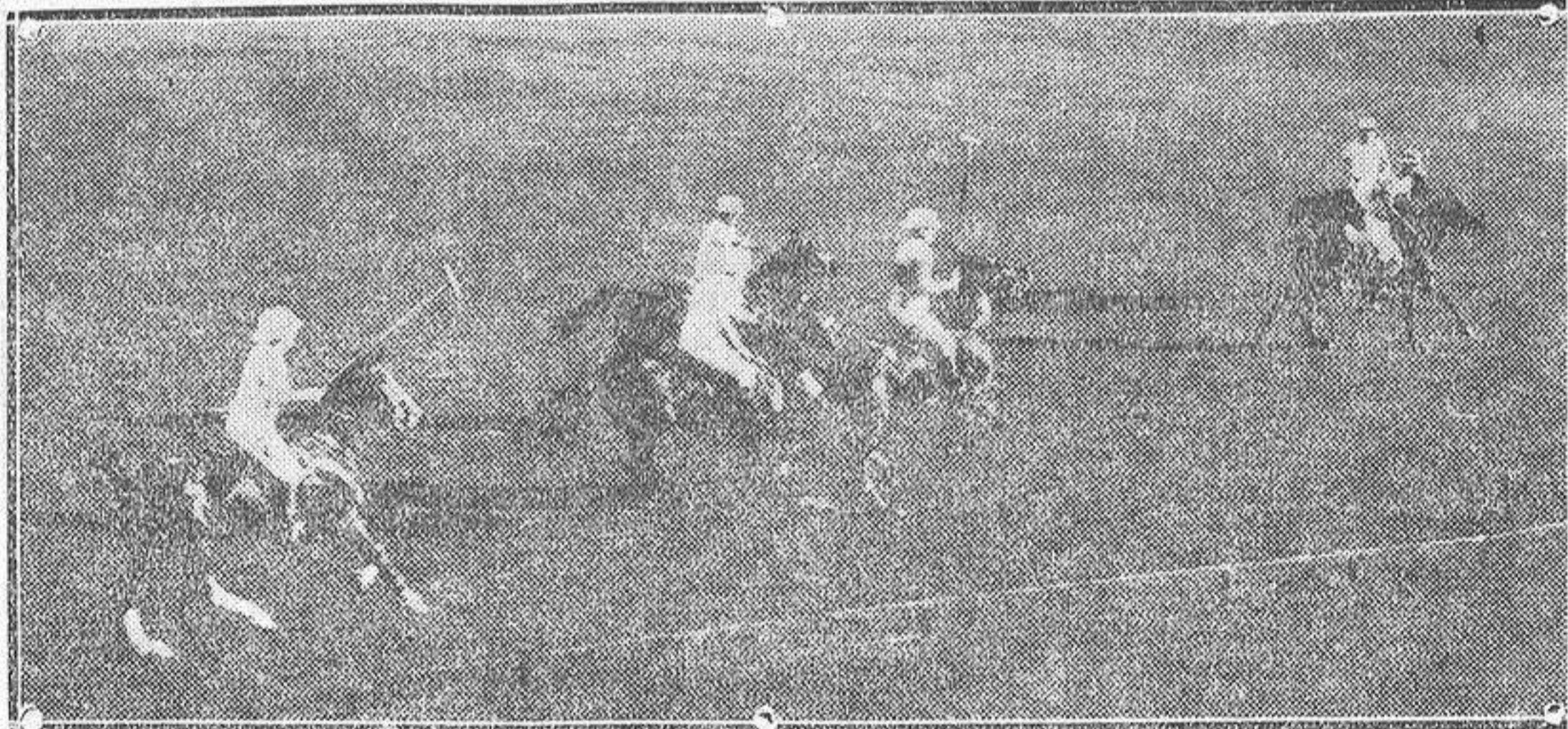
Uno de los más interesantes momentos del concurso hipico del sábado en Madrid.

Al iniciarse la segunda parte vuelve a presionar el Barcelona, y cuando van diez minutos de juego, el dominio es tan intenso que las intervenciones de Zamora están a la orden del día. Desde los diez hasta los veinte minutos, la presión es intensísima, y cuando termina este período de tiempo logra el fruto el Barcelona por