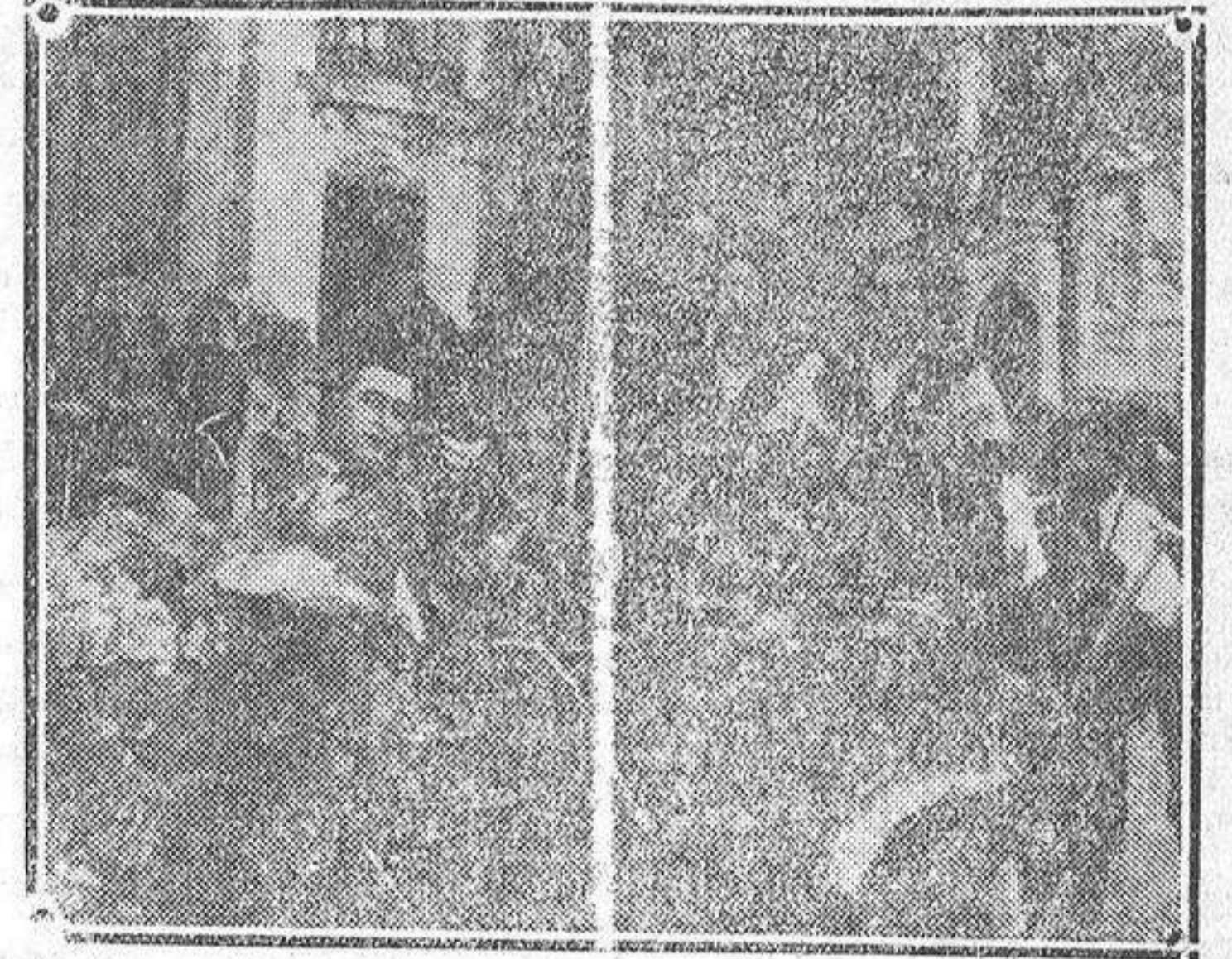
Coche que obtuvo el segundo premio del concurso celebrado estos días pasados.