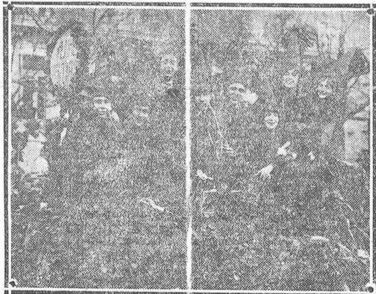
Coche engalanado que obtuvo el primer premio del concurso.