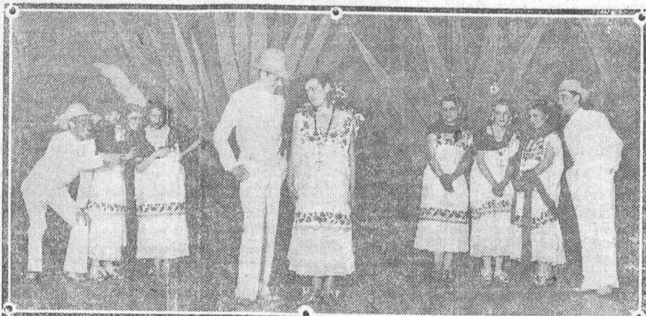
Uno de los cuadros de América fragante , espectáculo estrenado en Eslava con gran éxito