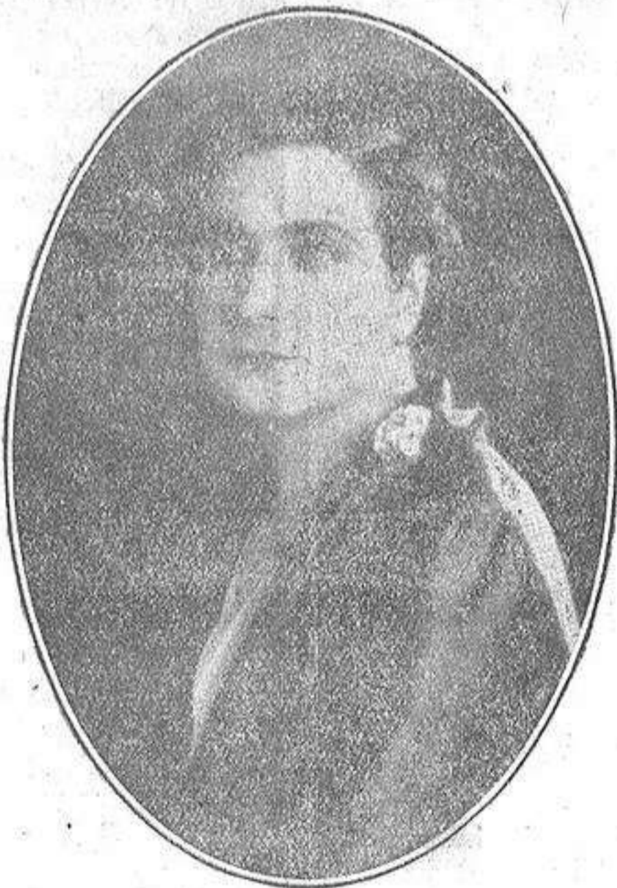
La genial Margarita Xirgu, que en breve va a reaparecer en Alicante.