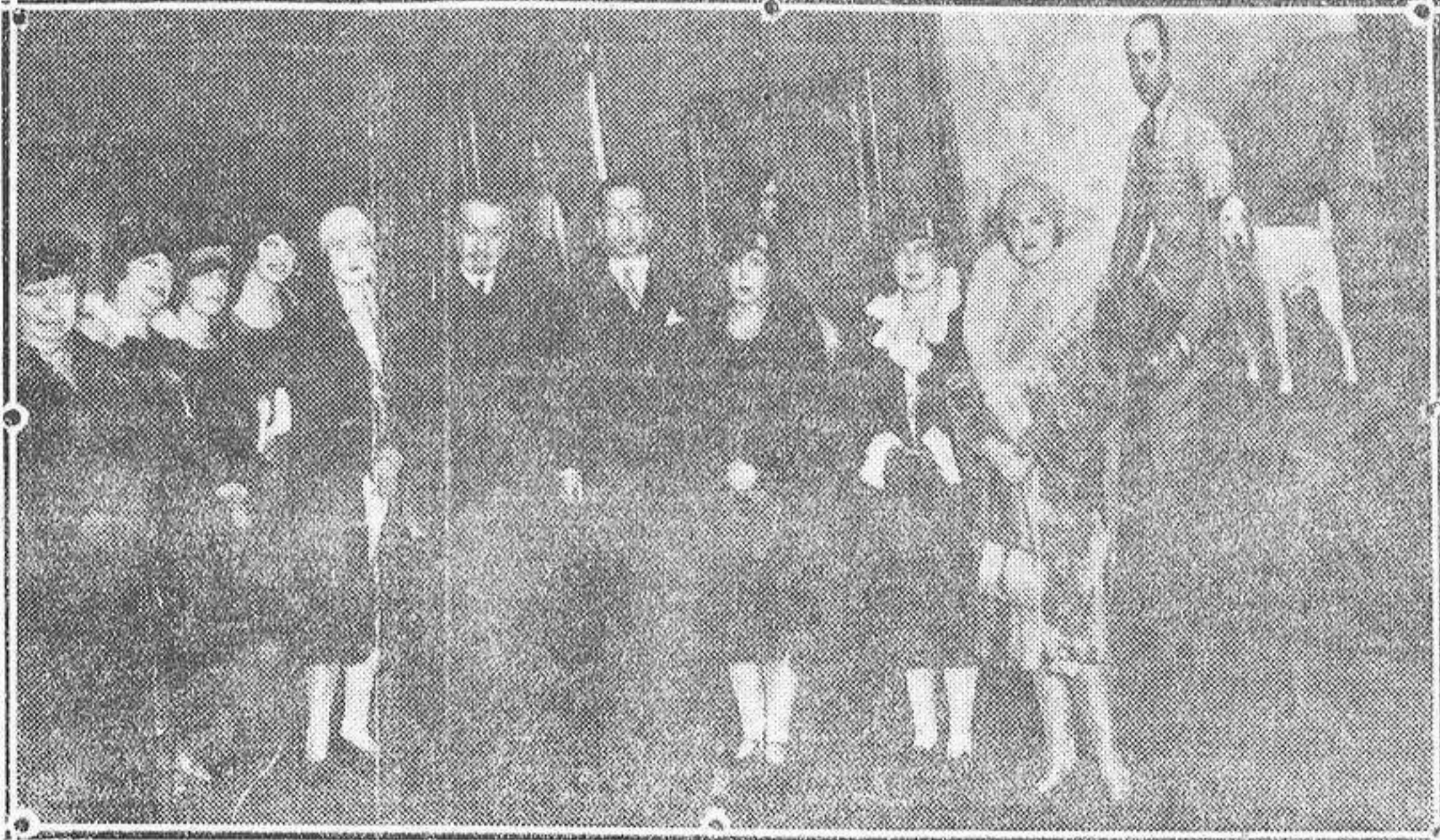
Acto inaugural de la Exposición de retratos del pintor Alberto de Sangróniz