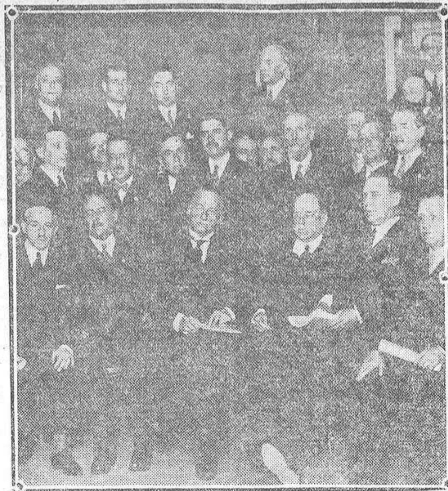
El jefe del Gobierno con los jefes provinciales de las Uniones Patrióticas, después del banquete celebrado en el domicilio social de estas agrupaciones.