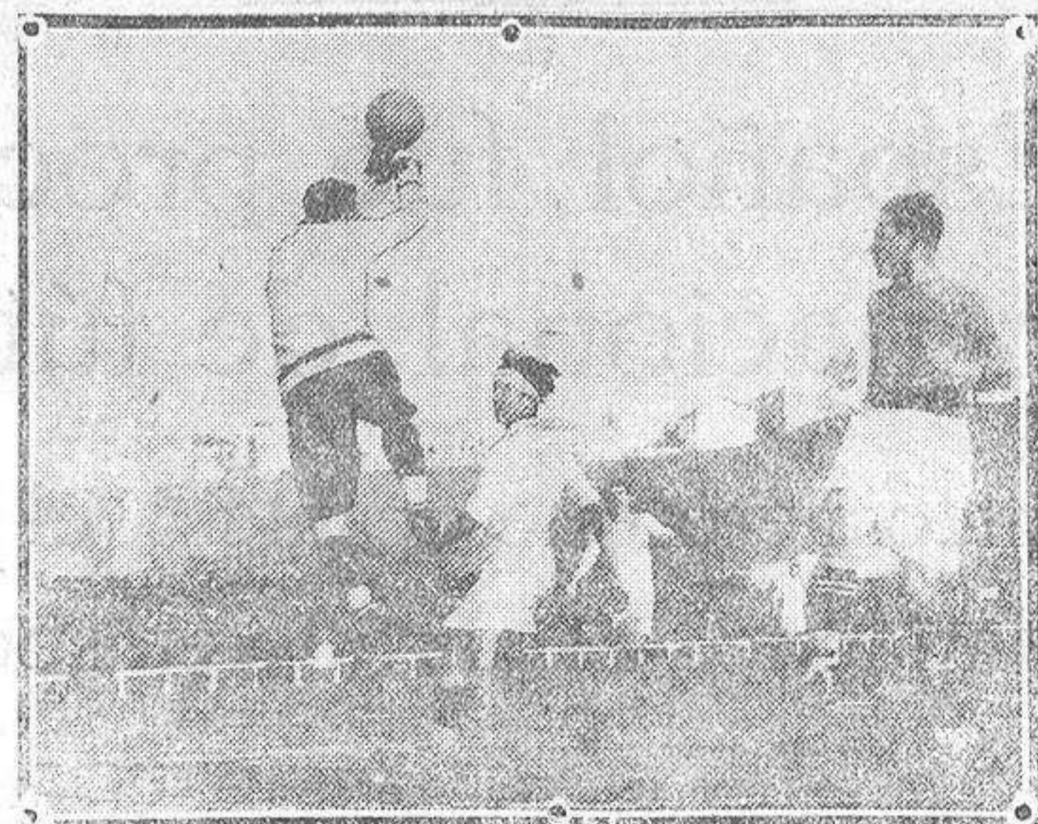
Una parada del guardameta g del Real Madrid durante el partido semifinal del torneo de clasificación que jugaron el domingo pasado en Madrid los equipos Ceita y Sevilla.

siempre han llevado la peor parte los del Deportivo que han obtenido el título contando solamente con ocho jugadores al final del partido.