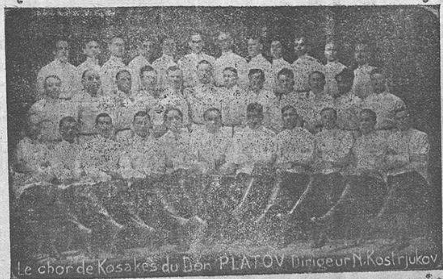
El coro de Cosacos del «Don Platoff» que se presentará el miércoles en el Teatro Principal