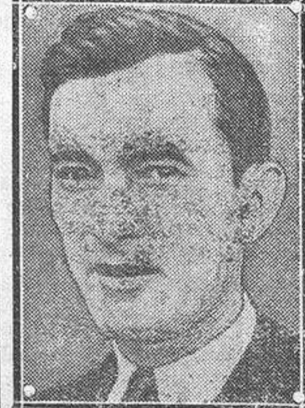
M. James Walker, que ha sido reelegido alcalde de Nueva York.