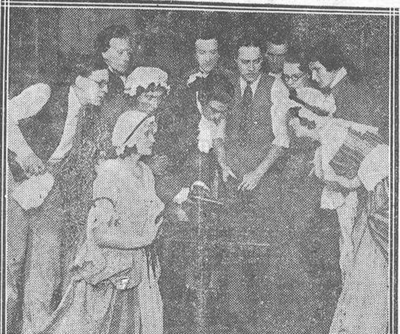
Un momento de la interesante obra de Elmer Rice, titulada «Cock Robin», fino drama policíaco, representado con gran éxito en el Little Theatre, de Londres.

El señor Ossorio no le perdonará al periodista, la preguntita en cuestión. Para el señor Ossorio es mucho más inofensivo soltar el grifo de sus ojos o proporcionar un succulento enchufito al nene. A ese nene que da ciento y raya a su señor padre.