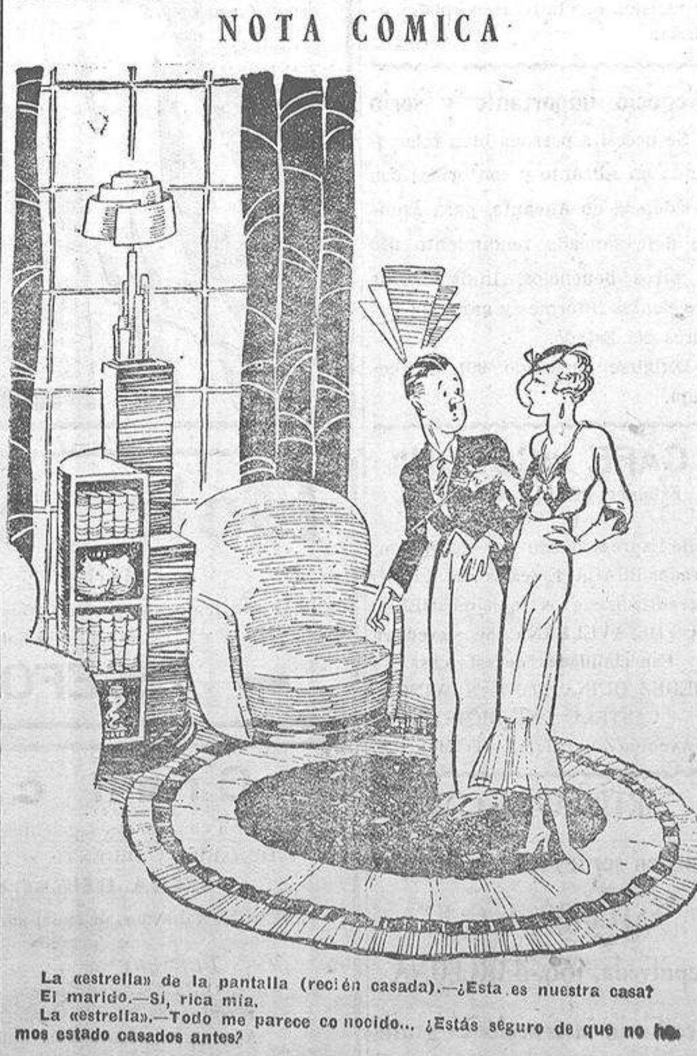
La estrella de la pantalla (recién casada).—¿Esta es nuestra casa? El marido.—Sí, rica mía. La estrella.—¿Todo me parece conocido... ¿Estás seguro de que no me he estado casados antes?

Se concede enorme trascendencia a la reunión.