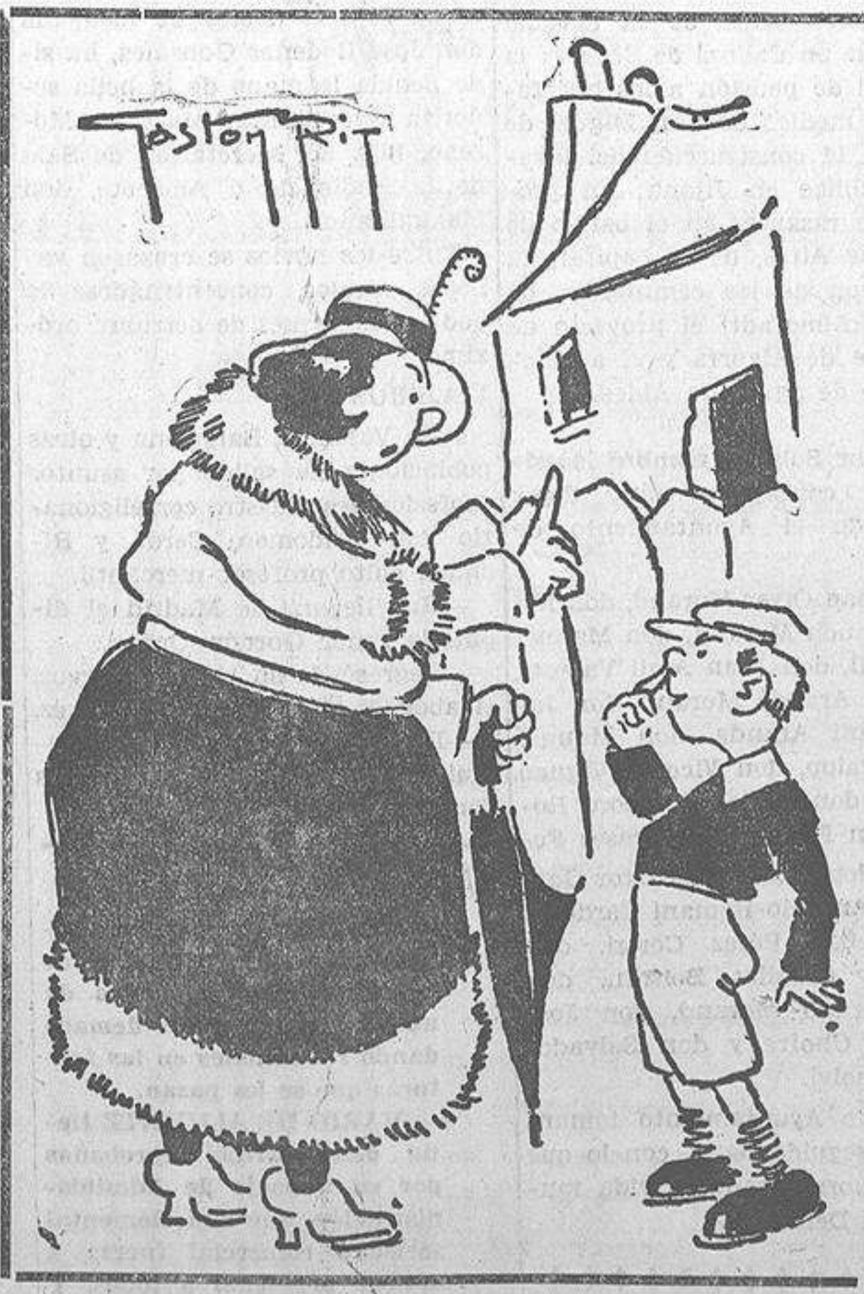
—En recuerdo de tu papá, a quien conocí, te voy a dar una peseta. —También conoció usted a mi abuelo, ¿verdad?