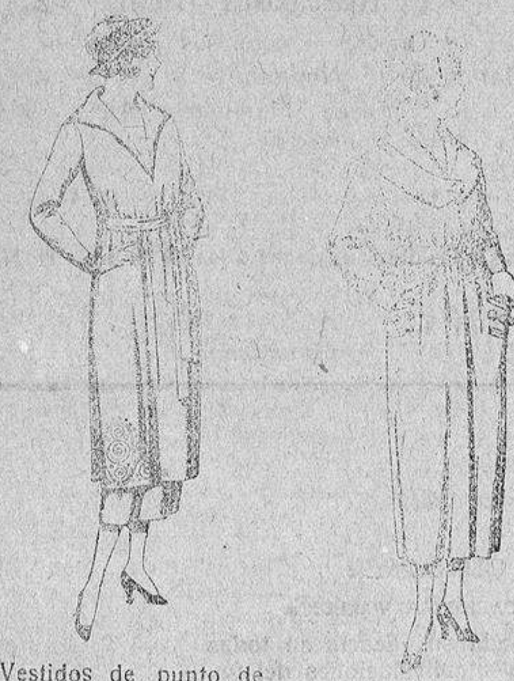
Vestidos de punto de lana azul y color, adornos bordados, de pesetas 145 a 250.