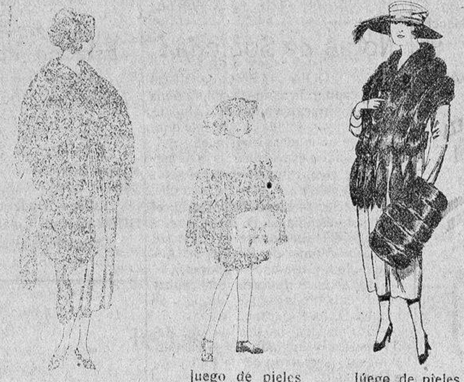
Juego pieles, imitación Renard negro, de pesetas 100 a 150.