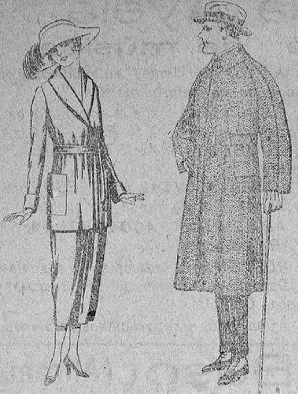
Trajes de punto de lana negro, azul y colores, e prás. 150 a 250. Gabanes de patén, chaviot o cover, de pesetas 85 a 136.

SUCURSALES: Madrid, Barcelona, Almería, Bilbao, Cádiz, Cartagena, Gijón, Granada, Málaga, Palma de Mallorca, Santander, Sevilla, Valencia, Valladolid y Zaragoza.