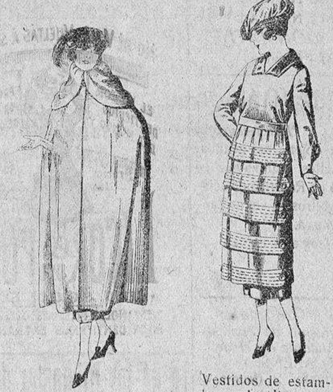
Capas de gabardina inglesa, diferentes colores, de ptas. 110 a 130.