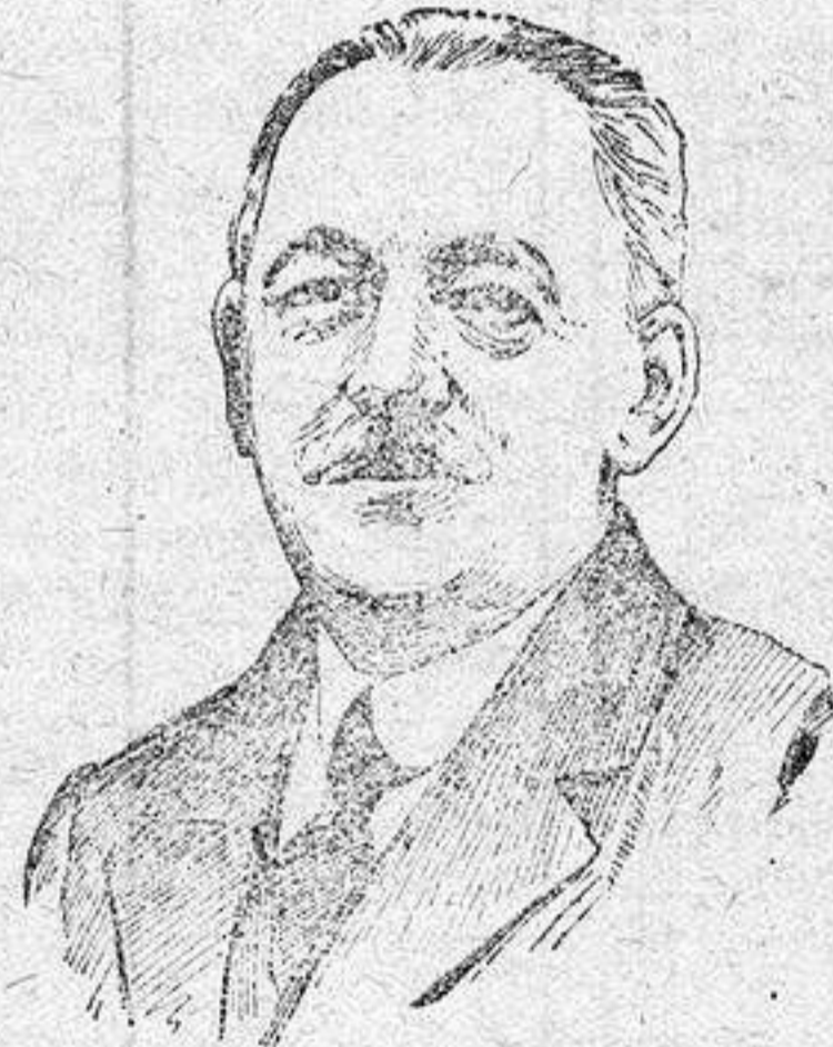
DON ANTONIO GAMONEDA - mayor del Congreso, condecorado con la Cruz de Isabel la Católica