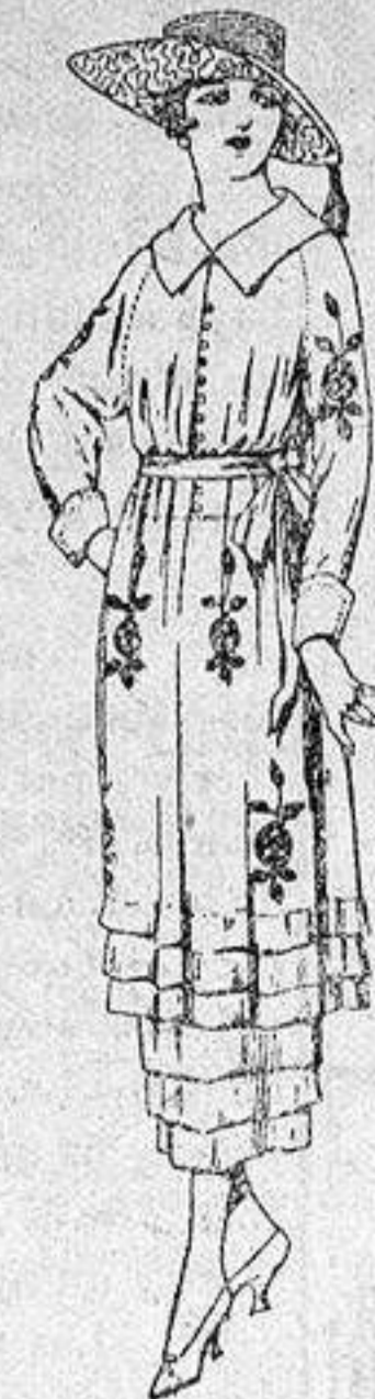
Vestidos de etamín blanco, azul y color, adornos bordados, de ptas 50 a 68.