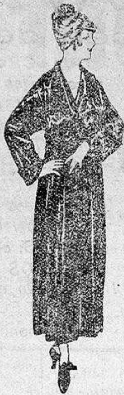
Batas de crepón, esterilla, etc., de ptas 32 a 46