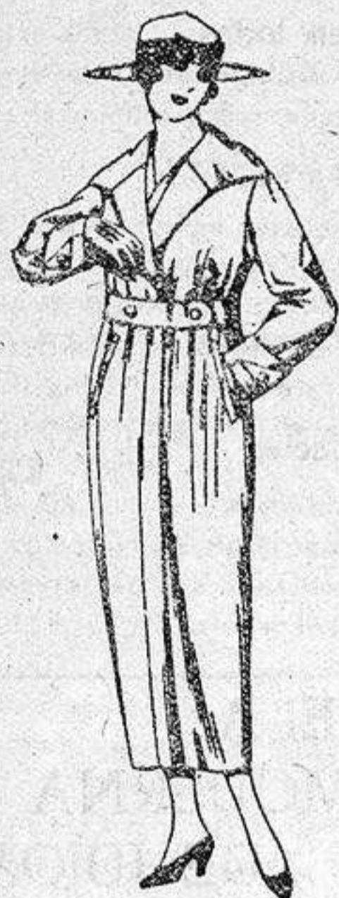
Guardapolvos de gabardilla, drill y alpaca, colores beige, kaki, gris, etc., de ptas 22 a 55.