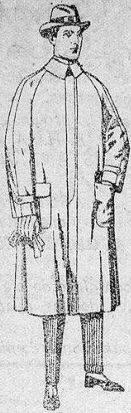
Impermeables, forma gabán, «R-gán», de pesetas 40 a 150.

SUCURSALES: Madrid, Barcelona, Almería, Bilbao, Cádiz, Cartagena, Gijón, Granada, Málaga, Palma de Mallorca, Santander, Sevilla, Valencia, Valladolid y Zaragoza.