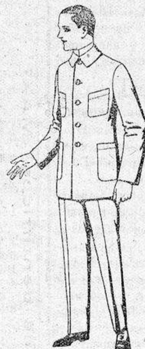
Trajes de drill azul, para mecánicos, de ptas. 17 a 25.

Gamisería, Géneros de punto, Gorbatería, Guantería, Sombrería, Zapatería, Paraguas, Bastones y artículos de viaje