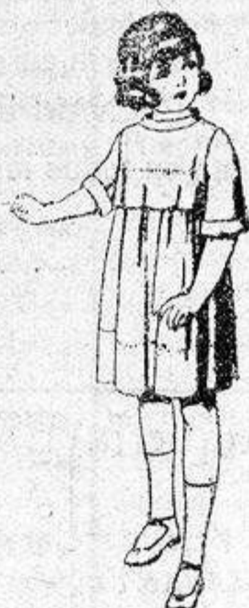
Vestidos de seda liberty, pongée, etc., para niñas de 7 a 12 años, de pesetas 30 a 38.