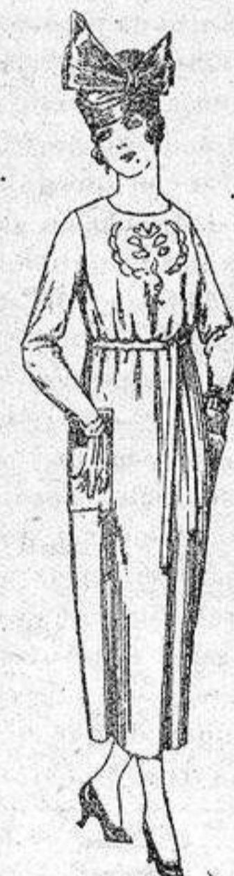
Vestidos de tricot de lana, en azul y colores, bordados a mano, a pesetas 112.

PRECIO FIJO - Pídase el catálogo general