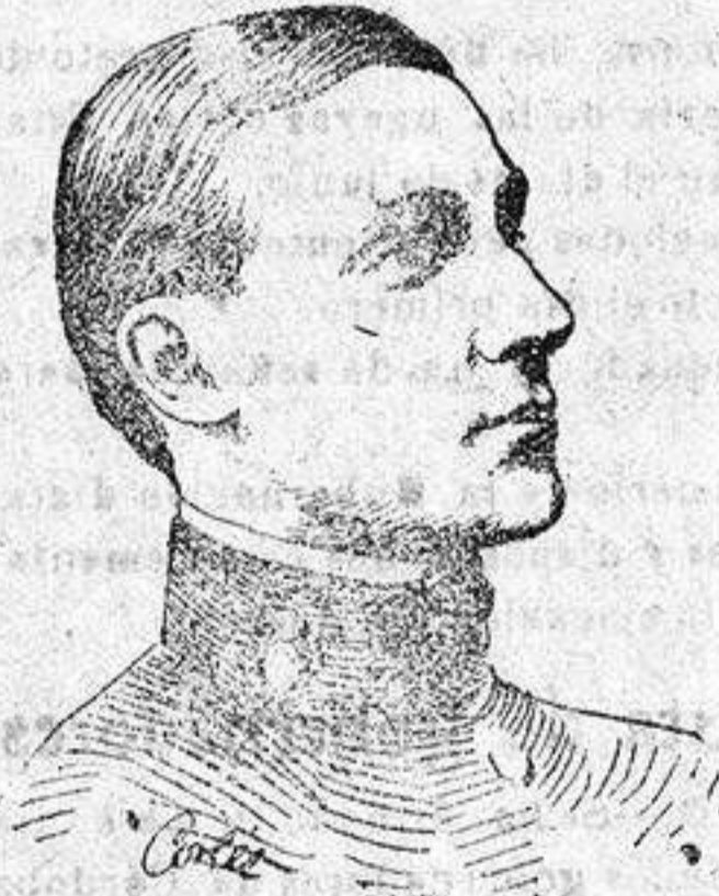
El infante D. Alfonso de Orleans que ha sufrido un grave accidente de "skis" en Brunen (Suiza)