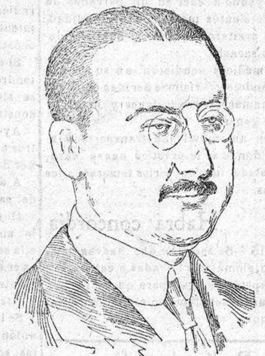
SEÑOR GONZALEZ HONTORIA distinguido diputado por Alcoy nombrado ministro de Estado