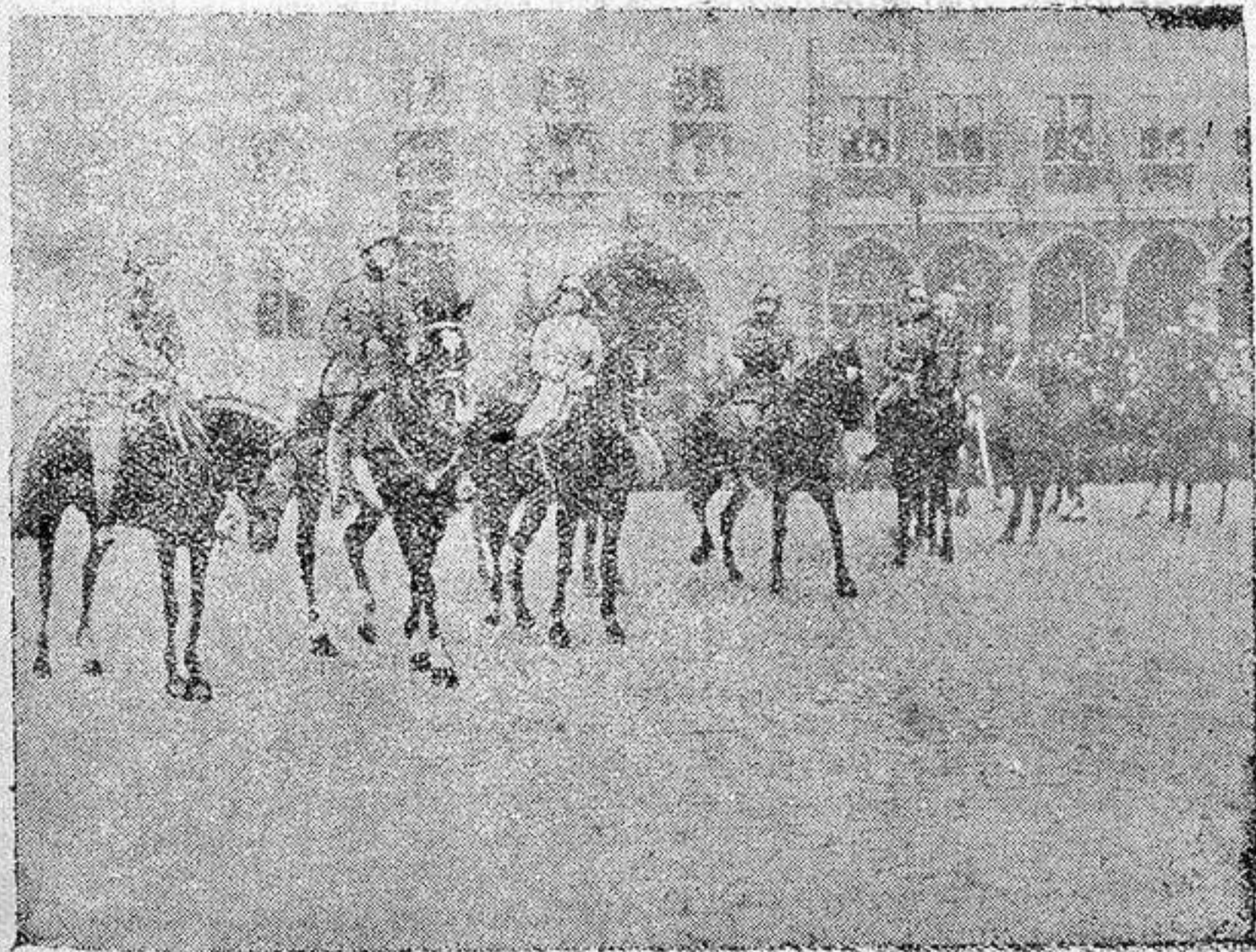
El rey, la reina y el príncipe heredero de Bélgica, ovacionados en la Plaza Mayor de Brujas

Hay existencias de: bucalos, café mocha, cacahillito, Puerto Rico, Puerto Caballo y Santos; crudos y tostados; gallos, pastas para sopa, bugías, pimientas clavillo, canelas, jabones, y otros.