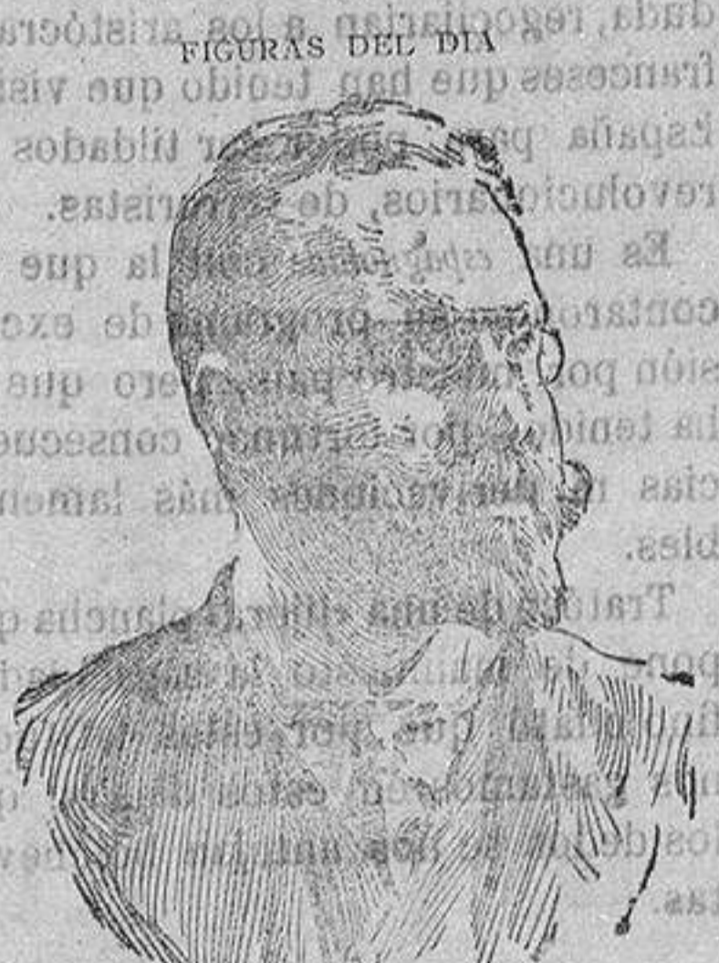
DON EMILIO ORTUÑO , ex director general de Correos, nombrado ministro de Fomento últimamente.