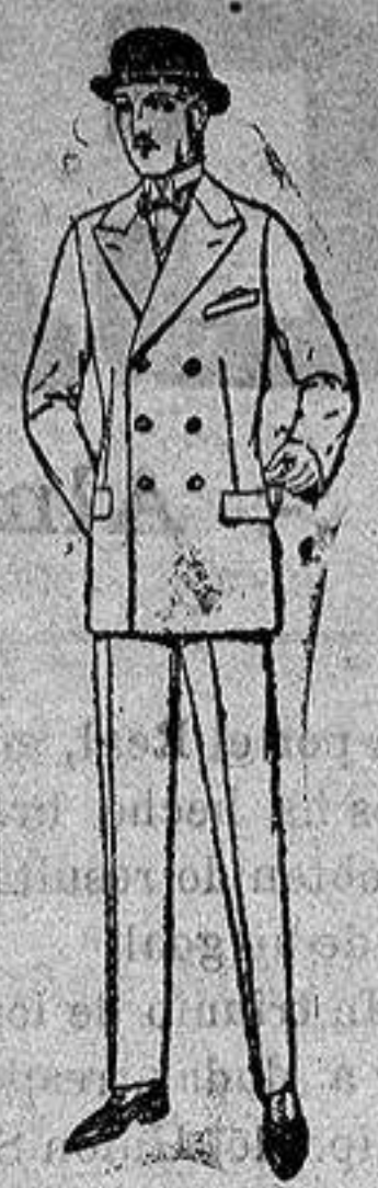
Gabanes de cheviot, gamuza patén etc. De ptas. 45 a 140.