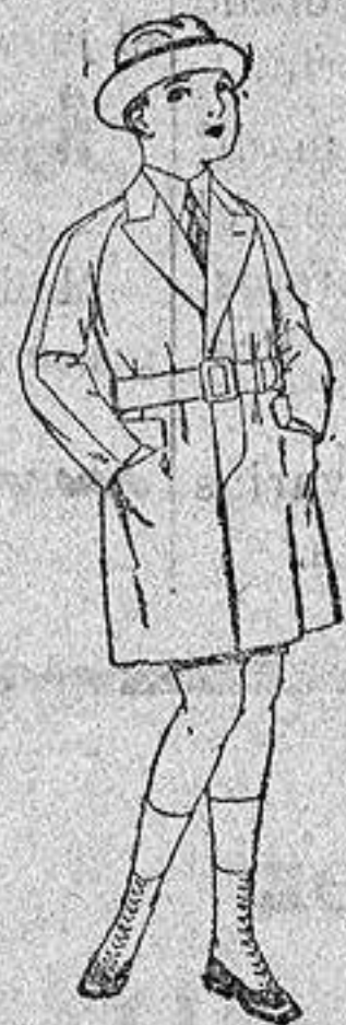
Gabanes de patén gamuza etc. para niños de 4 a 12 años. De ptas. 30 a 65.