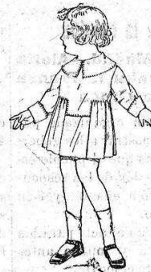
Vestidos batista blanca respuntes no para niñas de 3 años. de 5-50 a 6-50. ptas.

Ropas confeccionadas para Caballero, Señora Niño y Niña