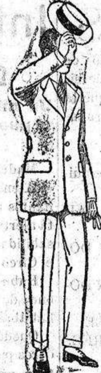
Trajos modelo Spotr, de lanilla, melton etc. de ptas. 75 a 10