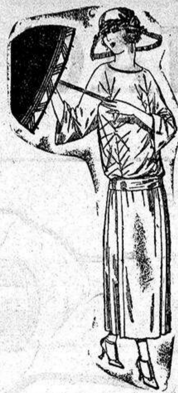
Vestidos de tricot de seda, en negro, azul y colores moda adornos bordados. a ptas. 115