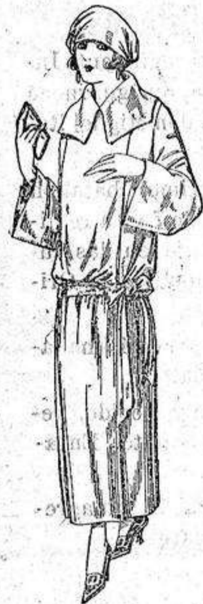
Guardapolvos de dril crudo, gris, beig, etc. de ptas. 18 a 25.