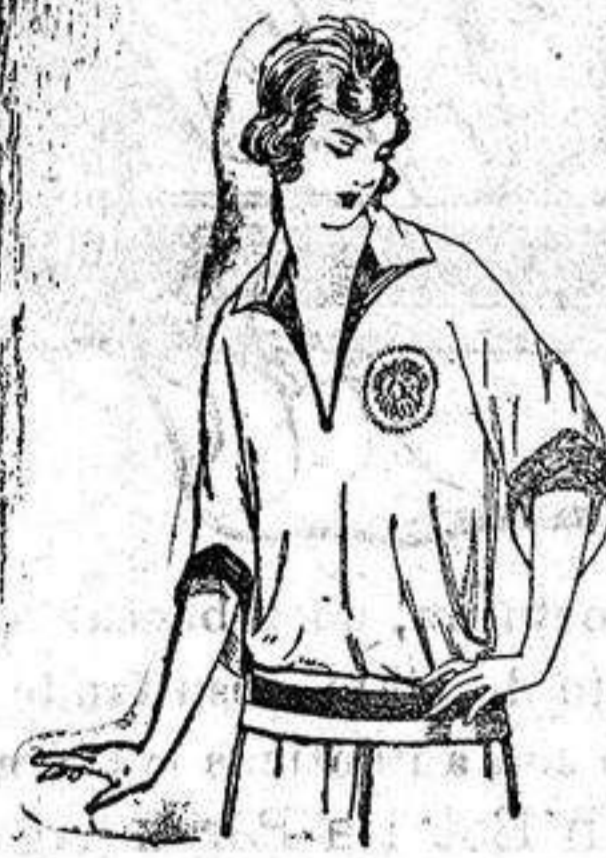
Blusas tricot de seda en negro y colores moda. a ptas. 39