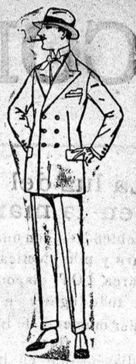
Trajos de lanilla, melton, estambre vicuña o jerga. de ptas. 40 a 140.