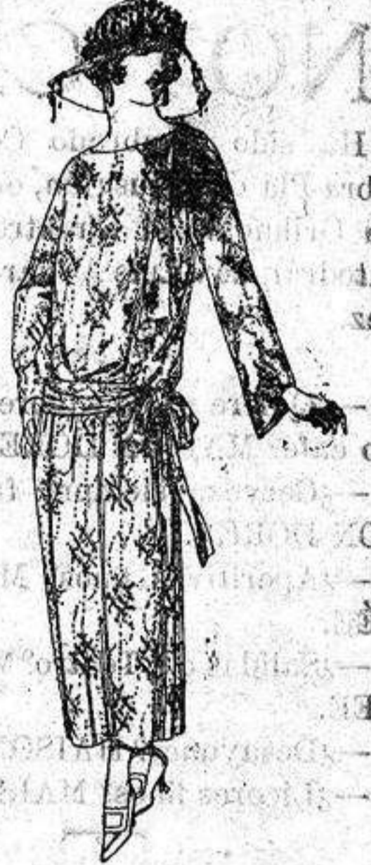
Vestidos de velo de algodón, dibujos novedad. a ptas. 50,

Boas, Camisería, Géneros de punto Corbatería Guantería, Sombrería Zapatería, Paraguas, Bastones Sombrillas y Artículos de viaje