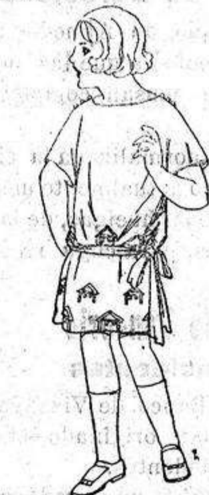
Vestidos popelina sarga inglesa etc. adornos bordados para niños de 4 a 9 años. de ptas 30 a 35.

Ropas confeccionadas para Caballero, Señora Niño y Niña