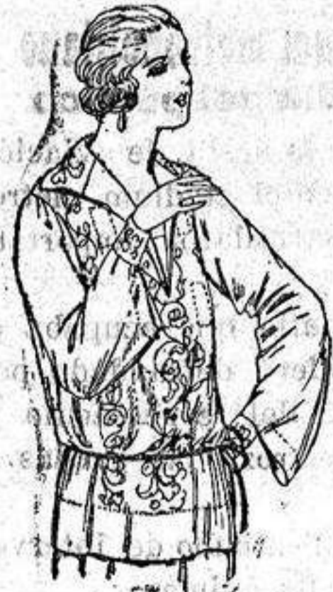
Brusas de voile de seda en negro y blanco adornos bordados. a ptas. 22.