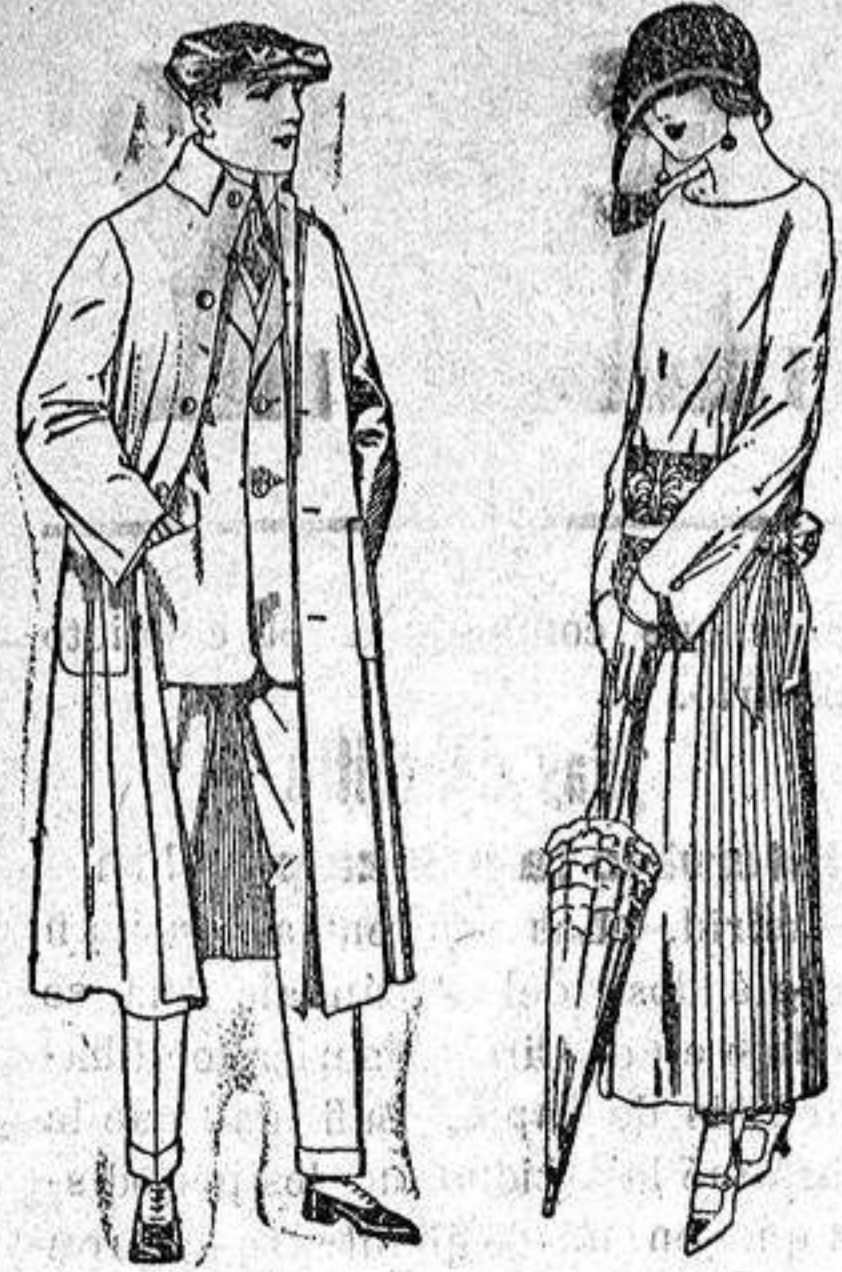
Guardapolvos de dril, igual al modelo. de ptas. 12 a 20.

Sucursales: Madrid, Barcelona, Almeria, Bilbao, Cadiz, Cartagena, Gijón, Granada, Málaga, Palma de Mallorca, Santander, Sevilla, Valencia, Valladolid, Zaragoza