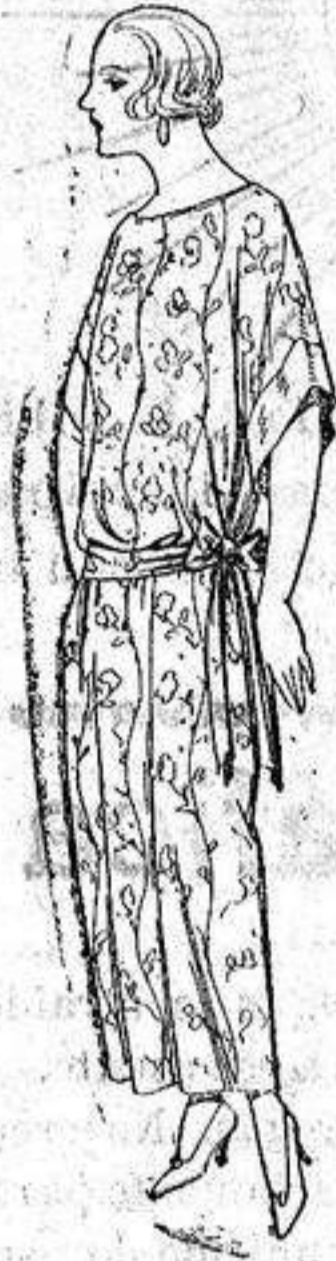
Batas de crespón, en negro y colores, adornos bordados. de ptas. 32 a 33