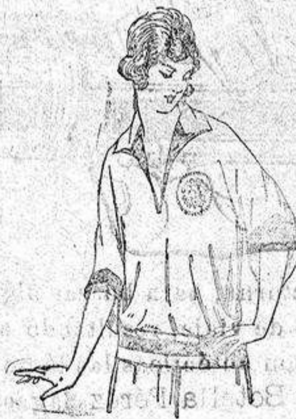
Blusas de seda en negro y colores moda, de 30 a 40 ptas.