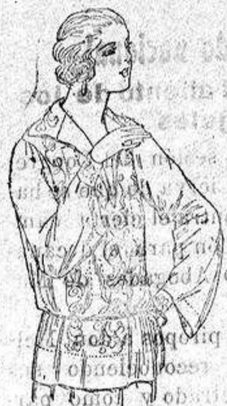
Frusas de seda en negro y blanco, adornadas con flores, de 22 a 30 ptas.