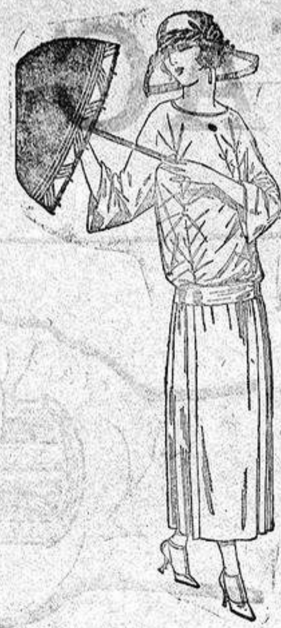
Vestidos de terciopelo de seda, en negro y colores moda, adornados con flores, de 115 a 140 ptas.