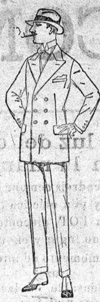
Trajes de lanilla, molton, estambre, vicuña, etc., de 40 a 140 ptas.