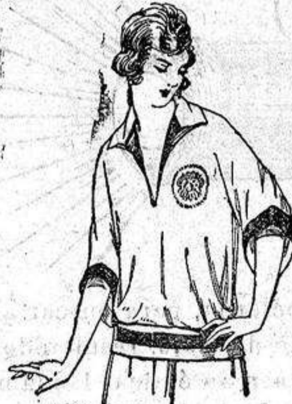
Blusas tricot de seda en negro y colores moda. a ptas. 39