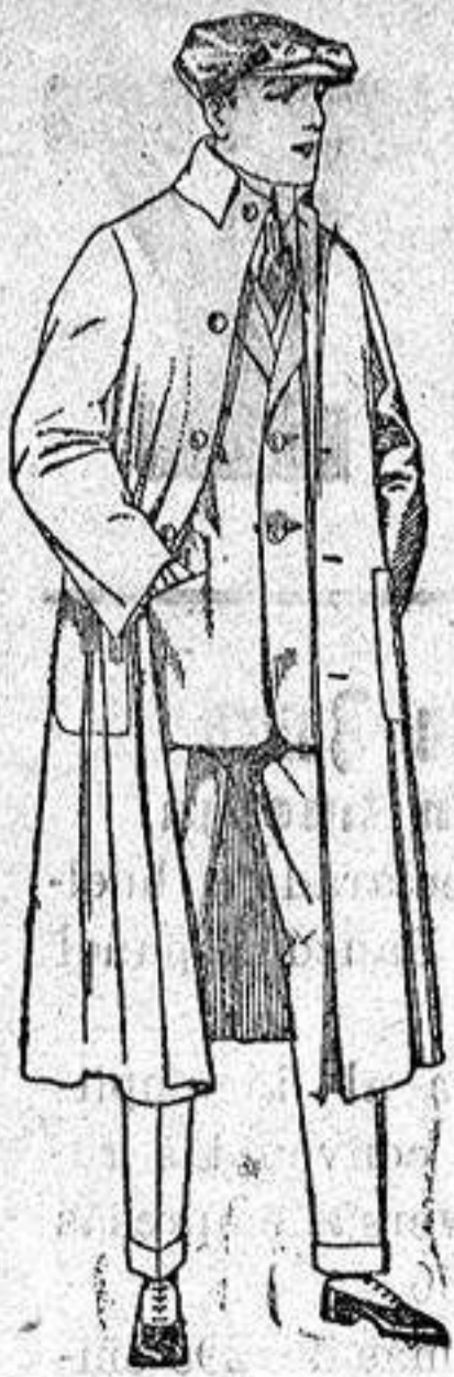
Guardapolvos de drill, igual al modelo. de ptas. 12 a 20.

Altamira, 2 :: Alicante :: Victoria, 1 Sucursales: Madrid, Barcelona, Almeria, Bilbao, Cadiz, Cartagena, Gijón, Granada, Málaga, Palma de Mallorca, Santander, Sevilla, Valencia, Valladolid, Zaragoza