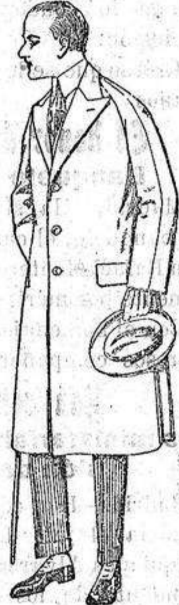
Gabanes de meltón, gabardina, etc. de ptas. 75 a 180.