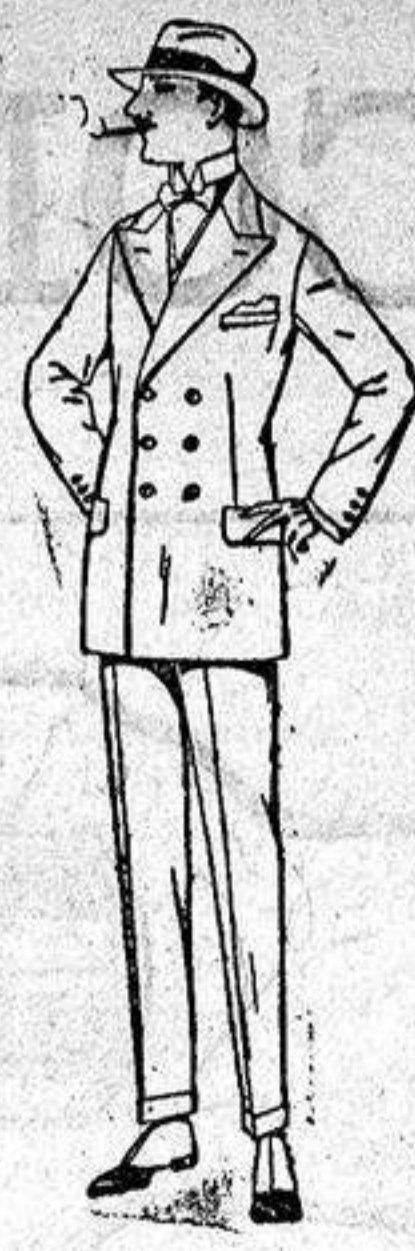
Trajes de lanilla, meltón estambre vicuña o jerga. de ptas. 40 a 140.