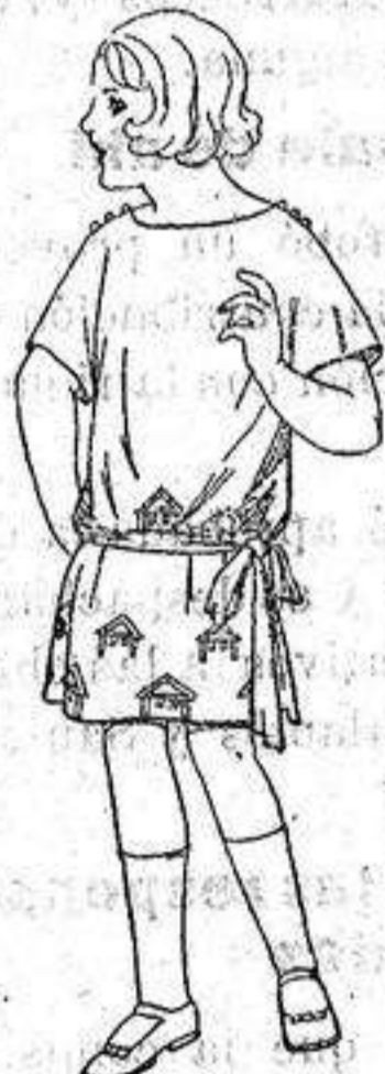
Vestidos popelina sarga inglesa, etc. adornos bordados para niños de 4 a 9 años. de ptas 30 a 35.

Ropas confeccionadas para Caballero, Señora Niño Niña