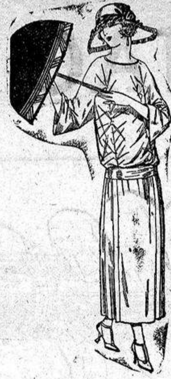
Vestidos de tricot de seda, en negro, azul y colores moda adornos bordados. a ptas. 115