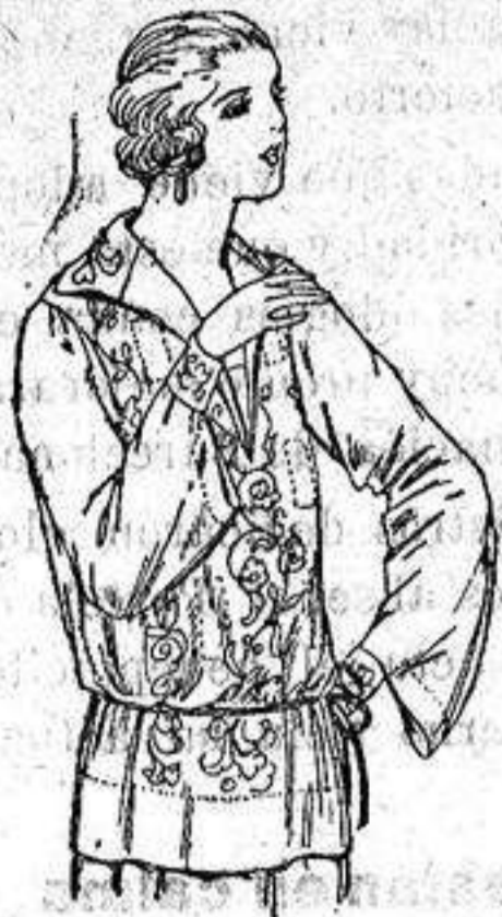
Brusas de voile de seda en negro y blanco adornos bordados. a ptas. 22.