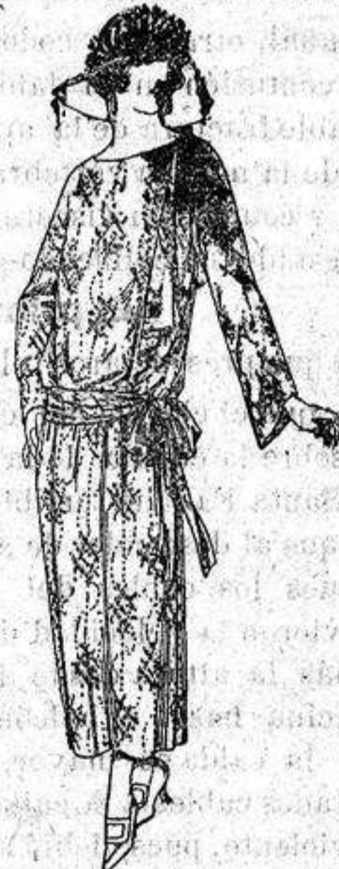
Vestidos de velo, de algodón, dibujos novedad. a ptas. 50

Ropas, Camisería, Géneros de punto Corbatería, Sombrería Zapatería, Paraguas, Bastones Sombrillas y Artículos de viaje