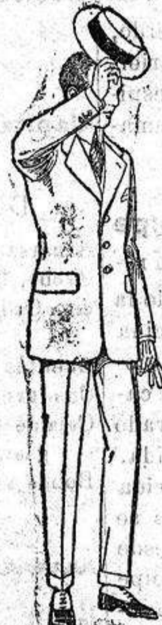
Trajes modelo Spotri, de lanilla; meltón etc. de ptas. 75 a 100