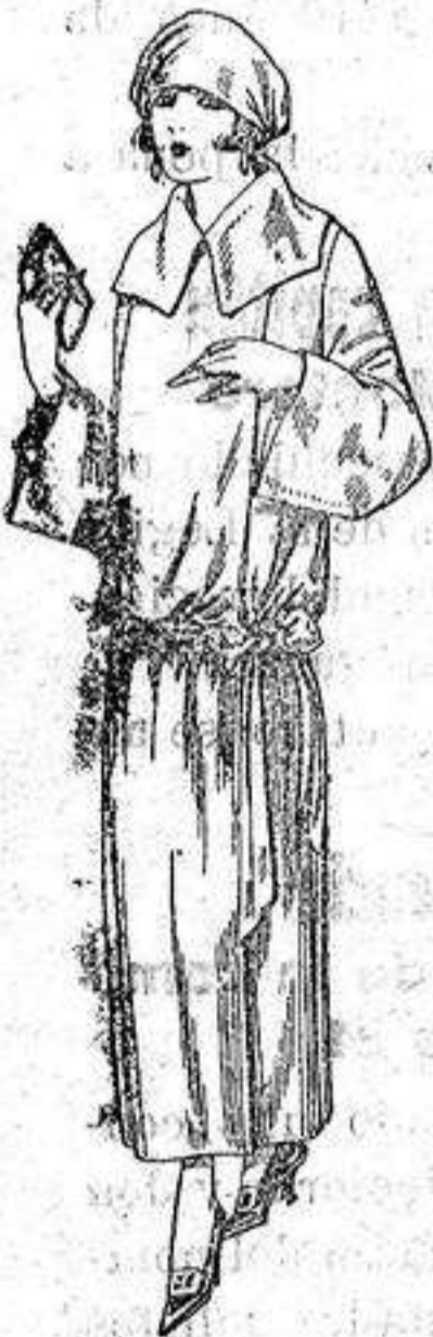
Guardapolvos de drill crudo, gris, beige, etc. de ptas. 18 a 25.