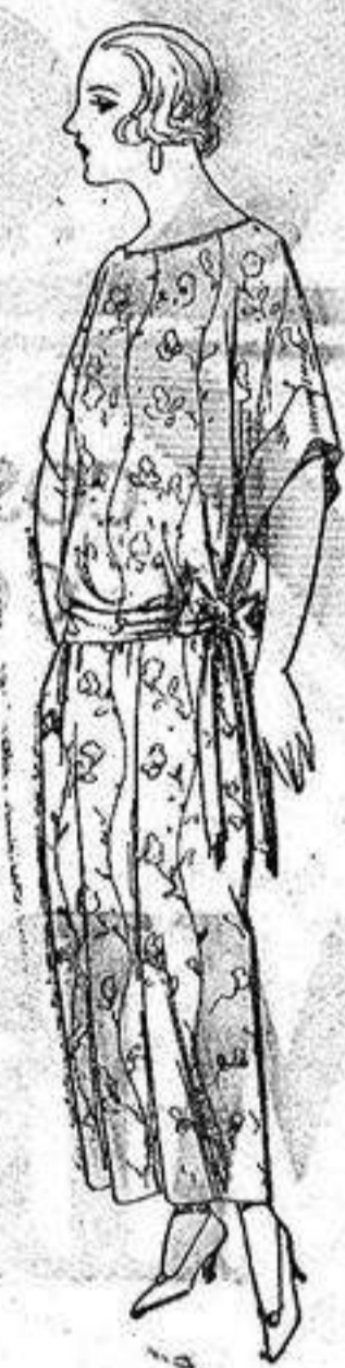
Batas de crespón, en negro y colores, adornos bordados. de ptas. 32 a 33