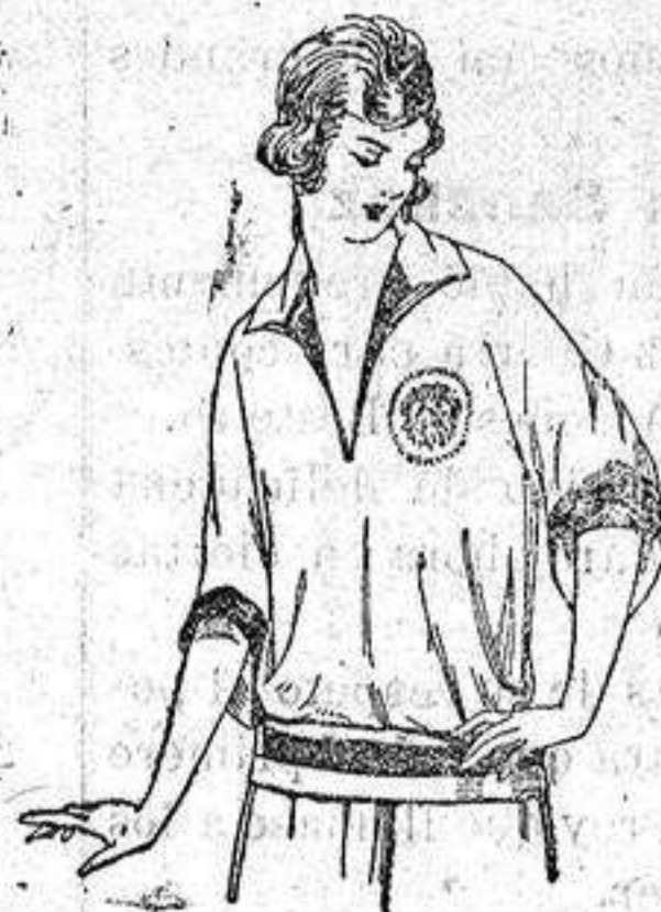
Blusas tricot de seda en negro y colores moda. a ptas. 39