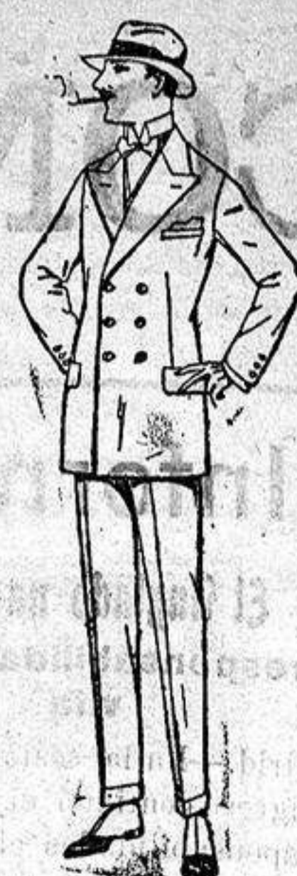
Trajes de lanilla, melton, estambre vicuña o jerga. de ptas. 40 a 140.