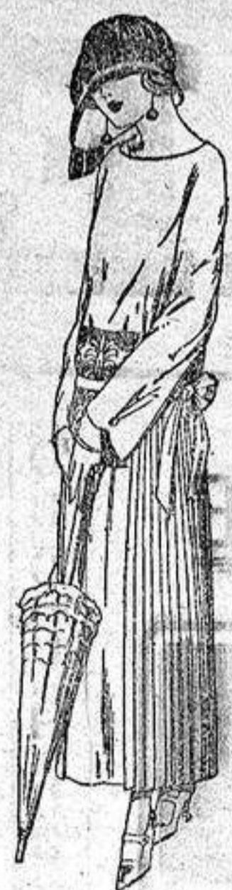
Vestidos de sarga inglesa, popelino, etc. en negro, azul y color, adornos bordados a ptas. 110