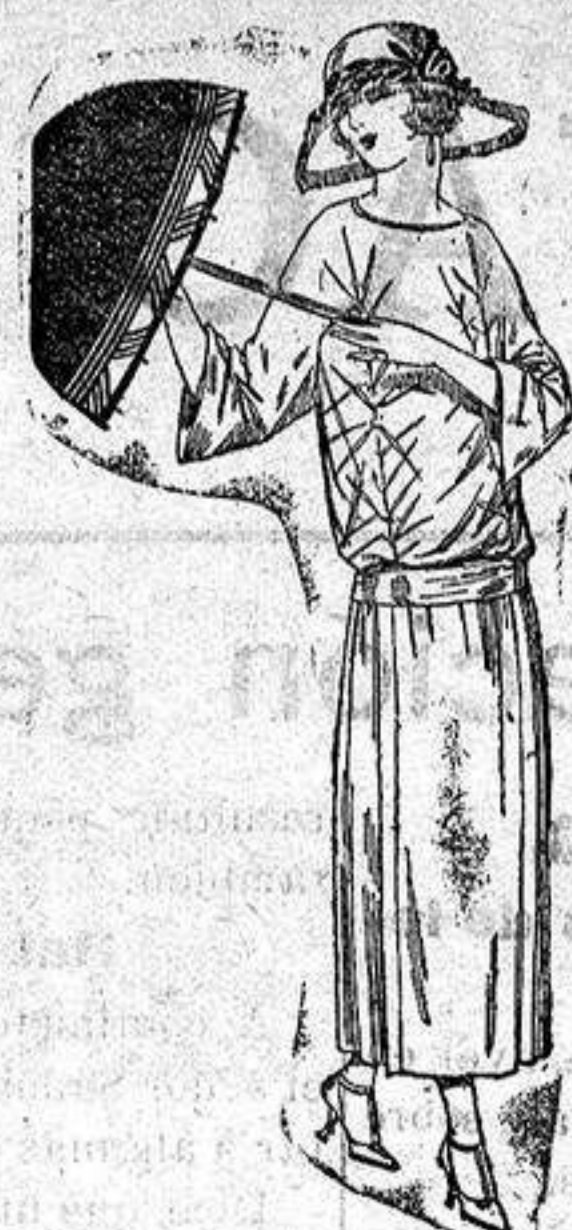
Vestidos de tricot de seda, en negro, azul y colores moda adornos bordados. a ptas. 115