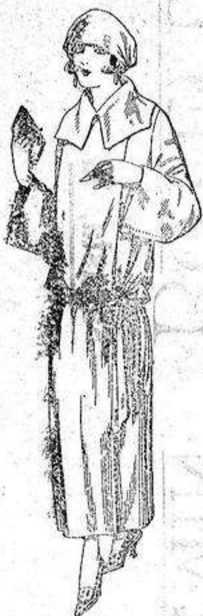
Guardapolvos de dril crudo, gris, boig, etc. de ptas. 18 a 25.