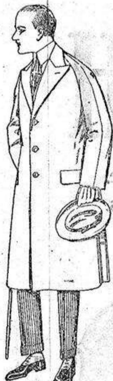
Gabanes de melton, gabardina, etc. de ptas. 75 a 180.