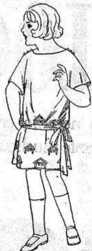
Vestidos popelina sarga inglesa etc. adornos bordados para niños de 4 a 9 años. de ptas 30 a 35.

Ropas confeccionadas para Caballero, Señora Niño y Niña