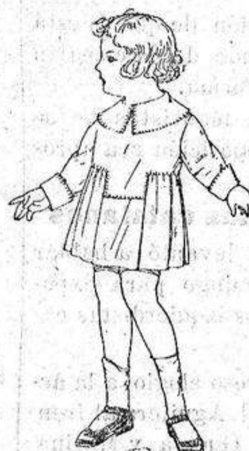
Vestidos batista blanca, pespuntes no para niñas de 6 años. de 5 50 a 6 50. ptas.

Ropas confeccionadas para Caballero, Señora Niño y Niña