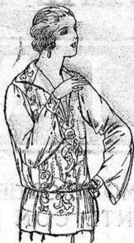
Brusas de voile de seda en negro y blanco adornos bordados. a ptas. 22.