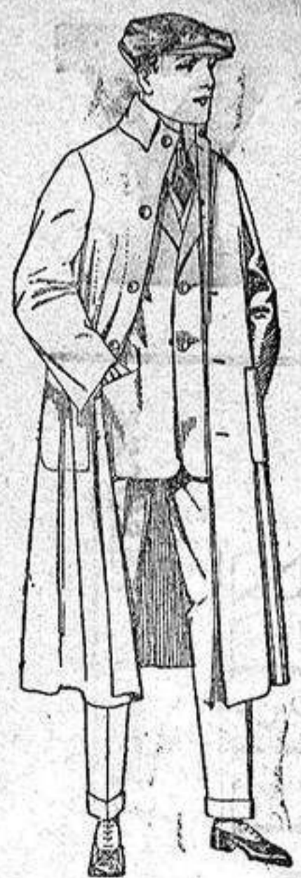
Guardapolvos de dril, igual al modelo, de ptas. 12 a 20.

Altamira, 2 :: Alicante :: Victoria, 1 Sucursales: Madrid, Barcelona, Almeria, Bilbao, Cadiz, Cartagena, Gijón, Granada, Málaga, Palma de Mallorca, Santander, Sevilla, Valencia, Valladolid, Zaragoza