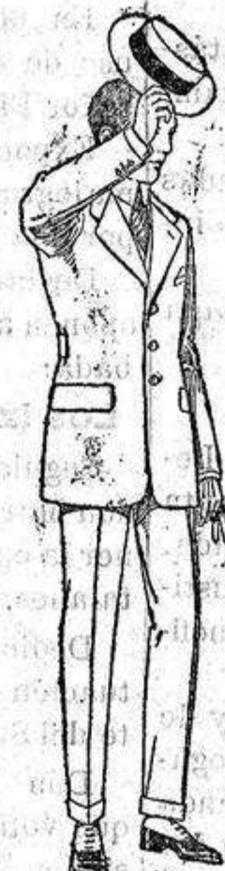
Trajes modelo Spotr, de lanilla; melton etc. de ptas 75 a 10