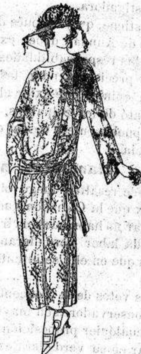
Vestidos de velo de algodón, dibujos novedad. a ptas. 50

Boas, Camisería, Géneros de punto Corbatería, Guantería, Sombrería Zapatería, Paraguas, Bastones Sombrillas y Artículos de viaje