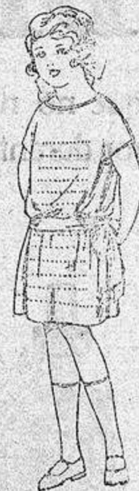
Vestidos voile, adornos calados para niñas de 4 a 6 años. de ptas. 15 a 18.

Boas, Camisería, Géneros de punto Corbatería, Guantería, Sombrerería Zapatería, Paraguas Bastones y Sombrillas