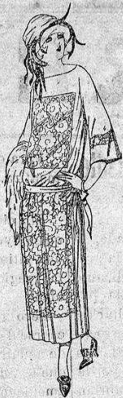
Vestidos de popeline, crepón etc., en negro azul y color, adornos bordados. a ptas. 130