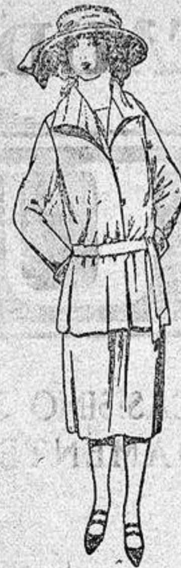
Trajes sastre de gabardina, sarga inglesa etc. en azul y color para jovencitas de 13 a 15 años.