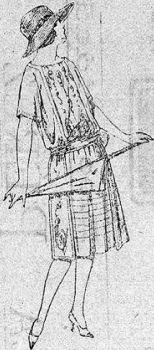
Vestidos de voile, adornos bordados para jovencitas de 13 a 15 años a ptas. 40