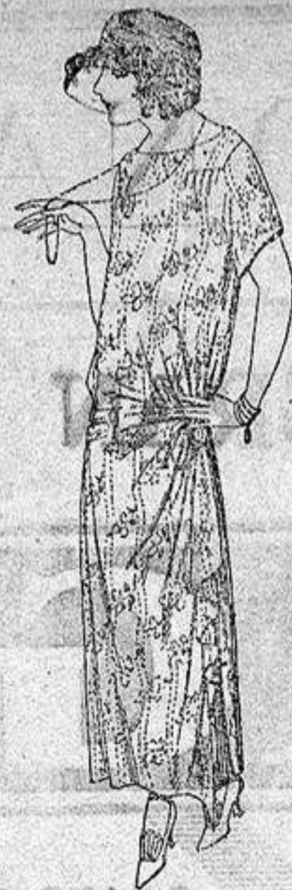
Vestidos de voile, dibujos moda, adornos plizados, broches fantasía. a ptas. 62.