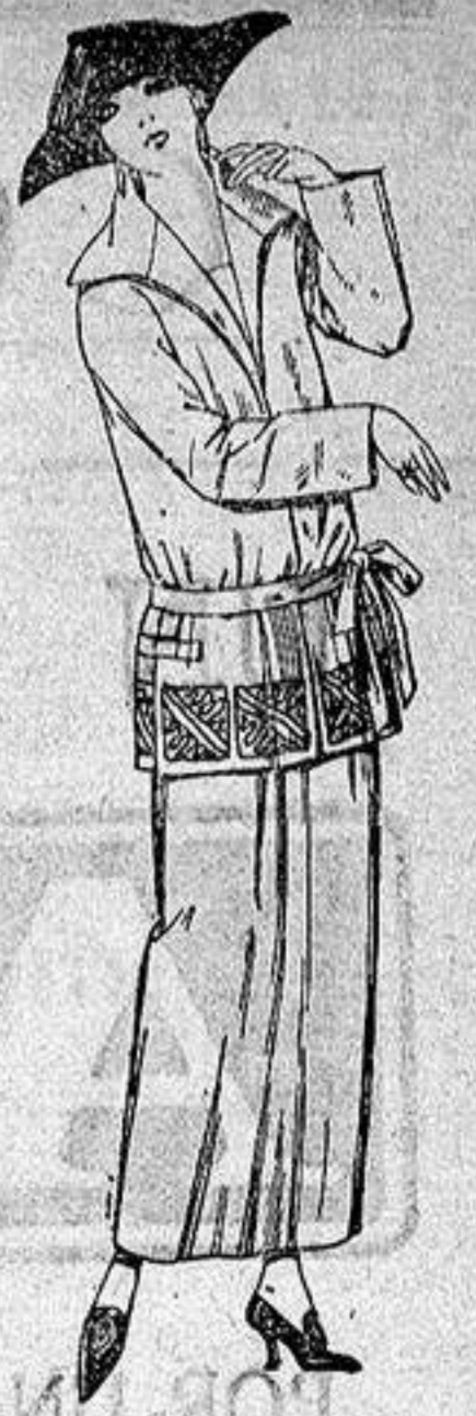
Trajes sastre, de gabardina, sarga inglesa etc., adornos bordados en negro azul y colores moda. a ptas. 115.