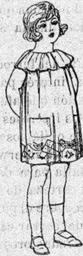
Delantales etc. en colores moda adornos bordados para niños de 5 a 6 años de ptas. 8'50 a 6'50

Ropas confeccionadas para Caballero, Señora, Niño y Niña