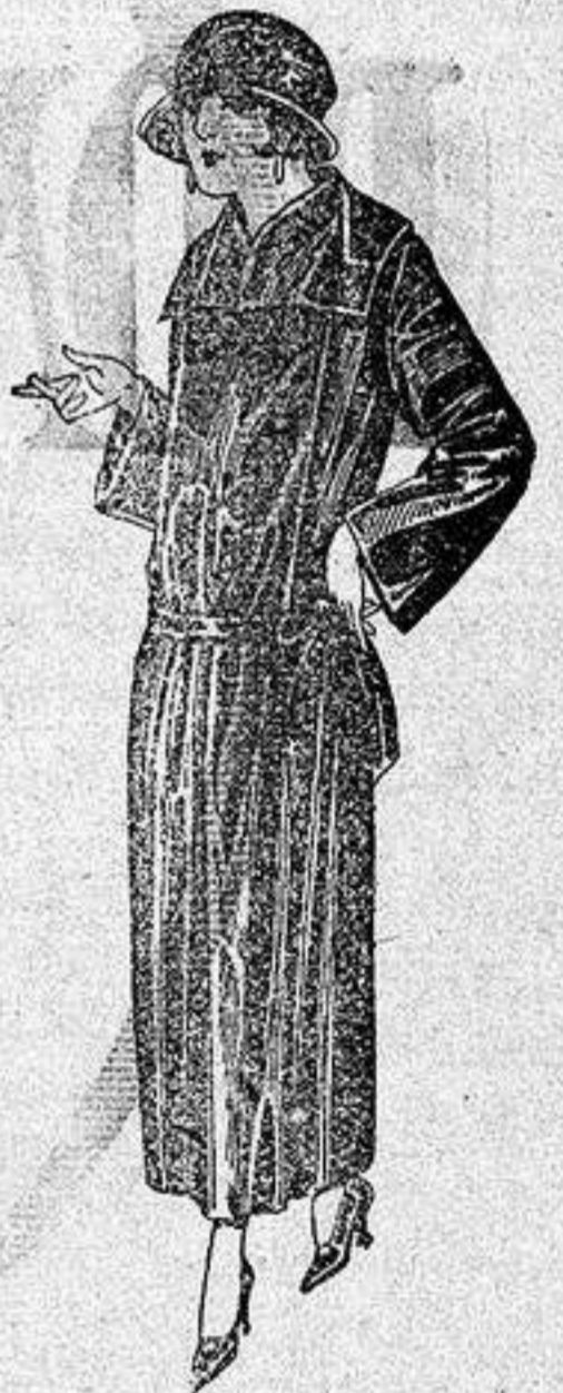
Abrigos de gabardina, inglesa impermeabilizada, en negro azul y color. a ptas. 130