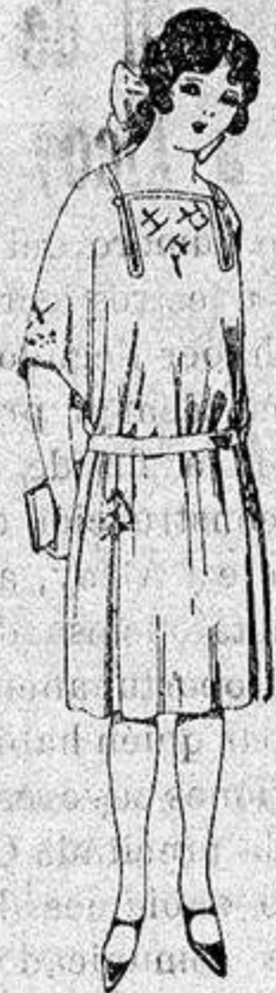
Vestidos de popeline, estambre, etc. en azul y colores moda adornos bordados para jovencitas de 13 a 15 años a ptas. 60