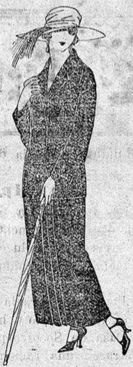
Trajes sastre, de sarga inglesa, popeline, etc., adornos bordados chaqueta forrada de seda, en negro, azul y colores moda de ptas. 120 a 135

Sucursales: Madrid, Barcelona, Almeria, Bilbao, Cadiz, Cartagena, Gijón, Granada, Málaga, Palma de Mallorca, Santander, Sevilla, Valencia, Valladolid, Zaragoza