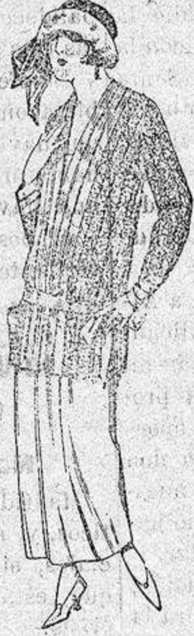
Paletots de punto de seda, dibujos novedad a ptas. 90.