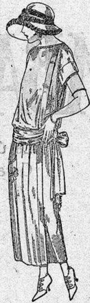
Vestidos de tricot de seda, en negro, azul y colores moda, adornos bordados a mano. a ptas. 125.