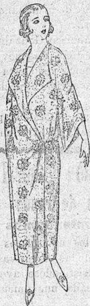
Batas de crepón estampado, broche de adorno. a pesetas 25