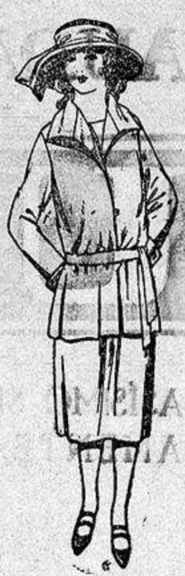
Trajes sastro de gabardina, sarga inglesa ect en azul y color para jovencitas de 13 a 15 años.