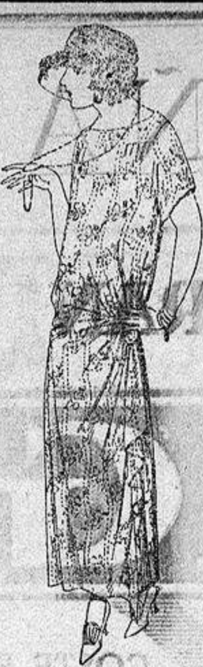
Vestidos de voile, dibujos moda, adornos plizados, broches fantasía. a ptas. 62