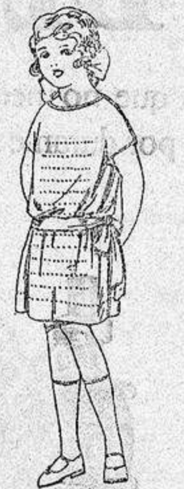
Vestidos voile, adornos calados para niñas de 4 a 6 años. de ptas. 15 a 18.

Boas, Camisetas, Géneros de punto Corbatería, Guantería, Sombrerería, Zapatería, Paraguas Bastones y Sombrillas