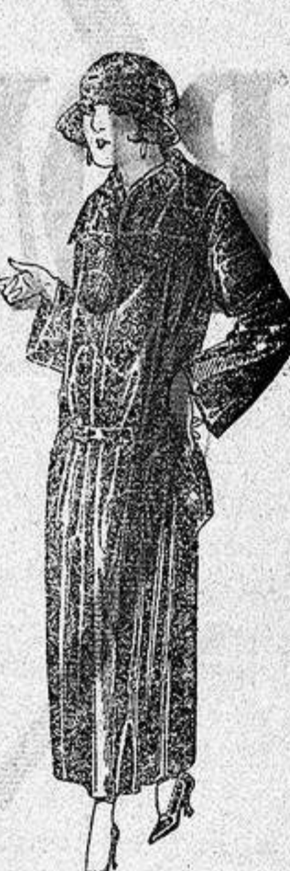
Abrigos de gabardina, impermeabilizada, en negro azul y color. a ptas. 130