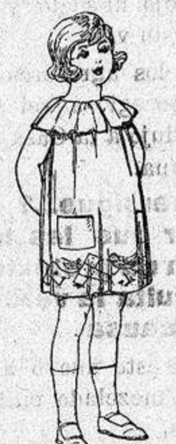
Delantales etamin colores moda adornos bordados para niños de 5 a 6 años. de ptas. 8.50 a 6.50

Repas confeccionadas para Caballero, Señora, Niño y Niña