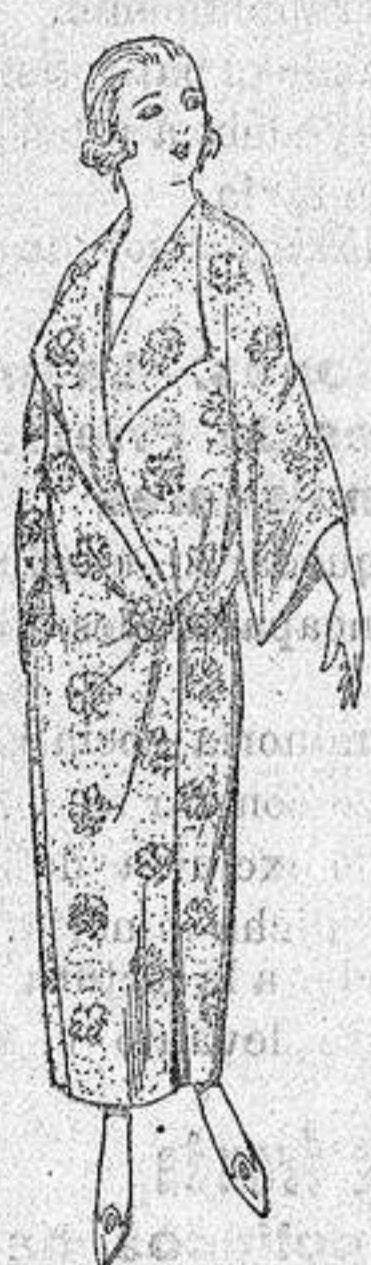
Batas de crespón estampado broche de adorno. a pesetas 25