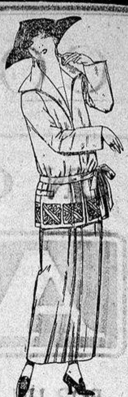
Trajes sastro, de gabardina, sarga inglesa etc., adornos bordados en negro azul y colores moda. a ptas. 115.