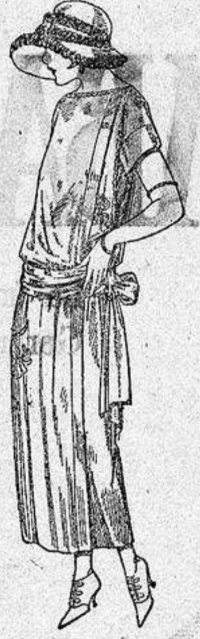
Vestidos de tricot de seda, en negro, azul y colores moda, adornos bordados a mano. a ptas. 125.