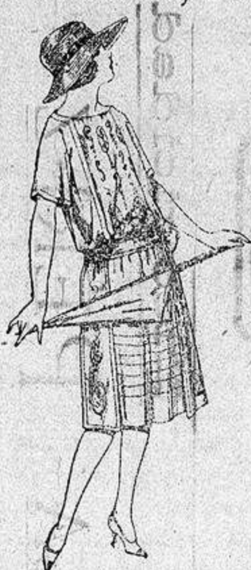
Vestidos de voile, adornos bordados para jovencitas de 13 a 15 años. a ptas. 40