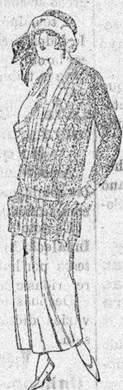
Paletots de punto de seda, dibujos novedad. a ptas. 90