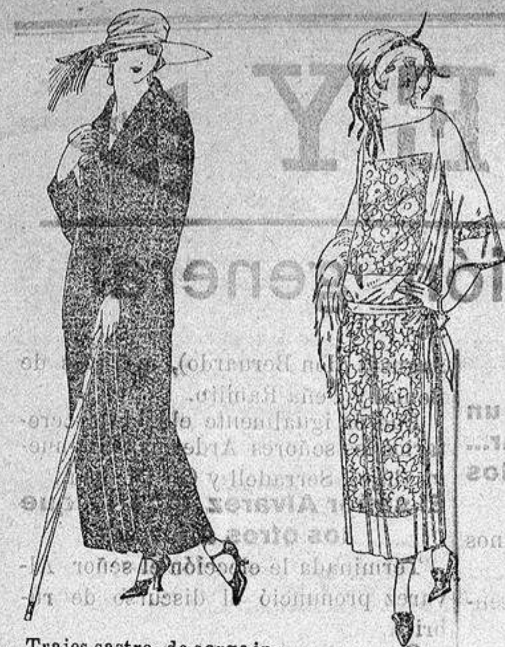
Trajes sastro, de sarga inglesa, popeline, etc., adornos bordados, chaqueta forrada de seda, en negro, azul y colores moda. de ptas. 120 a 135

Altamira, 2 :- Alicante :- Victoria, 1 Sucursales: Madrid, Barcelona, Almeria, Bilbao, Cadiz, Cartagena, Gijón, Granada, Málaga, Palma de Mallorca, Santander, Sevilla, Va- lencia, Valladolid, Zaragoza