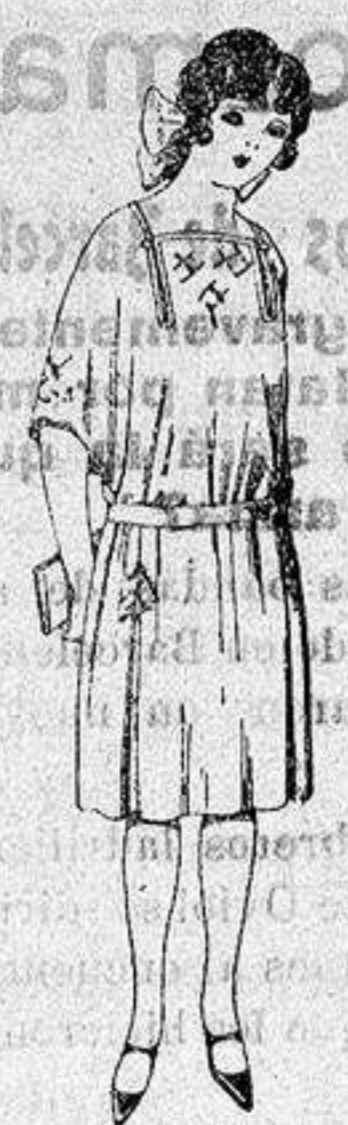
Vestidos de popeline, estambre, etc. en azul y colores moda adornos bordados para jovencitas de 13 a 15 años. a ptas. 60