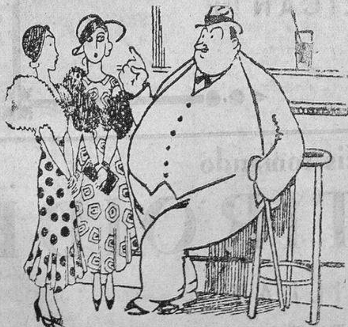
—Oid, pero agarraros bien, antes, porque os vais a asombrar. —Agárrate, chica, que hay curva...