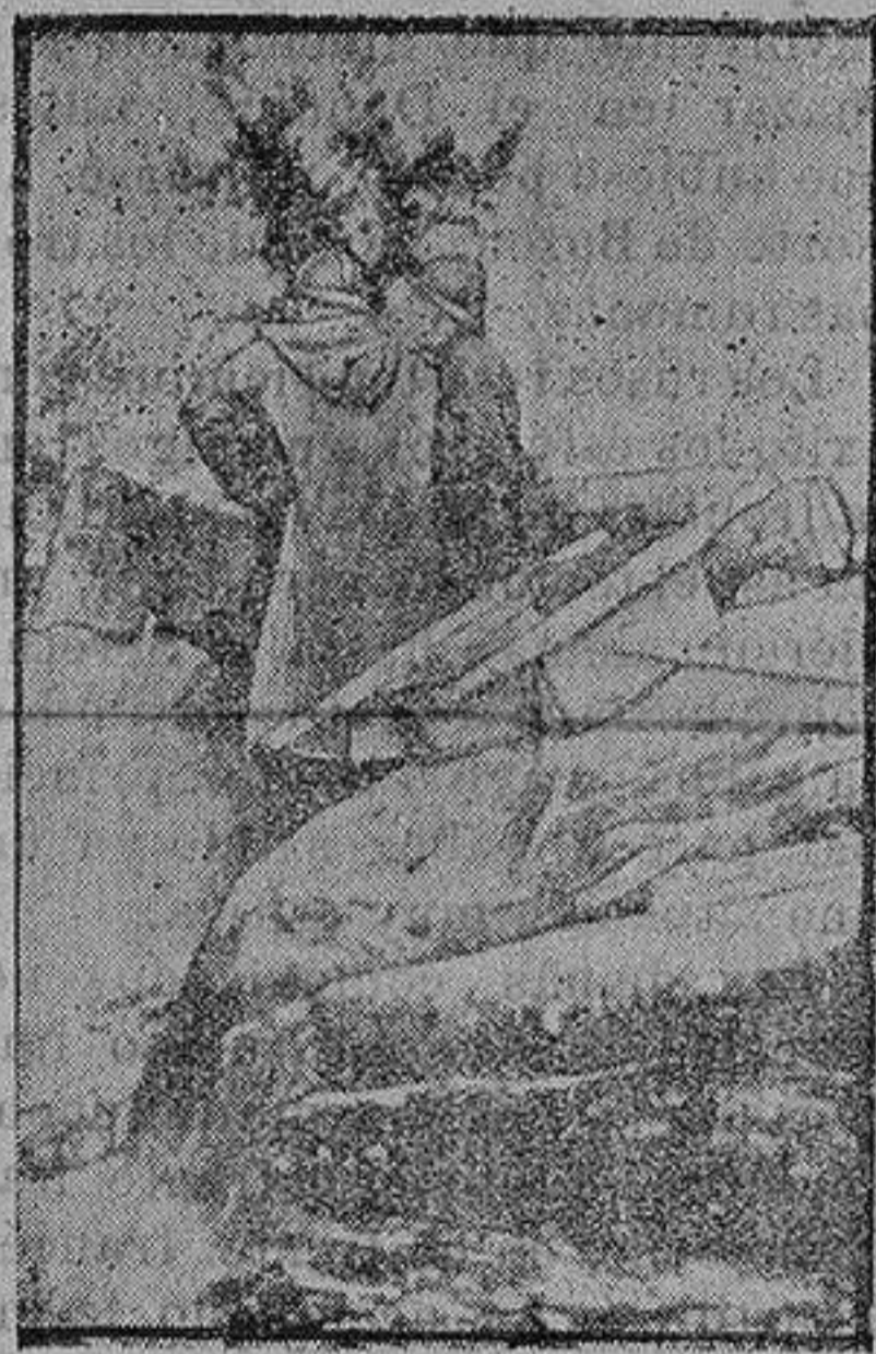
Oficiales franceses observando al enemigo