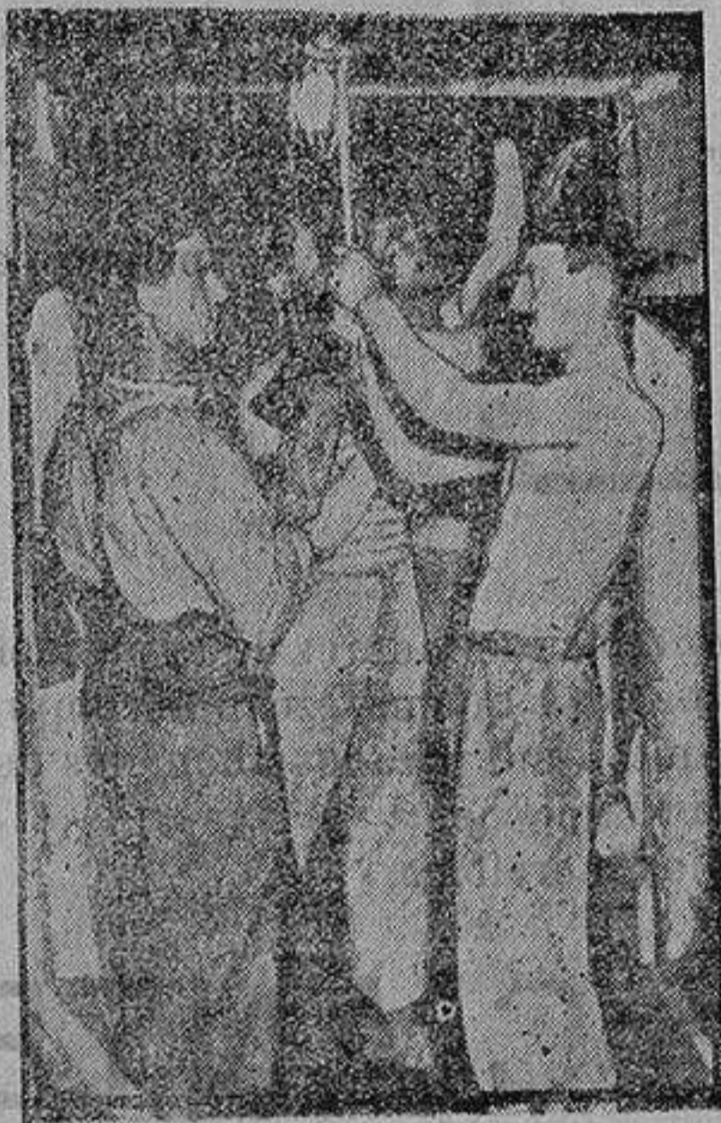
Mineros abriendo un subterráneo

Esta noche y a beneficio de los damnificados por las inundaciones en