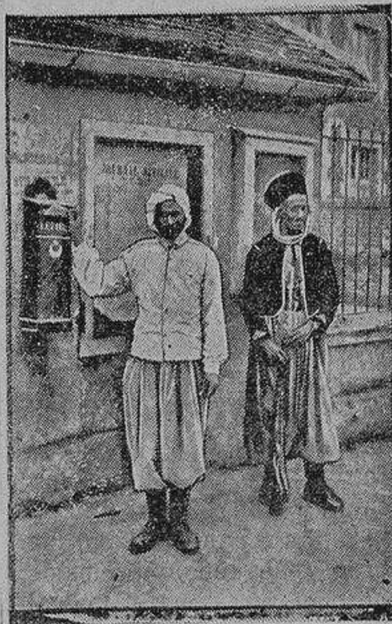
Argelinos depositando su correspondencia