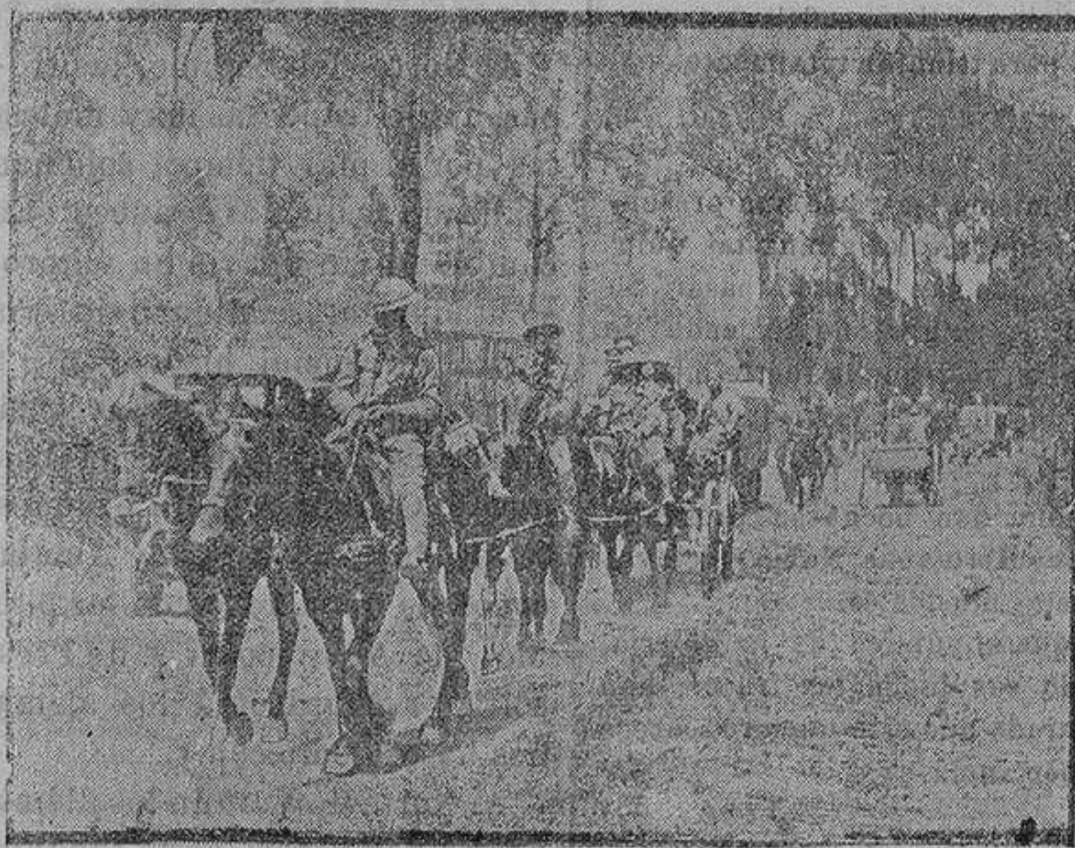
Transporte de soldados franceses é ingleses al frente de batalla

No tiene rival en España—Mezcla autorizada—De venta Panaderías, tiendas de Comestibles y confiterías. Representación en ésta: Calle de Guzmán, número 4