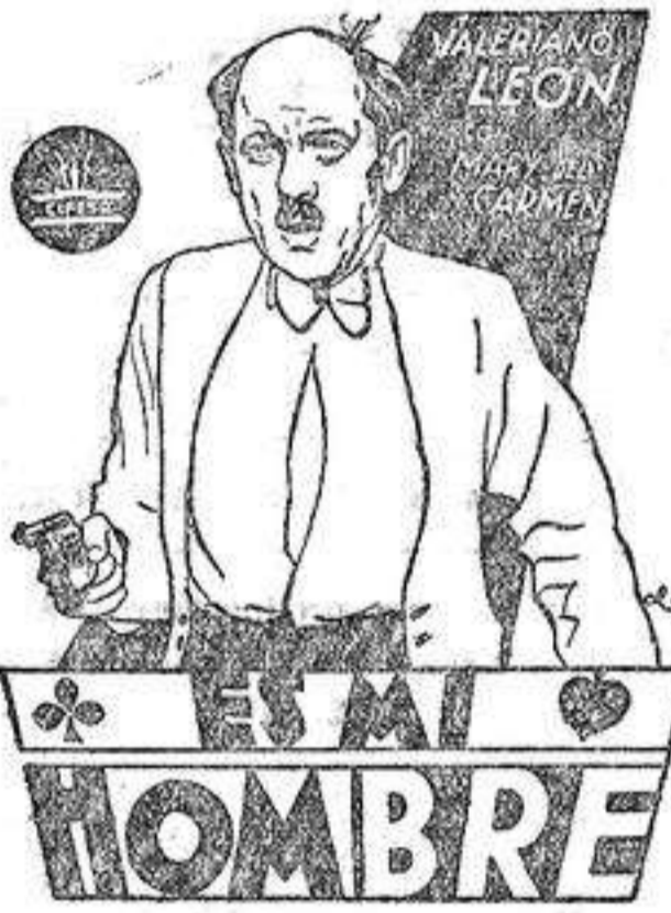
EL MEJOR CINE DE ALICANTE? NO HAY QUE DUDAR IDEAL CINEMA

Los tratamientos externos: lavados, masajes, no son más que paliativos que no atacan la causa del mal. Solamente un tratamiento interno es capaz de descomprimir la próstata. Las sales halógenas de magnesio, tomadas bajo la forma de grageas de Magnogene, son desde este punto de vista, de una eficacia poco corriente. La experiencia ha demostrado que una cura continua de Magnogene calma la inflamación de la próstata. Se aprecia cada día su disminución de volumen. Desaparecen igualmente las sensaciones de quemaduras y los pinchazos. La vejiga se vacía completamente y los deseos de orinar son menos frecuentes menos trágicos; las micciones vuelven a hacerse normales. El efecto del Magnogene se traduce en una mejora en el estado general, que en algunos casos toma el aspecto de un verdadero rejuvenecimiento. El extracto de la comunicación presentada en la Academia de Medicina de París, describiendo los efectos y resultados de este nuevo tratamiento, será enviado gratuitamente a quien lo solicite de la Sección B. Apartado 648, Madrid.