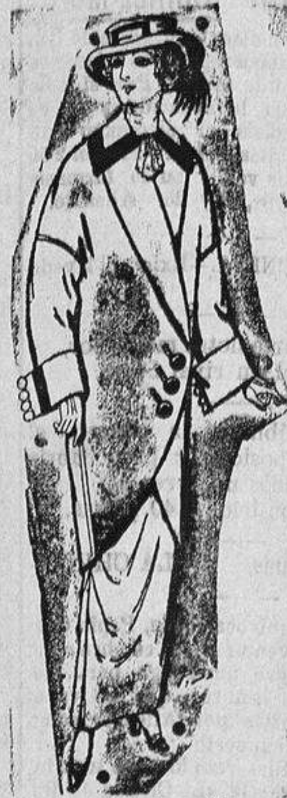
Abrigos de patén para señora De ptas. 5 a 65

NUEVO ESTANTE A PEDAL CON FRICCIONES de BOLSAS de ACERO LA MEJORA MAS UTIL QUE PODE DESEARSE.