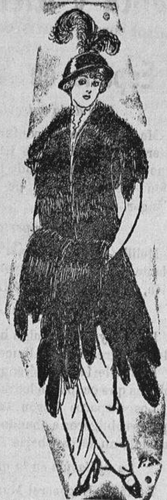
Juego de pieles imitación de Renard negro. De Ptas. 43 a 75