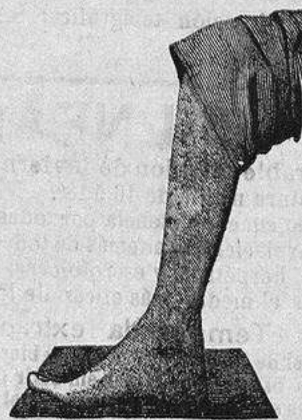
Después de la curación