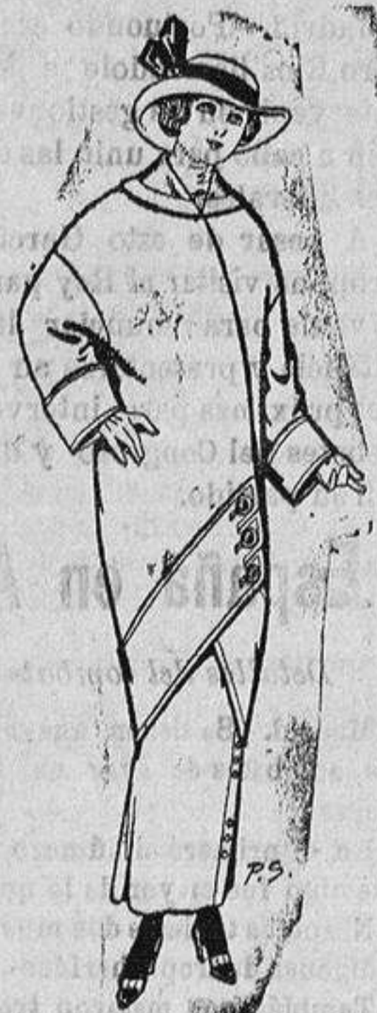
Abrigos de patén para jovenitos de 14 a 16 años De Ptas. 18 a 26

Madrid, Barcelona, Almeria, Bilbao, Cádiz, Cartagena, Gijón, Granada, Málaga, Palma de Mallorca, Santander, Sevilla, Valencia, Valladolid y Zaragoza.