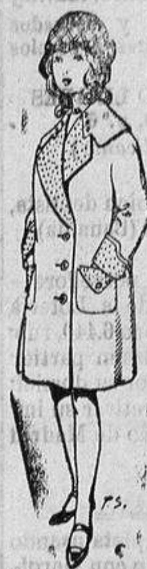
Abrigos para niñas de 4 a 12 años De pts. 15 a 24

Ropas confeccionadas para Caballeros y Niño y Artículos de la Temporada Confecciones de todas clases para SEÑORA y NIÑA