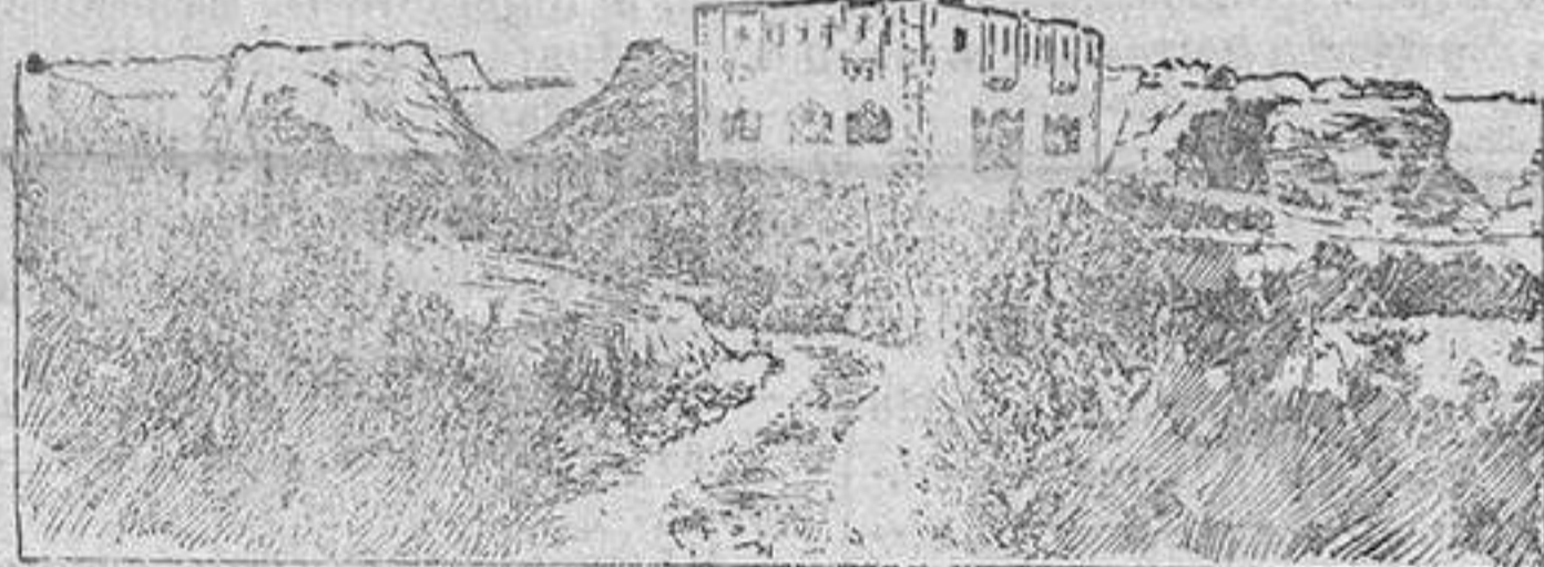
El fuerte de Sarah Bernardt en Belle Isle