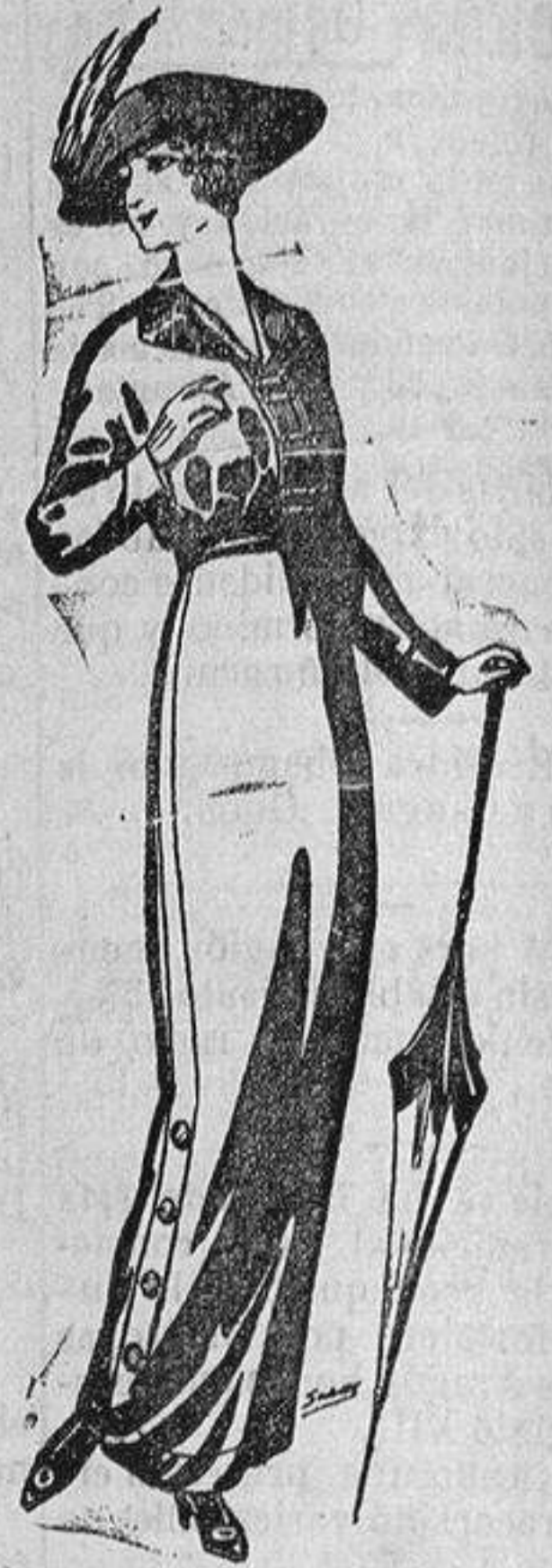
Trajes de lanilla cheviot de Ptas. 17'50 á 70

Ropas confeccionadas para Caballeros y Niño y Artículos de la Temporada